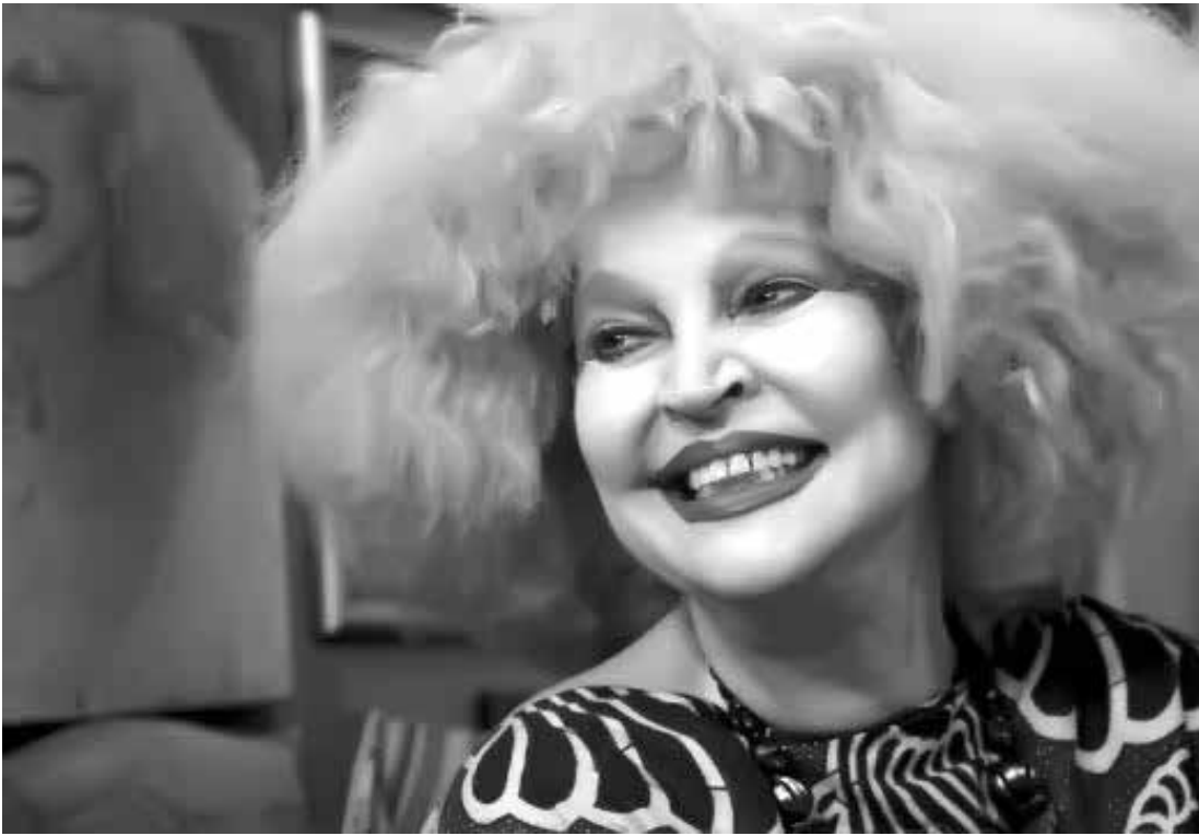
Atriz Elke Maravilha morreu aos 71 anos

A atriz Elke Maravilha, de 71 anos, morreu no início da madrugada de ontem. Ela estava internada desde o mês passado na Casa de Saúde Pinheiro Machado, em Laranjeiras, Zona Sul do Rio, para tratar uma úlcera duodenal. No perfil oficial de Elke no Facebook, foi publicada uma mensagem: “Avisamos que nossa Elke já não esta por aqui, conosco. Como ela mesma dizia, foi brincar de outra coisa. Que todos os deuses, que ela tanto amava estejam com ela nessa viagem. Eros anikate mahan (O amor é invencível nas batalhas). (Crianças, conviver é o grande barato da vida, aproveitem e convivam)”. Nascida Elke Georgievna Grunnupp em Leningrado (atual São Petersburgo), na Rússia, em 22 de fevereiro de 1945 — pouco mais de dois meses antes do fim da Segunda Guerra na Europa — a atriz chegou ao Brasil aos 6 anos de idade. Foi bancária, secretária trilingue, bibliotecária, mode-