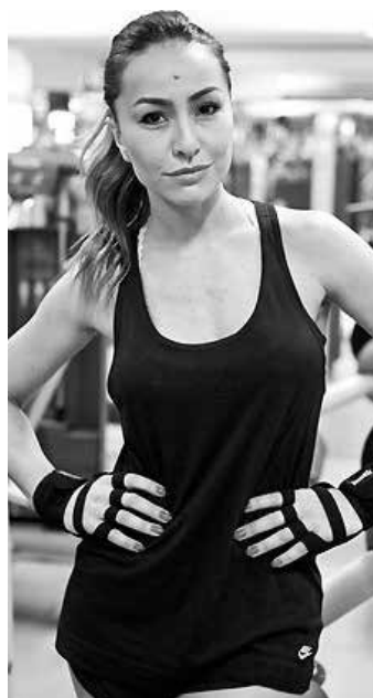
Sabrina Sato lança método de treinos e comenta dieta: ‘Não abro mão do docinho’

te clique de biquíni, alguns fãs afirmaram que ela estava magra demais. “Que magreza é essa? E esse osso?”, escreveu um. “Japa, você está muito magra”, disse outro fã. Nos comentários, a apresentadora respondeu aos risos: “Na foto saí magra, né? Adoro parecer mais magra!”