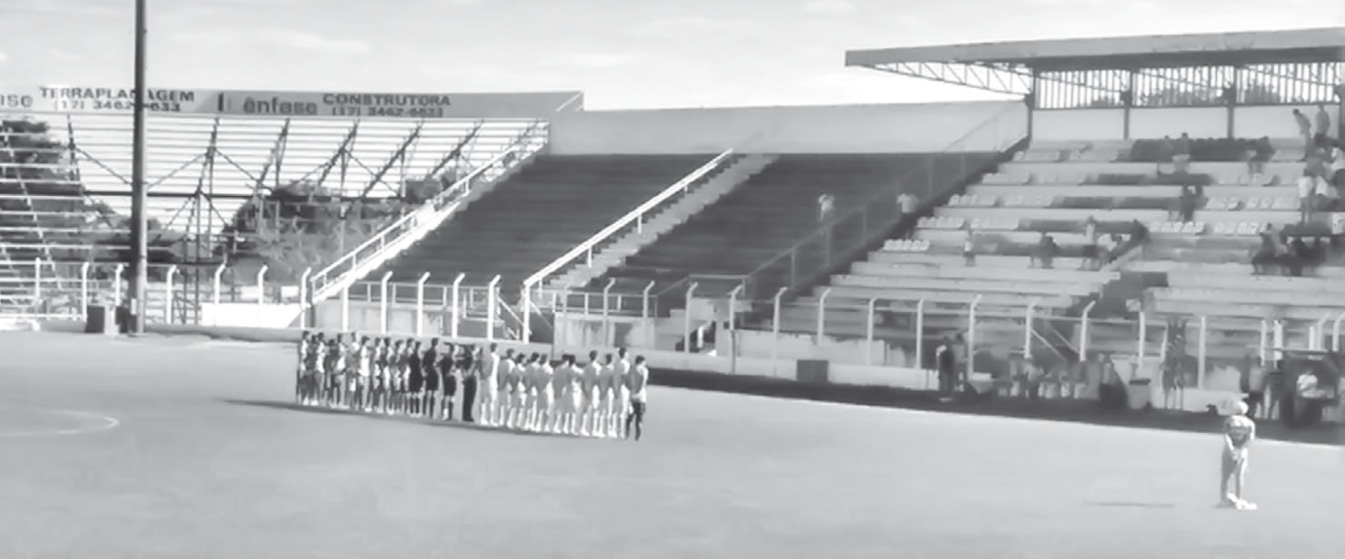
Fefecê espera somar mais três pontos no Paulista Sub-20 diante de sua torcida