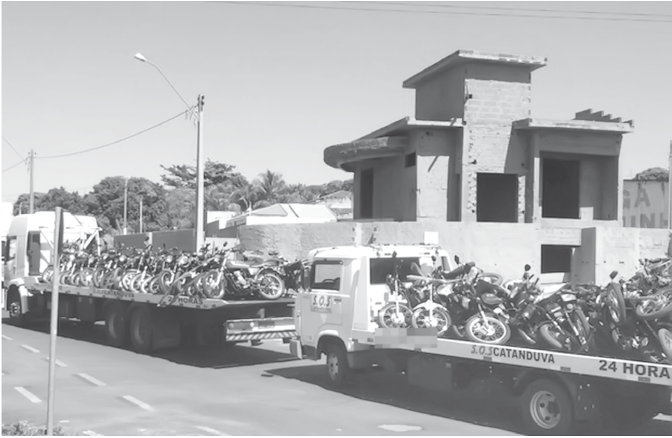
Motos apreendidas pela polícia durante a operação

gramas) e uma porção de maconha (3,9 gramas). Ainda de acordo com a Polícia, na oportunidade, ainda foi encontrada uma faca utilizada para fracionar a droga em porções menores para a venda/consumo. O procedimento era feito na rua. Diante do fato, o trio foi conduzido ao Plantão Policial para prestar depoimento. Posteriormente, os jovens foram encaminhados à Cadeia Pública de Guarani d'Oeste, na qual, até o fechamento desta edição, permaneciam à disposição da Justiça. I.A. responderá por tráfico de drogas, crime que prevê de 5 a 15 anos de prisão, em caso de condenação. Os menores de idade, que responderão pelo ato infracional, estão detidos em uma cela separada dos demais presos. A Vara da Infância e Juventude de Fernandópolis cuida do caso enquanto a DISE (Delegacia de Investigações Sobre Entorpecentes) investiga os fatos. A prisão de mais pessoas não está descartada.