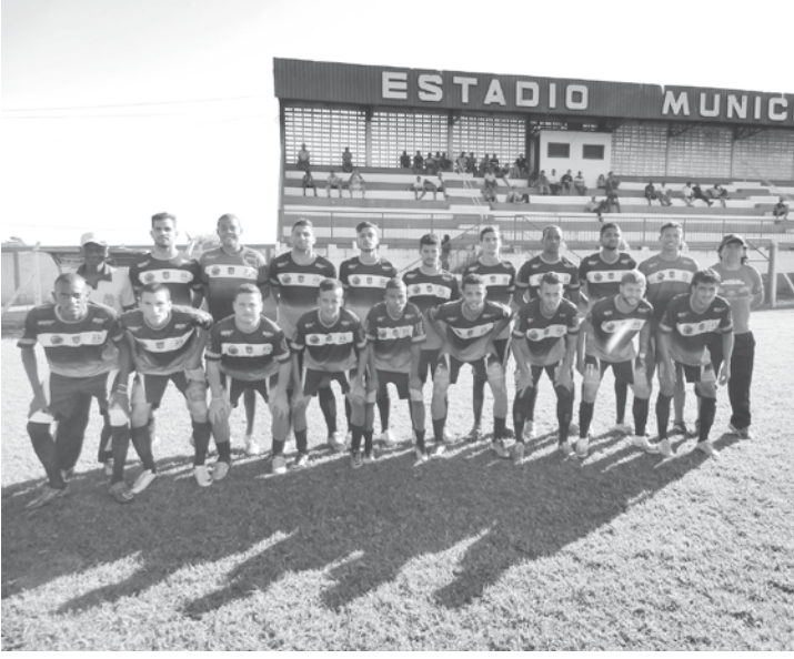
Equipe técnica e jogadores profissionais que defendem o Clube Esportivo Ouroeste

O Clube Esportivo Ouroeste enfrenta neste sábado, dia 27, o Jalesense Atlético Clube. O jogo será às 15h no estádio municipal “Manoel Dias da Silva”, em Ouroeste. Na partida preliminar as equipes se enfrentam na categoria Sub-18. De acordo com o regulamento, classificam-se para a próxima fase as quatro melhores equipes.