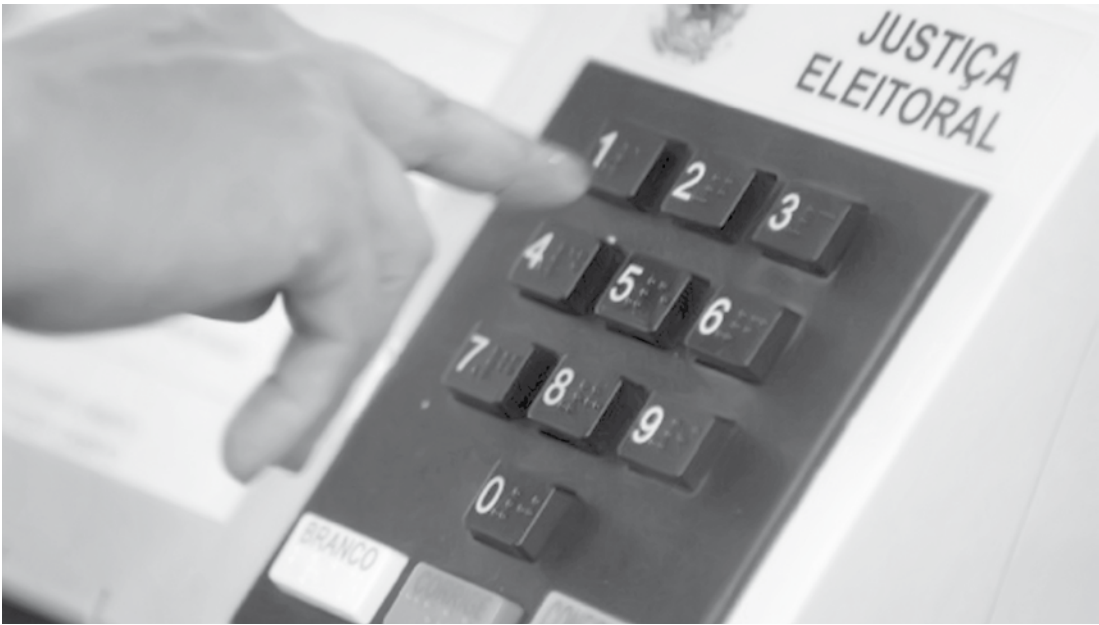
No pleito deste ano, serão utilizadas 550 mil urnas eletrônicas em todo o Brasil

conseguiram coletar a ordem em que cada candidato foi votado e, comparando com a lista de eleitores da seção, quebrariam o sigilo dos votos. Além disso, ele afirma ter encontrado brechas mais graves que permitiriam, até, a manipulação de resultados. Para ter mais segurança, ele pede que haja também o registro de voto impresso. VOTO IMPRESSO A partir de 2018 será obrigatória a impressão do voto registrado nas urnas eletrônicas, conforme aprovado pelo Congresso na Lei 13.165/2015. Após a votação eletrônica, o equipamento emitirá também um registro