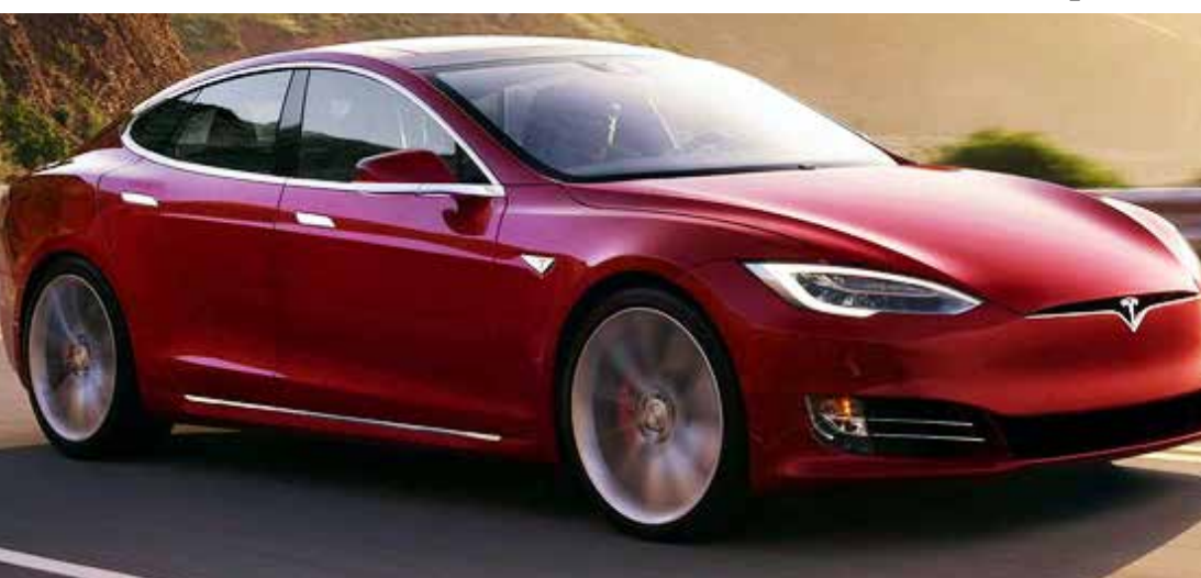
Tesla Model S: o elétrico que rende o mesmo que um V16 de 8 litros

O futuro é mesmo elétrico! Model S acelera o mesmo que o novo Bugatti Chiron, custa 5% e tem autonomia de 613 quilômetros