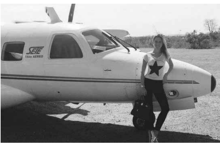
Post divide opinião de internautas