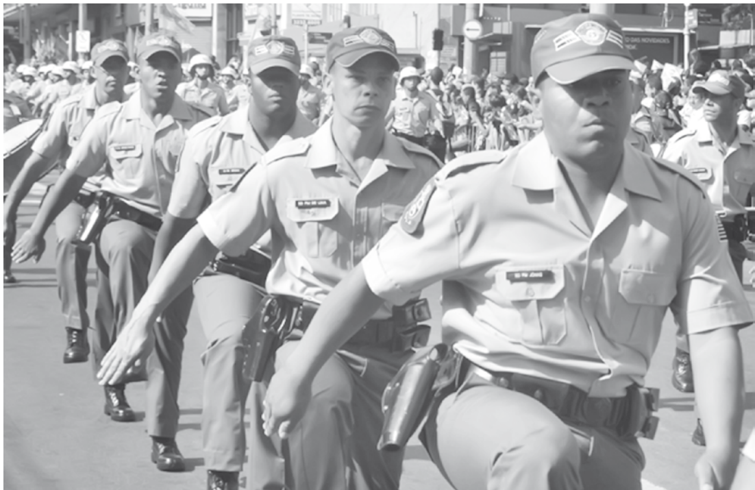
Requisitos: altura mínima para homens é de 1,60 metro de altura e, para mulheres, 1,55 cm