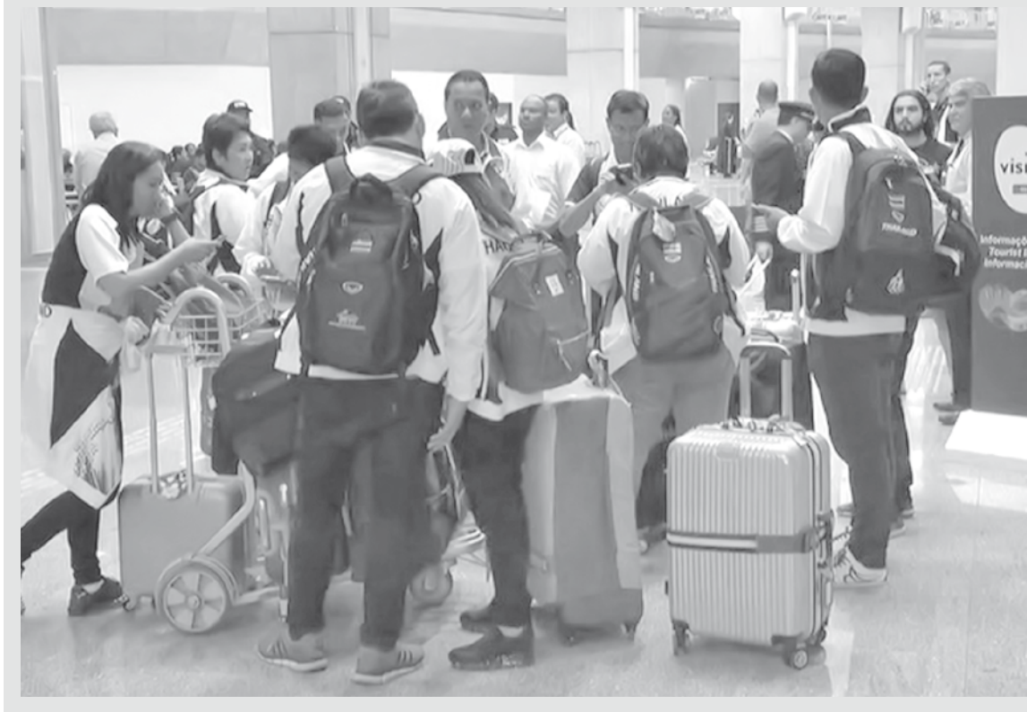
imagem do dia

Delegações paralímpicas começam a chegar ao Rio. O movimento já é intenso no Aeroporto Tom Jobim (Galeão), principal porta de entrada da cidade para quem vem do exterior. Parte da delegação da Tailândia, a delegação do Panamá, pessoas da França, Itália, Alemanha e outros países que participarão da Paralimpíada também já estão no Rio. A Paralimpíada terá 21 áreas de competição, nas quais serão disputadas 22 modalidades, disputadas por 4.350 atletas.