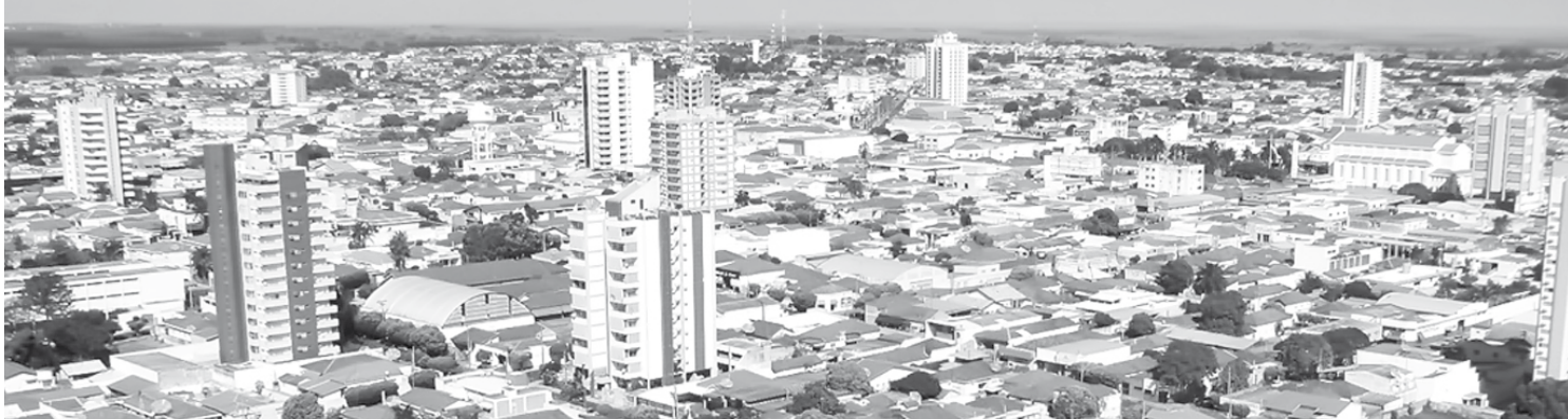
Fernandópolis tem 563 habitantes a mais, segundo o IBGE

→ JORGE PONTES jorge@oextra.net O Instituto Brasileiro de Geografia e Estatísticas (IBGE) divulgou na última terça-feira, no Diário Oficial da União, a estimativa da população brasileira apontando que o país tem 206.081.432 habitantes. Em agosto de 2015, o mesmo levantamento estimou a população, na época, em 204.450.649. Em pesquisa ao portal do Instituto, “O Extra.net” teve acesso às informações de cada município da região. Fernandópolis, por exemplo, que no último censo IBGE, de 2014, possuía 67.836 habitantes, obteve