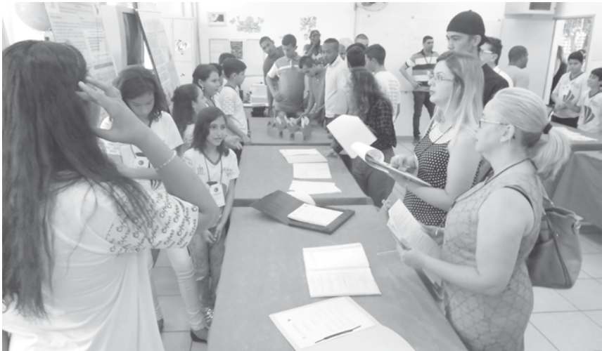
Pesquisadores e avaliadores: projeto de pré-iniciação científica – Ensino Fundamental