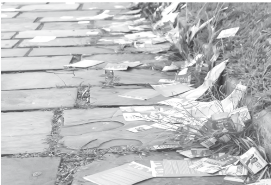
Candidatos não podem jogar santinhos nas ruas no dia das eleições

“A participação de todo cidadão para que as eleições transcorram sem má-