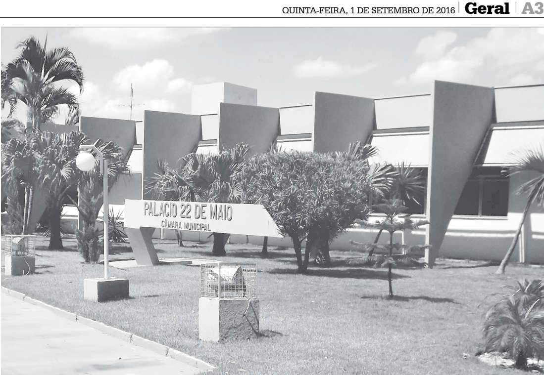
Capacitação ocorrerá na Câmara Municipal de Fernandópolis

O registro de mesários voluntários é atemporal e pode ser feito pelo www.tse.jus.br . Para tentar ser mesário voluntário, é necessário preencher um formulário virtual. Contudo, o cadastro não oferece garantia de convocação. Mais informações podem ser obtidas no Cartório Eleitoral de Fernandópolis pelo telefone (17) 3462-1173 ou pessoalmente na Avenida Expedicionários Brasileiros, 638, no Jardim Santa Helena.