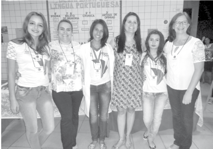
Cerimônia de premiação: alunos premiados juntos à equipe gestora da escola