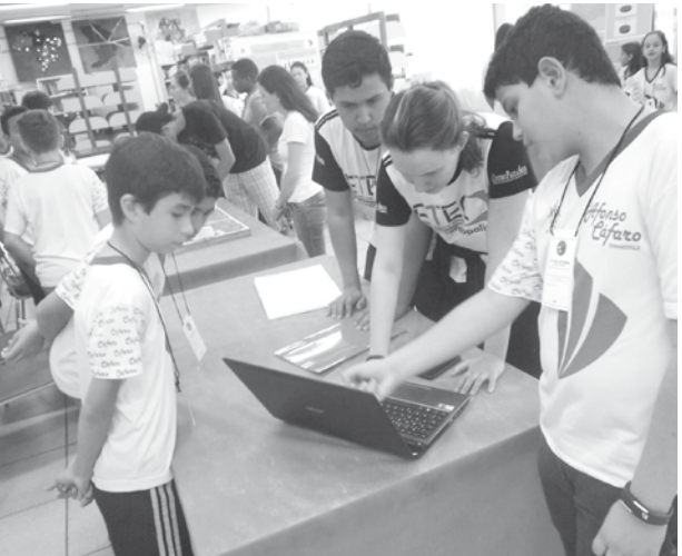
Visitação dos trabalhos de pré-iniciação científica do Ensino Fundamental

Evento sediado na escola estimula alunos a desenvolver trabalhos de pesquisa científica