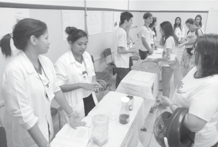
Alunos apresentando trabalho de demonstração científica: Ensino Médio