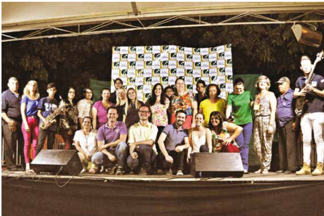
Fernandópolis sendo representada por jovens músicos do “Os Sonhadores”