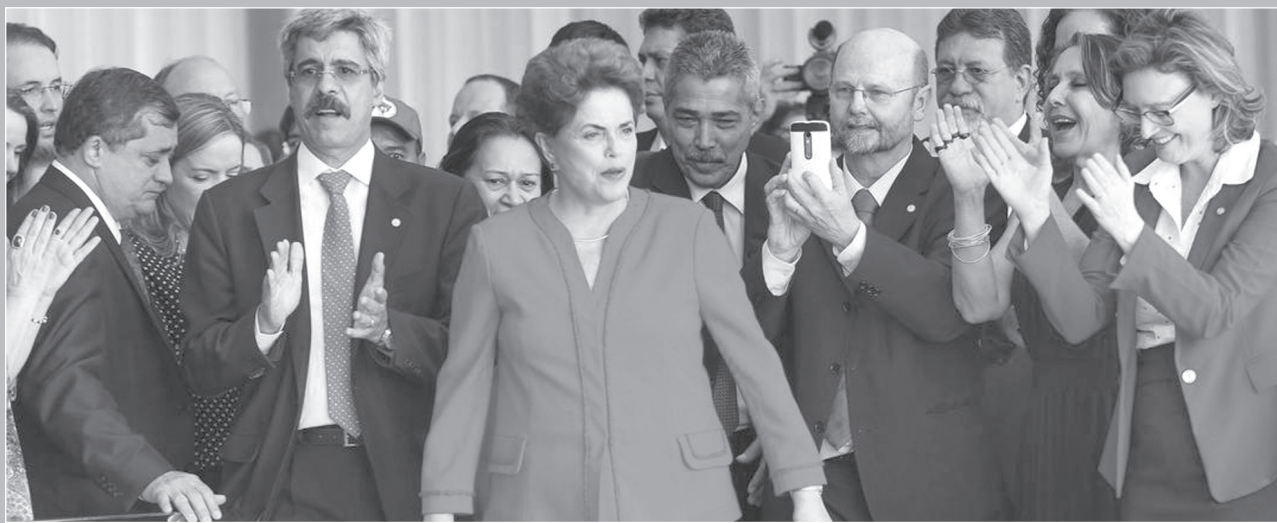
imagem da semana

HISTÓRIA - Quarta-feira, 31 de agosto. O dia em que Dilma Rousseff-PT teve o mandato cassado. De quatro presidentes eleitos democraticamente, dois foram cassados na história recente. Na foto, ela chegando para o pronunciamento oficial.