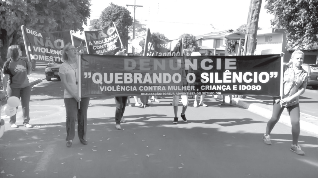
Trata-se de um projeto educativo e de prevenção contra o abuso e a violência doméstica