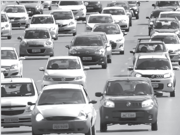
Veículos trafegam com farol baixo desligado durante o dia

No primeiro mês de validade da regra, entre 8 de julho e 8 de agosto, a Polícia Rodoviária Federal registrou 124.180 infrações nas rodovias federais. Nas estradas estaduais de São Paulo, outras 17.165 multas foram aplicadas. No Distrito Federal, as multas superaram em