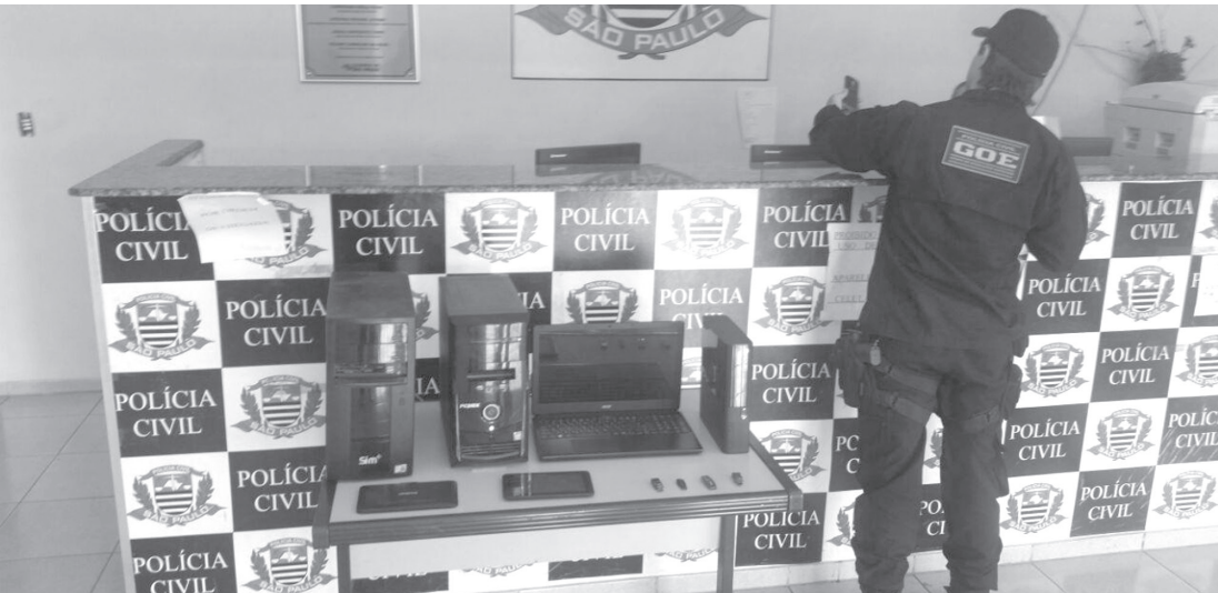
Policial verifica equipamentos apreendidos durante operação

No Oeste Paulista, foram presos 14 homens e cumpridos 14 mandados de busca e apreensão domiciliares. No interior das residências dos autores, conforme a Polícia Civil, foram encontrados computadores pessoais – que estão apreendidos – com registros contendo cenas de sexo explícito e pornográfico envolvendo crianças e adolescentes.