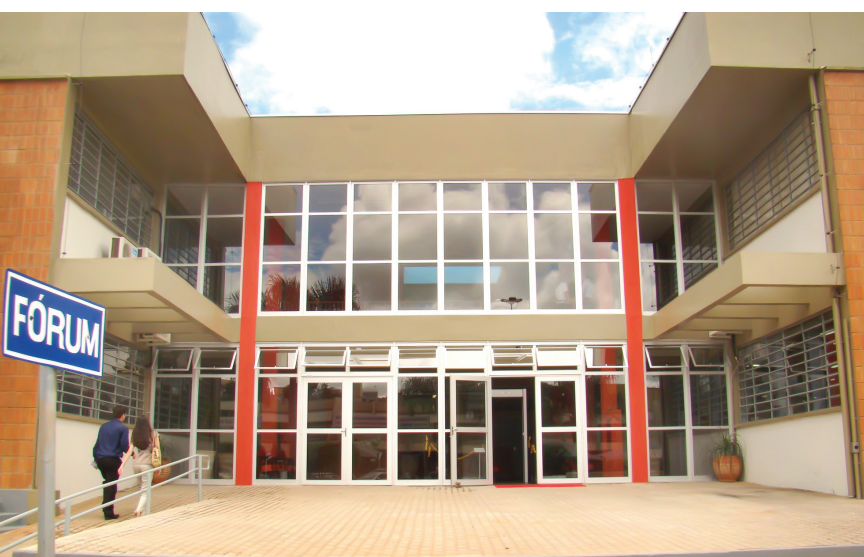
Candidatos a padrinho e madrinha devem fazer suas inscrições até no próximo dia 16, no Fórum de Fernandópolis

As famílias que tiverem interesse em fazer a inscrição para o programa devem comparecer nos setores de Psicologia e Serviço Social do Fórum de Fernandópolis até o próximo dia 16, das 10 às 18h. Depois de efetivado o cadastro, onde serão analisados diversos critérios, os candidatos serão submetidos a um estudo social e psicológico e posteriormente participarão de um curso preparatório, que é obrigatório.