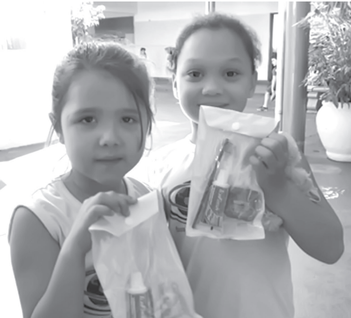
Kits são compostos por uma escova dental, um creme dental, um fio dental e um estojo para armazenar os itens de higiene bucal

ra garantir o bem estar da saúde”, comentou o prefeito Tião Geraldo. A equipe responsável pela Saúde Bucal dos alunos da rede escolar realizou palestras nas escolas, conscientizando as crianças da importância da