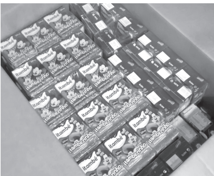
Lote de achocolatado havia sido recolhido de mercados após interdição da Anvisa