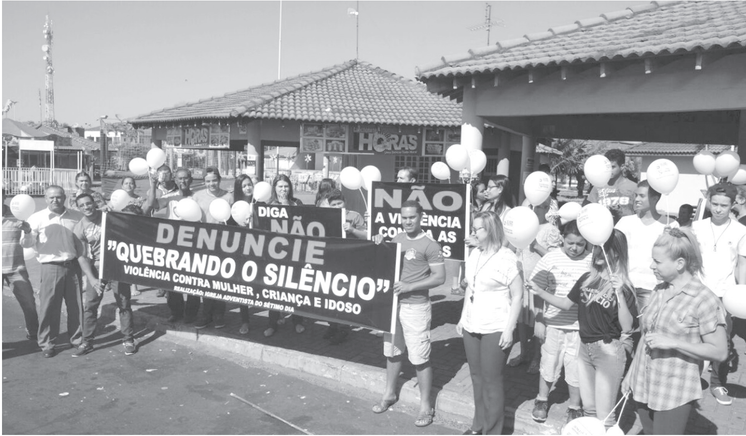
Membros da Igreja Adventista do Sétimo Dia de Ouroeste durante a passeata no centro da cidade

A cada ano esta campanha tem uma ênfase diferente, mas o fundamento consiste em conscientizar as pessoas sobre o respeito às mulheres, às crianças e aos idosos. A campanha se desenvolve durante todo o ano, mas uma das suas principais ações ocorre sempre no quarto sábado do mês de agosto. Este é o “Dia de ênfase contra o abuso e a violência”, quando ocorrem passeatas, fóruns, escola de pais, eventos de educação contra a violência e manifestações na América do Sul.