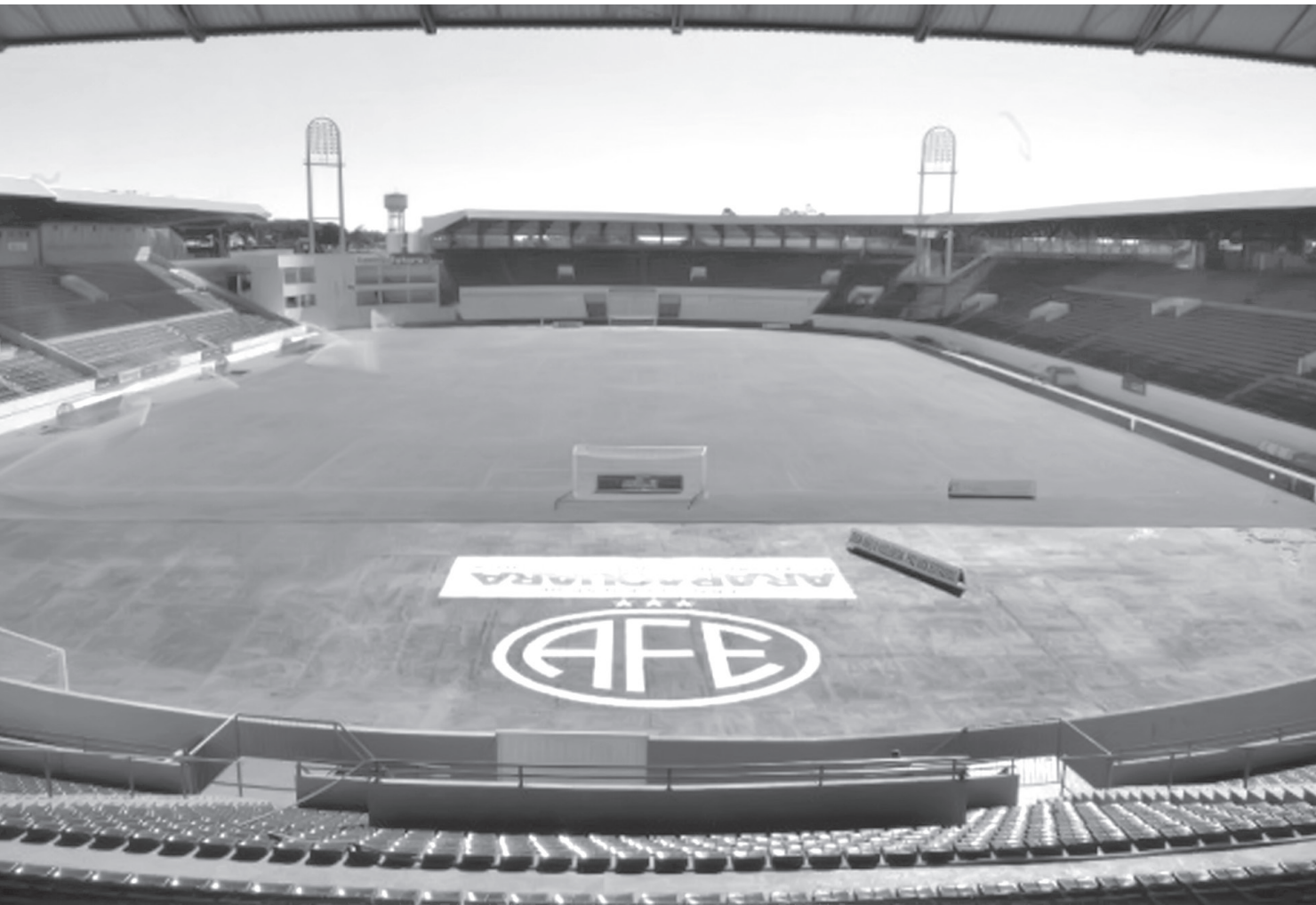
Embate será realizado logo mais na Arena Fonte Luminosa

Águia é vice-líder do Grupo 1 e espera “devolver” a derrota que sofreu no primeiro turno, em casa, para o adversário de hoje