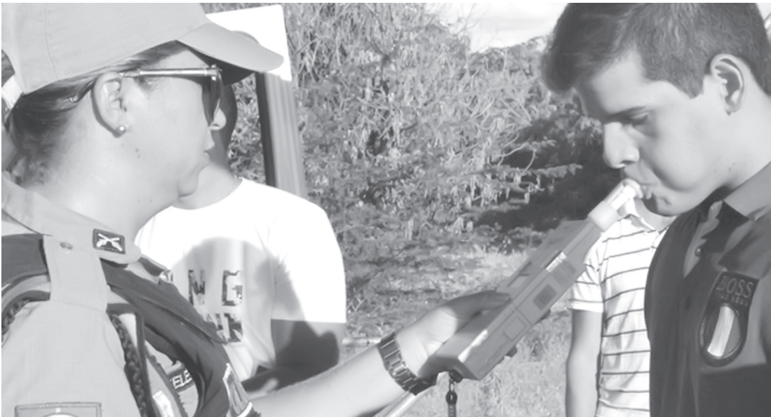
Motorista realiza o teste com etilômetro