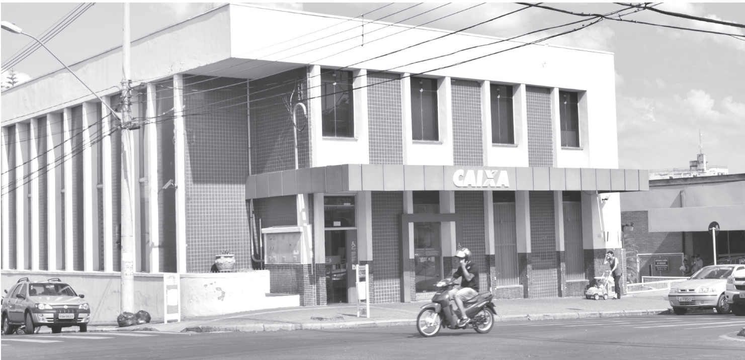
A Caixa Econômica Federal deve ser uma das agências de Fernandópolis a aderir novamente ao movimento grevista

→ JORGE PONTES jorge@oextra.net As agências bancárias de Fernandópolis devem amanhecer na terça-feira, dia 06, sem atendimento ao público. Os bancários de São Paulo decidiram na última quinta-feira (1º), durante assembleia na capital paulista, aderir à greve que também já foi confirmada em Porto Alegre e Curitiba, segundo a Contraf-CUT (Confederação Nacional dos Trabalhadores do Ramo Financeiro). Os bancários pedem reajuste salarial de 5%, mais a reposição da inflação - 9,57%. Os bancos ofereceram reajuste de 6,5% para o salário e demais benefícios, além do pagamento de abono de R$ 3 mil. A confederação, que representa cerca de 140 sindicatos do setor, não divulgou balanço completo de adesão à greve e outras assembleias