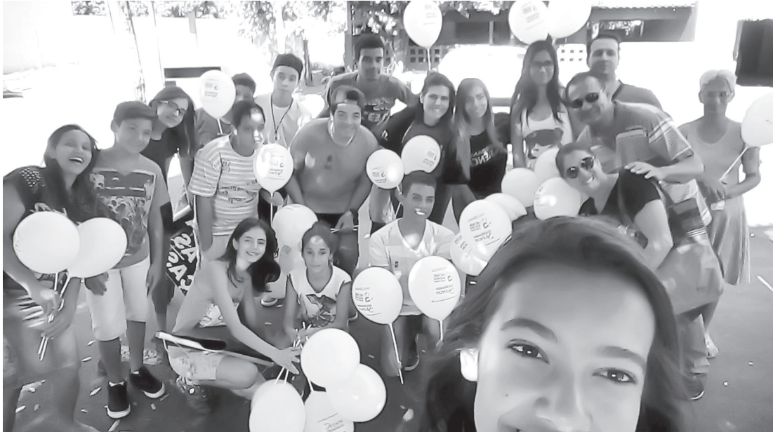
Campanha se desenvolve durante todo o ano, mas uma das suas principais ações ocorre sempre no quarto sábado do mês de agosto