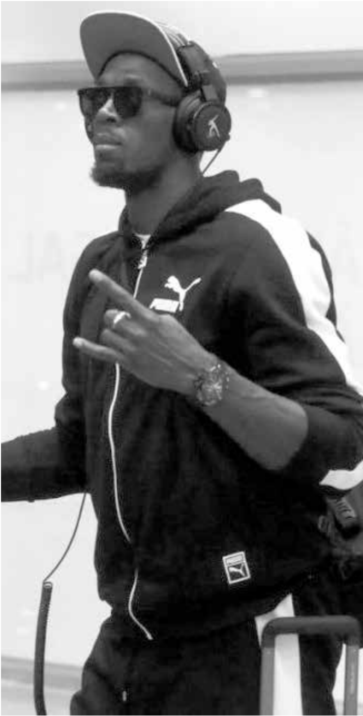
Usain Bolt quer voltar ao Rio, desta vez com a namorada