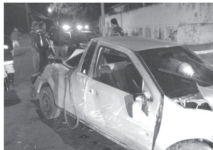
Carro ficou destruído com a batida

rança, sofreram alguns arranhões e dor no peito devido ao impacto. Eles foram socorridos e passam bem. Ainda de acordo com os bombeiros, o motorista estava visivelmente embriagado.