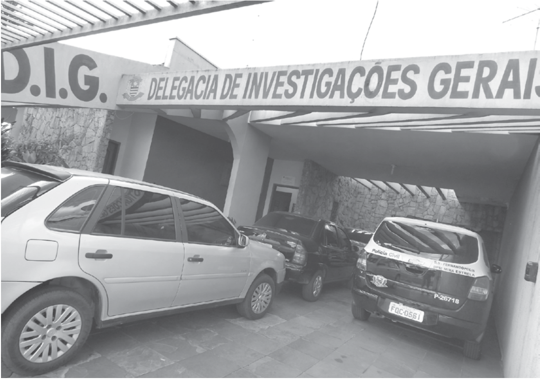
DIG de Fernandópolis comanda as investigações

* Com informações do site Jales Notícias e Portal G1.