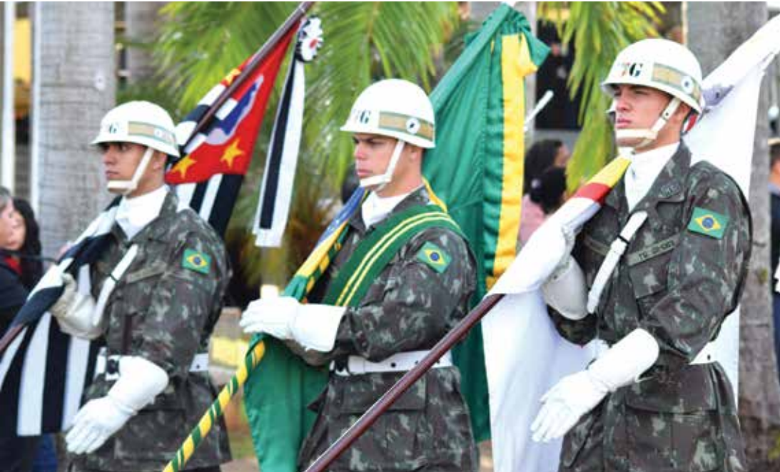
Desfile aconteceu na Avenida Raul Gonçalves Júnior, próximo à OAB