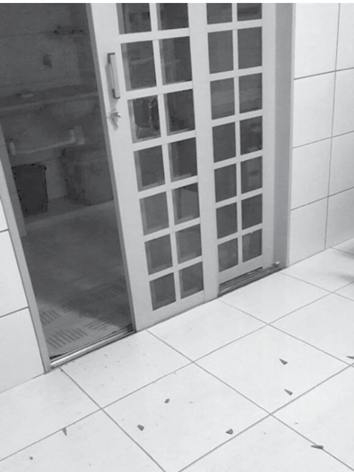
Criminosos adentraram ao imóvel mediante arrombamento da porta da cozinha