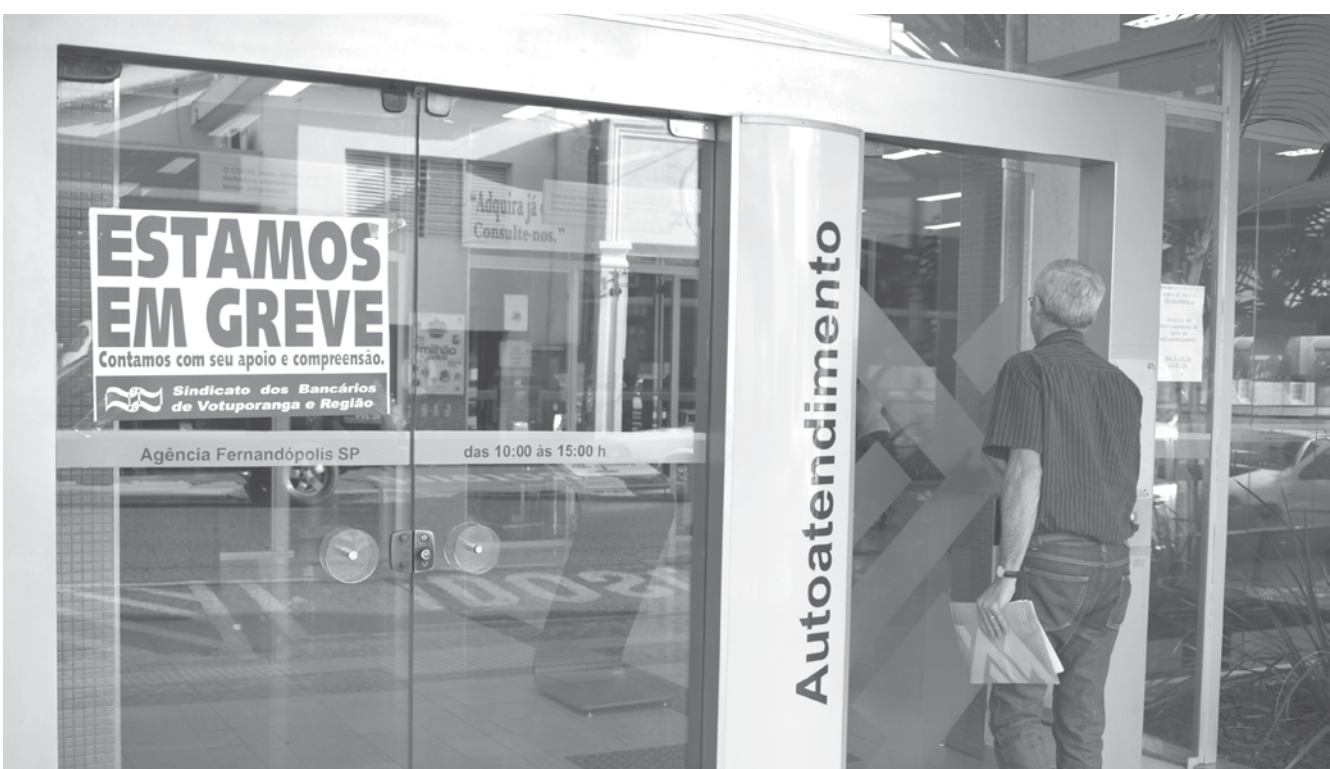
Agência do Banco do Brasil, na Rua Rio de Janeiro, já em greve nesta quinta

Exceto Bradesco, todas agências paralisaram o atendimento na cidade, antecipando decisão do sindicato que previa o início da greve para o próximo dia 12