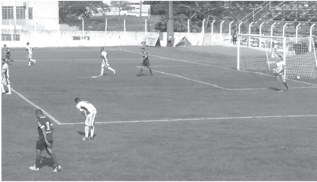
Partida equilibrada, em Fernandópolis, terminou com o placar em 1 a 1

Nesta fase, de acordo com o regulamento, as equipes jogam entre si, em turno e retorno, e classificam-se às oitavas de final os quatro primeiros colocados de cada grupo.