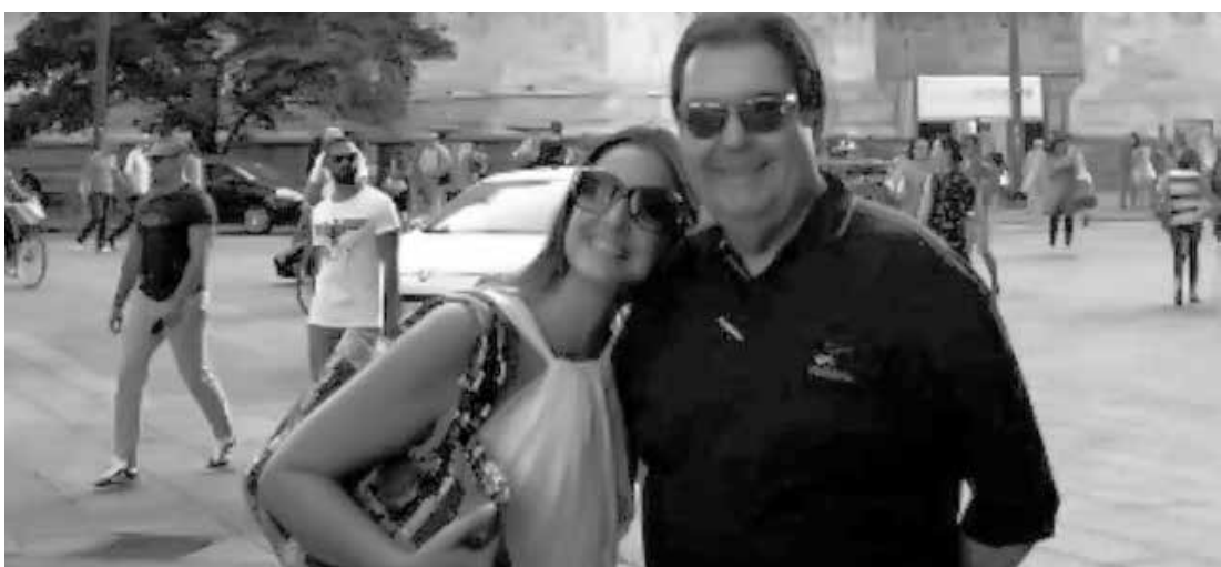
Casal comemora mais um ano de união

porque eu ficava no almoxarifado da cantina. Foi ali que comecei a engordar”, disse, com sua irreverência de sempre. Hoje, no entanto, Fausto disse controlar o garfo. “A alegria do gordinho operado é indicar as comidas para os outros”, divertiu-se Faustão ao rebater Jô, que entregou que o amigo sempre o faz comer demais nos encontros regados a pizzas. Nas redes sociais o público foi à loucura e o assunto ficou entre os assuntos mais comentados no Twitter.