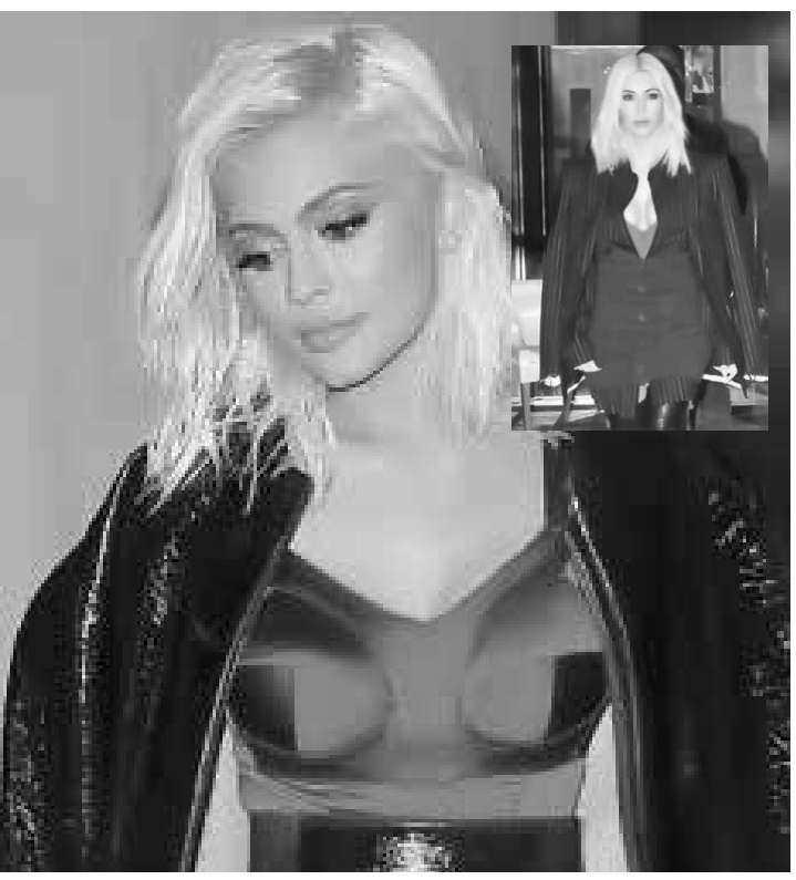
Kylie Jenner loura. Kim Kardashian loura, no detalhe

Kylie Jenner, de 19 anos, inovou o visual, ficou louríssima, e não escapou de ser comparada à irmã mais famosa, Kim Kardashian. A jovem empresária divulgou uma foto na qual exibiu seu novo look plantinado. Seguida por um batalhão de fãs, ela conquistou mais de um milhão de curtidas no clique e, claro, muitos elogios. No entanto, a semelhança com a irmã socialite não deixou de ser notada. “Pensei que fosse a Kim loura”, escreveu um internauta. “Você parece a Kim com cabelo louro”, concordou outro. “Você está cada vez mais parecida com sua ir-