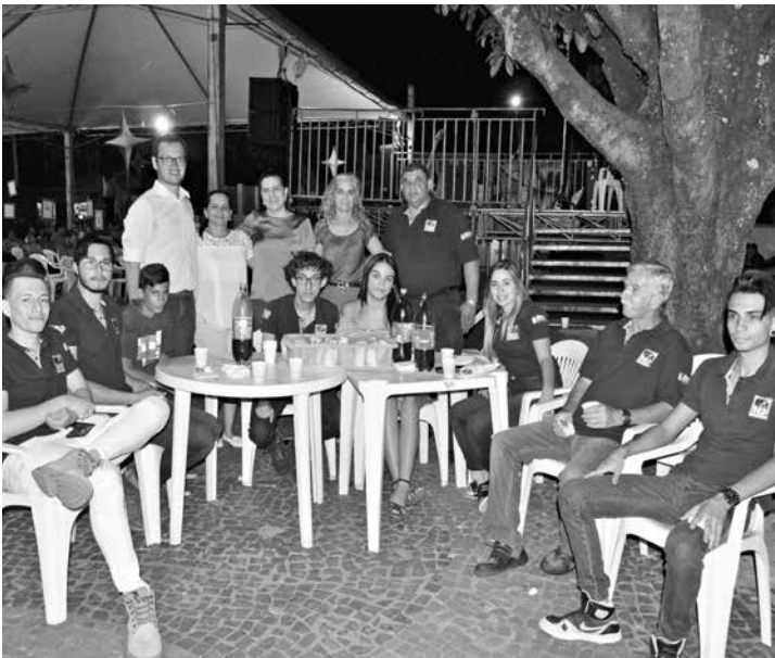
Músicos do “ Os Sonhadores ” em recente visita e apresentação na cidade de Cardoso.