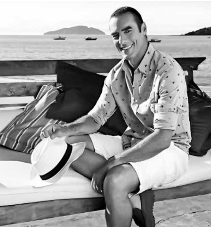
Zulu está chateado com o acontecido e vai buscar seus direitos na justiça

Os seguidores de Paulo Zulu levaram um susto na noite do último domingo: sua conta no Instagram foi hackeada, e o invasor publicou uma foto do modelo nu. Com a imagem já devidamente apagada, ele se pronunciou sobre o fato, afirmando que vai entrar na Justiça para encontrar os culpados. “Sobre a repercussão da foto me sinto no dever e no direito de esclarecer tudo pra vocês que me acompanham aqui. Esta é a versão oficial sobre tudo isso! Estou muito chateado com esta invasão e já estou tomando as medidas jurídicas necessárias. Em 25 anos de carreira nunca algo semelhante aconteceu comigo e não gostaria que isso acontecesse