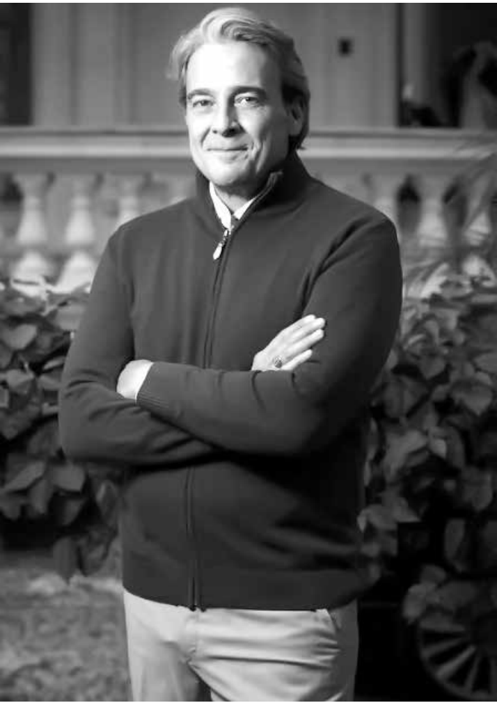
Alexandre Borges não pretende ir à Justiça para punir quem vazou o vídeo

P rocurado após ter um vídeo íntimo divulgado na internet, Alexandre Borges decidiu romper o silêncio e falar sobre o assunto. Ele foi filmado, sem saber, na companhia de uma mulher e outras duas pessoas, que seriam transexuais, num apartamento. O ator nega que tenha havido sexo e consumo de cocaína como foi sugerido nas redes sociais. E pretende manter a questão longe de ações judiciais. “Sei que este é um assunto pessoal. Não estou aqui me desculpando de nada. Não pretendo tomar nenhuma atitude jurídica”, avisa.