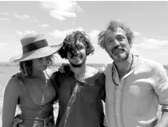
Última gravação feita por Montagner, horas antes de morrer

Diretor de “Velho Chico”, Luiz Fernando Carvalho decidiu como vai manter o personagem de Domingos Montagner no folhetim das 21h. O profissional vai decorrer ao recurso de câmeras subjetivas nas filmagens.