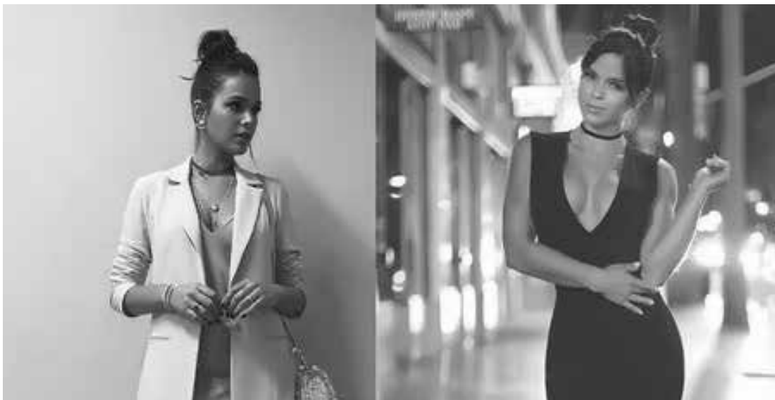
Michelle Lewin, a sócia sarada de Bruna Marquezine, ao lado a atriz

Torcedora do Barcelona, Michelle poderia representar uma “ameaça” a Marquezine? Que nada! A moça é fã de Cristiano Ronaldo. Neymar não está na sua lista de preferências. Casada há cinco anos com um personal trainer sueco, a morena mora hoje em Miami, on-