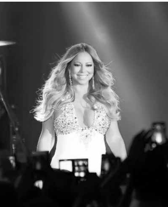
Mariah Carey pode ser uma das estrelas do especial