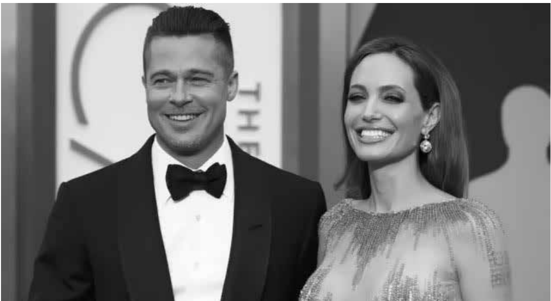
Angelina e Brad Pitt estavam juntos desde 2004, mas o casamento foi oficializado apenas em agosto de 2014

isso, inclusive, ela pede guarda exclusiva das crianças. Ela não estaria satisfeita com os “métodos” de Brad em relação aos filhos. “Ela liberou o inferno”, teria dito Pitt sobre toda a situação para uma fonte do TMZ. Além disso, o ator estaria apavorado com a perseguição dos paparazzi com a divulgação do divórcio. A casa do casal já foi cercada pelos fotógrafos e, segundo o “TMZ”, agentes da Polícia de Los Angeles fazem rondas pelo local. As fontes do “TMZ” afirmam ainda que Brad e Angelina tiveram muitas conversas