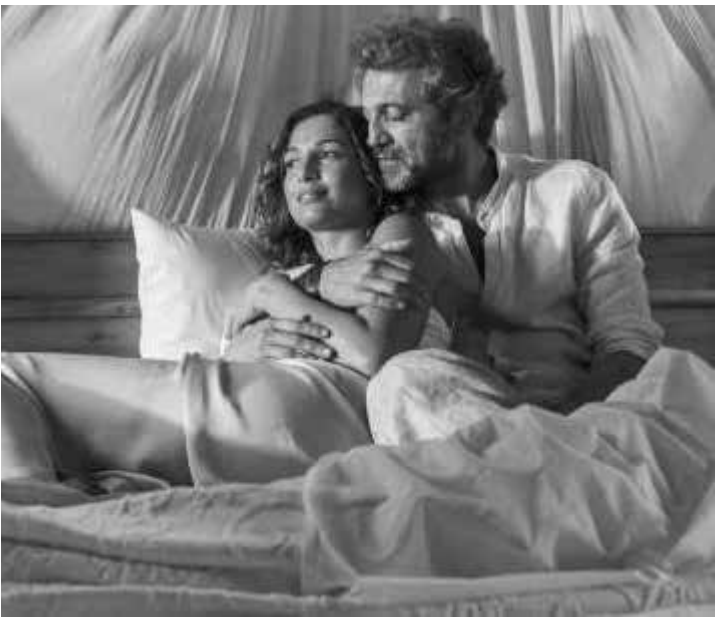
Mudanças no capítulo final da novela com os personagens de Santo e Tereza

pois da novela [“Rock Story”, próxima trama das 19h da TV Globo]”, revelou. A Rainha de Bateria do Salgueiro disse que sua única certeza é que a cerimônia será realizada no Rio de Janeiro. “Será no Rio. Acredito que a cerimônia e a festa aconteçam tudo no mesmo local. A verdade é que ainda não temos nenhum detalhe”, disse.