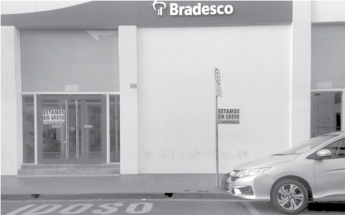
Agência do Bradesco, na Rua São Paulo, com cartazes confirmando a adesão à greve

valorização do piso salarial - no valor do salário mínimo calculado pelo Dieese (R$ 3.940,24 em junho) -, PLR de três salários mais R$ 8.317,90, além de outras reivindicações, como melhores condições de trabalho. A Fenaban disse em nota que "o modelo de aumento composto por abono e reajuste sobre o salário é o mais adequado para o atual momento de transição na economia brasileira, de inflação alta para uma inflação mais baixa". ATENDIMENTO Em nota, a Federação Brasileira de Bancos (Febraban) lembra que os clientes podem usar os caixas eletrônicos para agendamento e pagamento de contas (desde que não vencidas), saques, depósitos, emissão de fo-