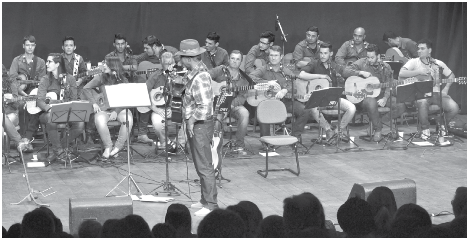
Violeiros apresentarão repertório variado com seleção de músicas que marcaram época

A apresentação terá início às 15h, logo após o chá