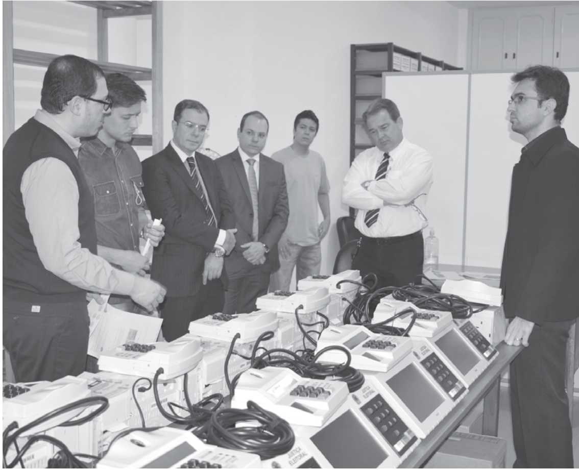
A oportunidade contou com a presença de representantes do MP e OAB