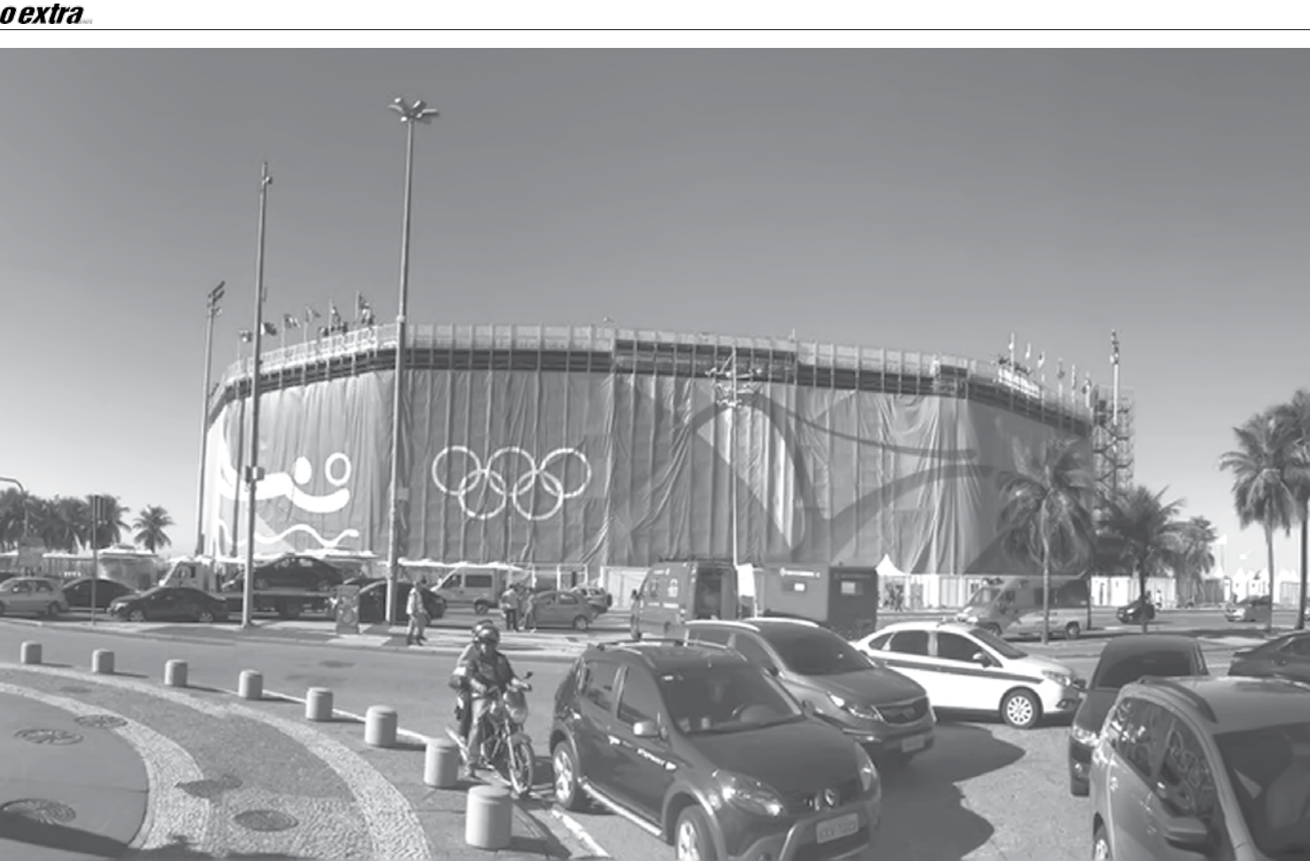
Euromedia produziu banners e faixas para áreas de competição