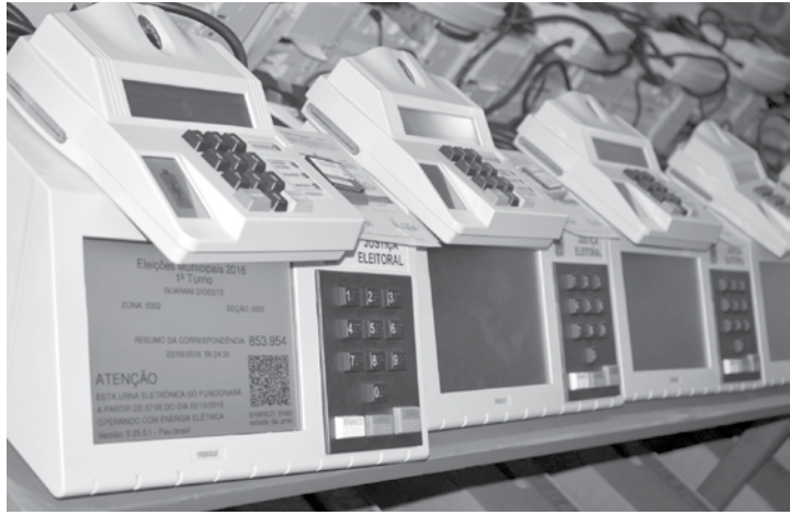
Urnas são lacradas na sede da 302ª Zona Eleitoral