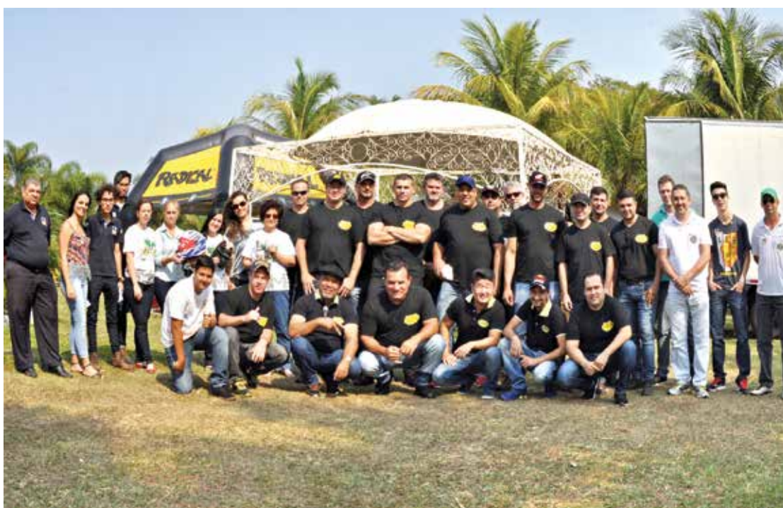
Dia de lazer e diversão com motoclubes de toda região e estados vizinhos