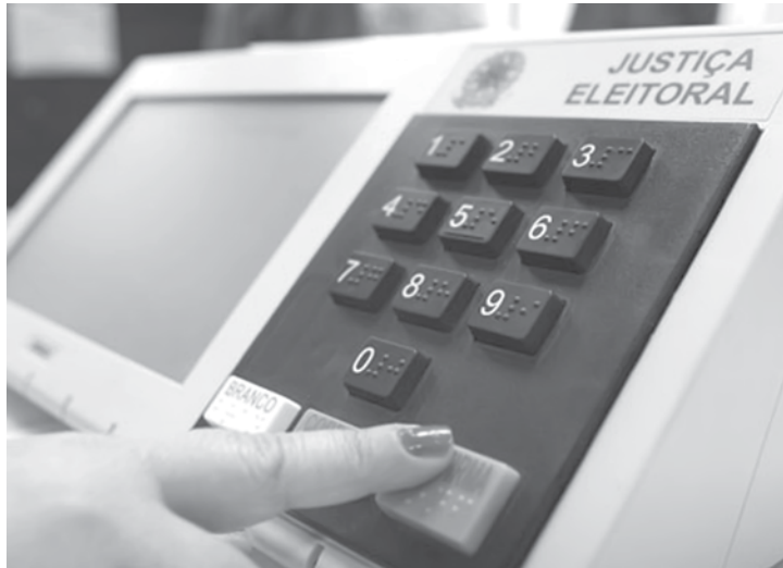
Expectativa do TSE foi feita com base em dados de eleições municipais anteriores

Superior Eleitoral (TSE) determinaram que algumas legendas partidárias reservassem, nas suas próximas propagandas partidárias, o quintuplo do tempo para promover e difundir a participação feminina na política. O Plenário entendeu que as legendas não cumpriram o tempo legal mínimo de 10%