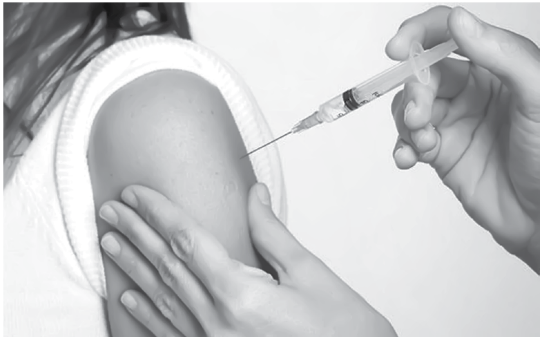
A multivacinação contempla 13 tipos de vacinas, que protegem contra 18 doenças

A multivacinação contempla 13 tipos de vacinas, que protegem contra