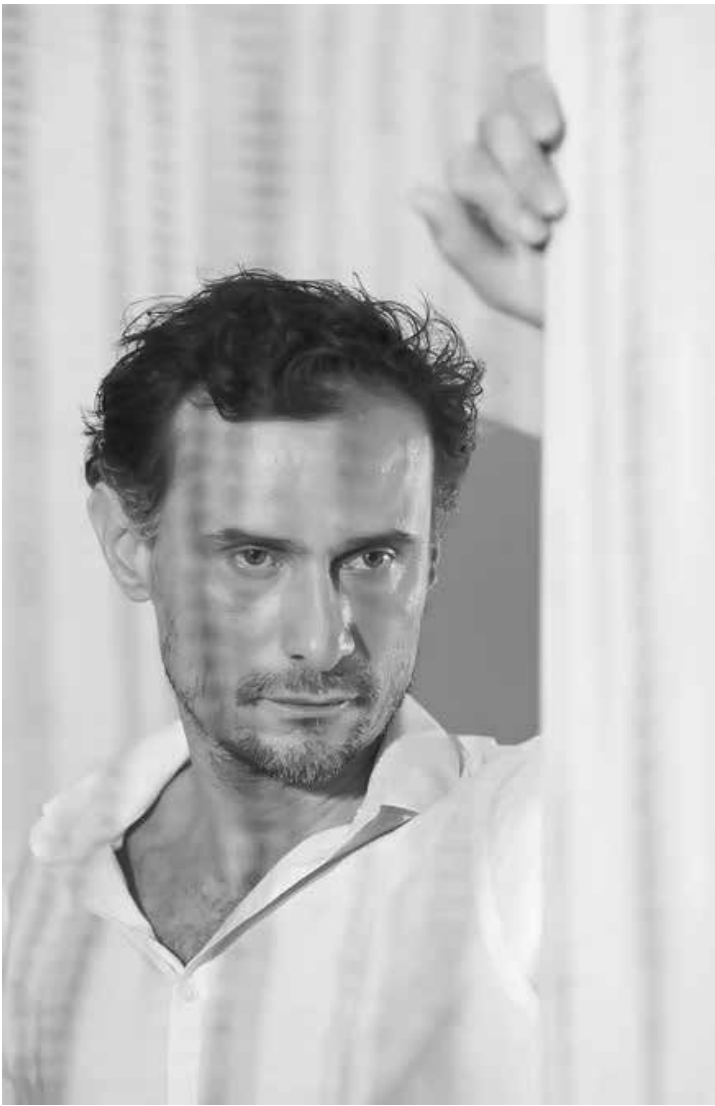
Enrique Diaz: ator desperta desejo no publico

Quem nunca sonhou com o galã de um filme ou de uma novela, que atire o primeiro controle-remoto em direção à TV. Normalmente, eles parecem existir apenas na imaginação, num local onde simples mortais jamais conseguiriam chegar ou tocá-los. São lindos, simétricos, têm sorriso branco como a neve e corpos de deuses gregos. Galãs, sequer, se amarrotam! De um tempo para cá, porém, a definição desse homem desejável mudou e deu lugar àqueles possíveis, que dá para esbarrar na mesma calçada. Quer ver só? Enrique Diaz, de 49 anos, é um ator e diretor com mais de 30 na estrada. Mas foi vestindo o terno bem cortado do corrupto Claudio em “Felizes para sempre?”, e a farda do policial Douglas, em “Justiça”, que este peruano de estatura mediana, criado no Paraguai e mais brasileiro que muitos legítimos, despertou o olhar de admiração do público. E não sejamos hipócritas. Esse olhar também contém desejo. O que