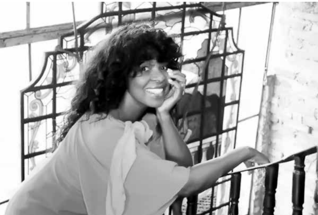
Cantora ficou famosa pelo hit “Adeus Solidão”, em 1969