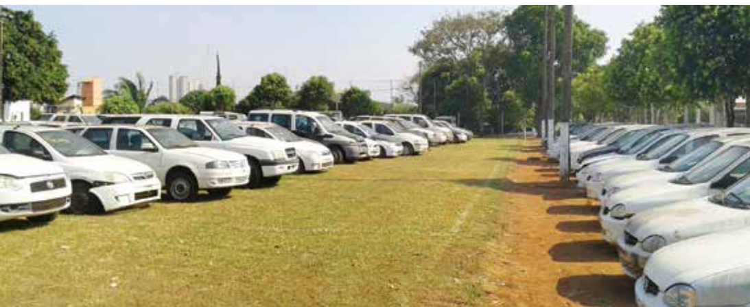
O Comando de Policiamento do Interior Cinco (São José do Rio Preto) destinou como local de leilão a sede do 16º BPM/I

Informações atinentes à licitação dessas viaturas, editais, valores, lotes e assuntos correlatos aos eventuais interessados em participar do leilão estarão disponíveis no site do Grupo Central de Transportes Internos ( www.gcti.sp.gov.br ), que é o órgão responsável pelo leilão.