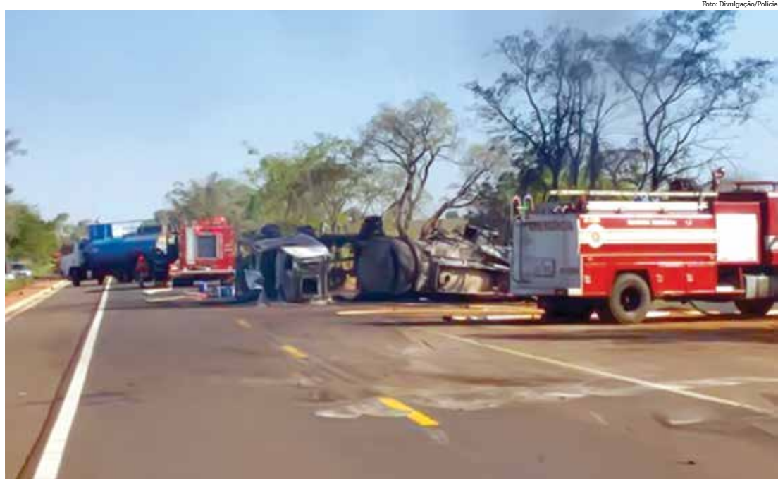
Caminhão pegou fogo no meio da rodovia