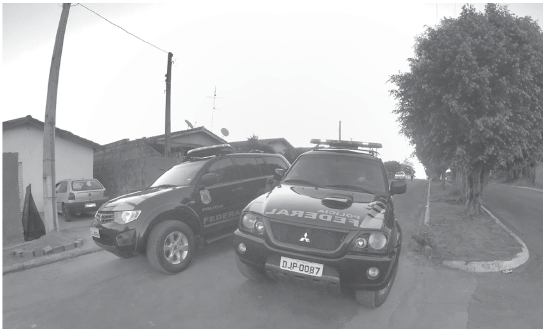
Veículos suspeitos estão sendo abordados e seus condutores qualificados; caso sejam surpreendidos desobedecendo a lei poderão ser presos em flagrante delito

A Polícia Federal de Jales, desde o último sábado (24), está intensificando as fiscalizações de combate a crimes eleitorais na região. Os federais estão diligenciando nos municípios de forma sigilosa ou ostensiva. O objetivo é surpreender pessoas que estejam atuando na compra de votos mediante fornecimento de combustível, cestas básicas ou mesmo com pagamentos em espécie. Veículos suspeitos estão sendo abordados e seus condutores qualificados. Caso sejam surpreendidos desobedecendo a lei poderão ser presos em flagrante delito. Em duas cidades da região, a PF abordou e qualificou indivíduos que portavam documentos suspeitos que foram apreendidos para análise detalhada. Denúncias feitas à PF estão sendo apuradas e inquéritos policiais já foram instaurados após autorização dos juízes eleitorais. A Polícia Federal adverte que a venda do voto também é crime. Quem for surpreendido comprando ou vendendo votos estará sujeito à pena prevista no Código Eleitoral de até 4 anos de prisão. Com a proximidade das eleições, a PF reforçou o número de viaturas e de policiais federais nas fiscalizações objetivando surpreender pessoas que estão praticando qualquer delito eleitoral. Até o próximo domingo, dia 02, dia das eleições, os federais estarão circulando de forma sigilosa ou ostensiva para reprimir quaisquer tipos de delitos