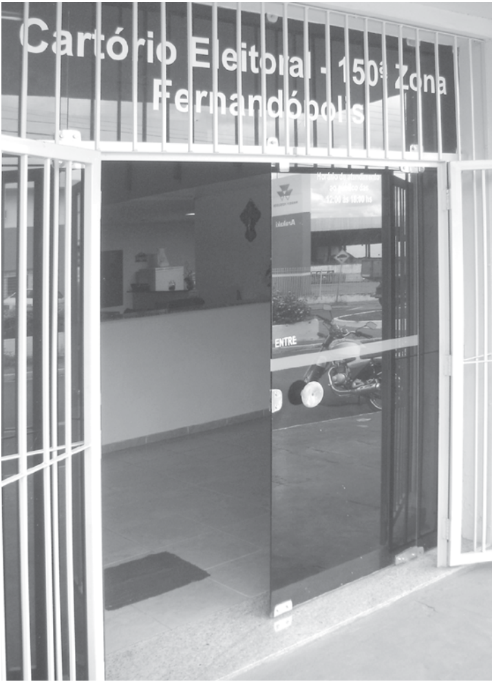
Em Fernandópolis, 51.321 eleitores estão aptos a votar; apuração será feita na 150ª Zona Eleitoral

Em Fernandópolis, a 150ª Zona Eleitoral, do município, e a 302ª, que compõe os mu-