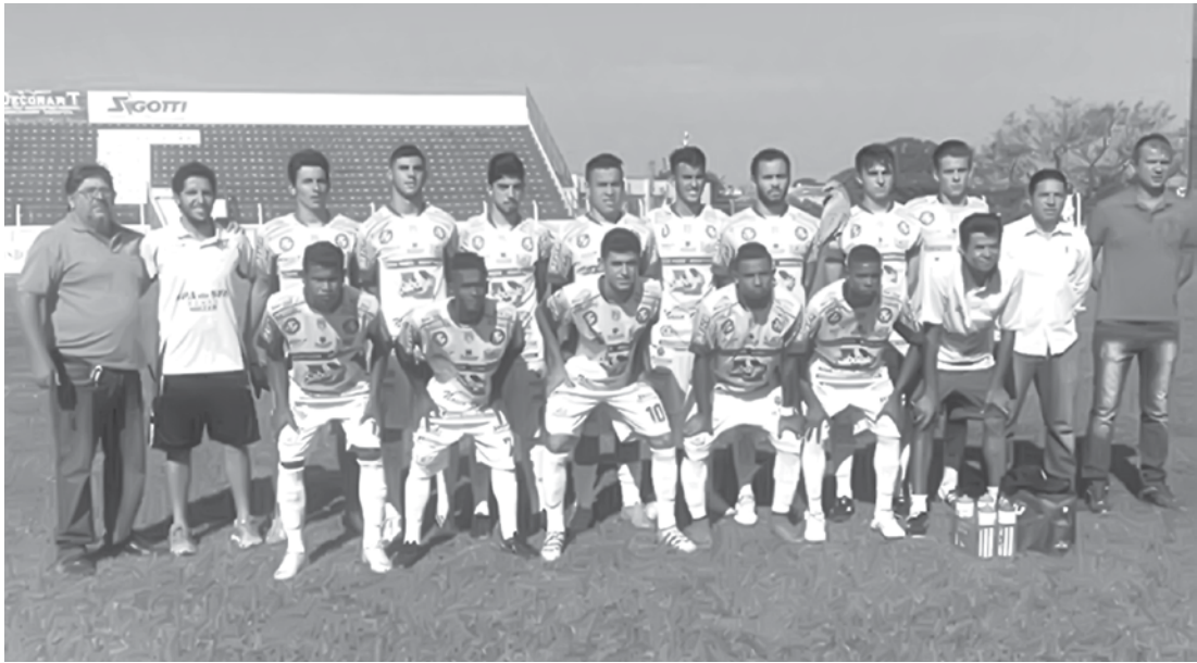
Equipe Sub-20 do Fefecê espera garantir a classificação à segunda fase do Estadual neste final de semana