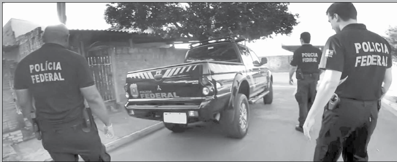
DE OLHO - Policiais federais da unidade jalesense executaram diversas operações de combate a crimes eleitorais na manhã de ontem. A fiscalização permanecerá até o fim do pleito e atinge diversas cidades da região.

DISSIMETRIA - Apesar da incredulidade popular, é normal a enorme desigualdade externa em três pesquisas divulgadas em Fernandópolis. Na real, cabe ao eleitor analisá-las e apurar qual aproxima-se mais de algo “palpável” na cidade.