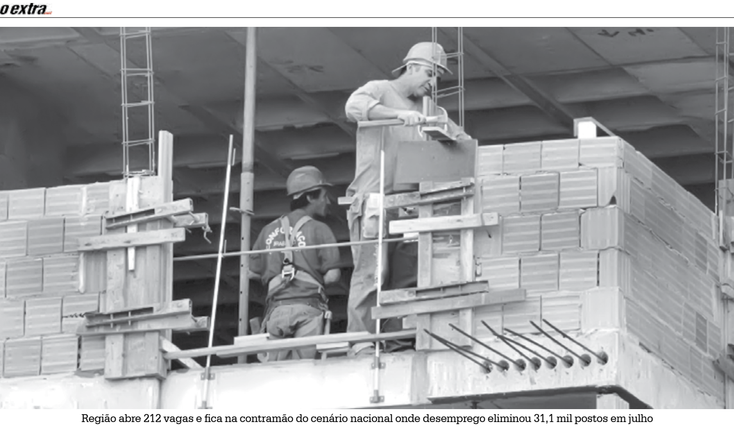
Região abre 212 vagas e fica na contramão do cenário nacional onde desemprego eliminou 31,1 mil postos em julho