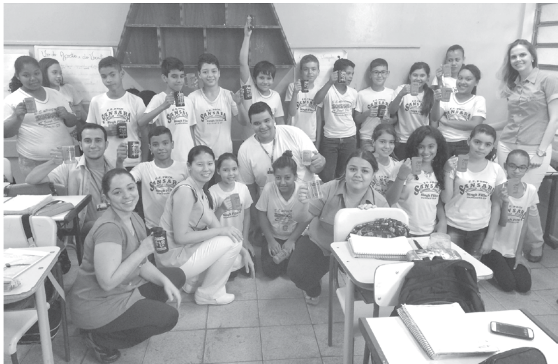
Campanha contra hanseníase e verminose percorreu as escolas de Ouroeste