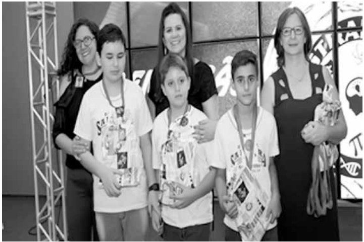
Cerimônia de premiação – 5º lugar na categoria Ensino Fundamental Ciclo II