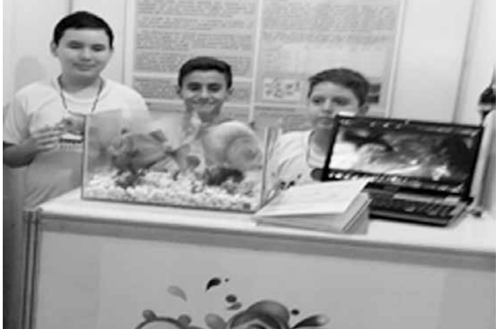
Pesquisadores prontos para apresentação