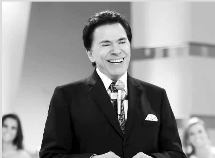
Suceso do Brasil para o mundo