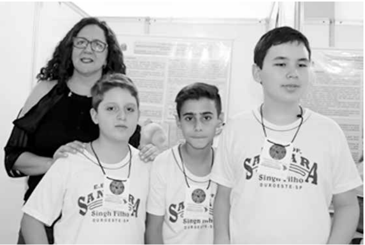
Pesquisadores com a orientadora do projeto