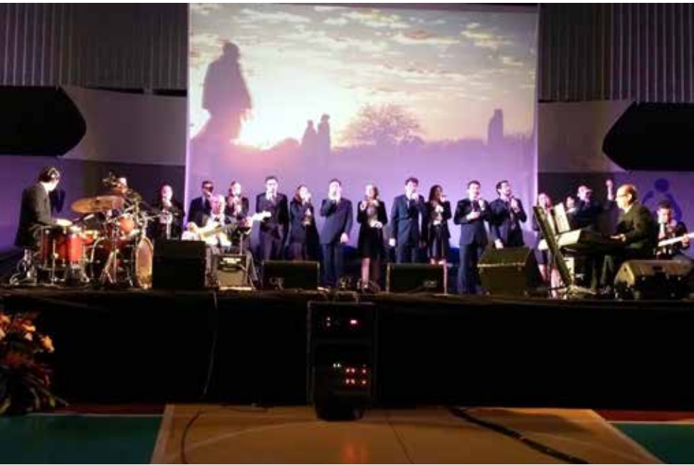
Momento solene do Grupo Prisma , em apresentação na escola Adventista, em Fernandópolis.