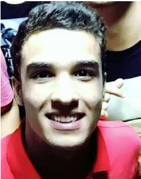
Vinícius Moraes também é homenageado neste final de semana pelo seu niver, que será amanhã. O dia promete muita animação!