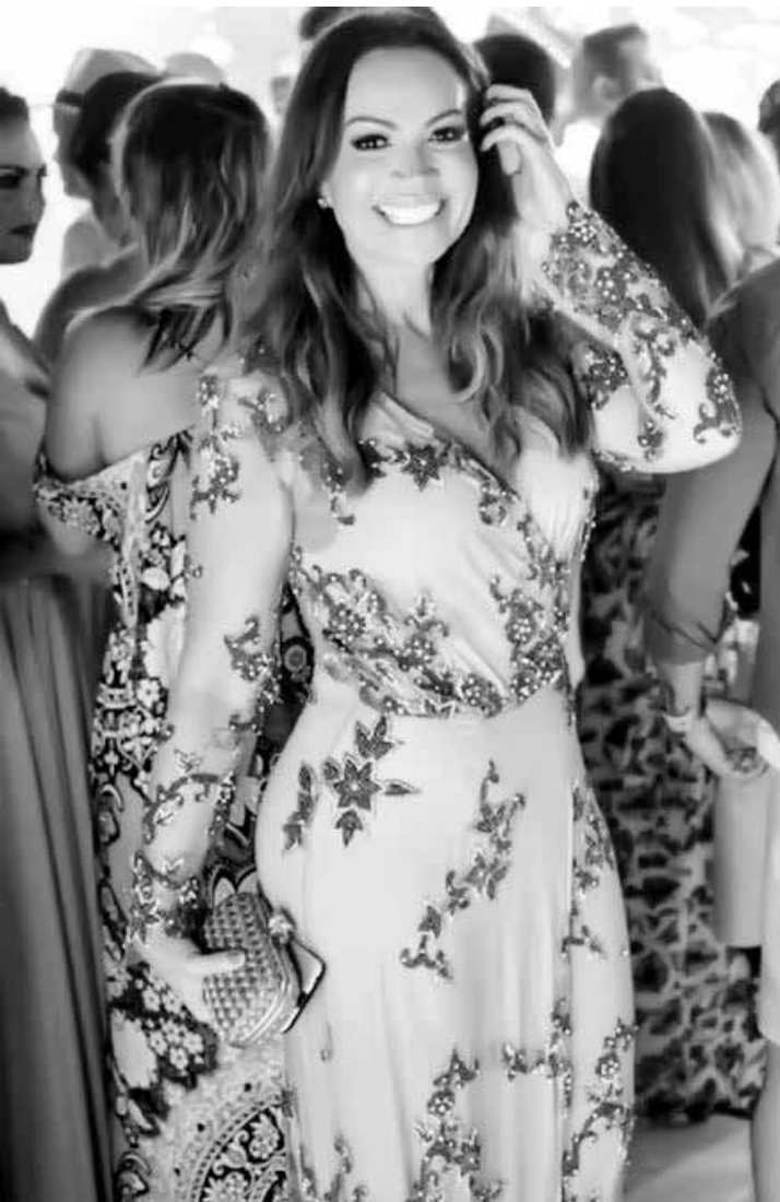
Solange Almeida com o vestido que vai dar de presente para a fã

Solange Almeida prometeu e cumpriu. Após dizer à fã que emprestaria o vestido que usou no casamento do cantor sertanejo Rodolfo, da dupla com Israel, ela contou no Instagram que a peça será enviada: “O vestido segue amanhã para você, minha amada. Espero que em maio você arrase no casamento de sua filha. Tenha certeza que foi de coração. Não imaginei que um simples gesto fosse gerar isso tudo. Ahhh! O vestido é um