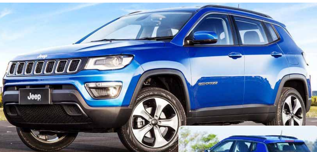
Jeep Compass oferece seis versões aos consumidores

SUV terá opção de motorização flex e diesel e chega para brigar com ix 35, Kia Sportage; Mitisubichi ASX; Audi Q3, BMX X1 e Mercedes GLA