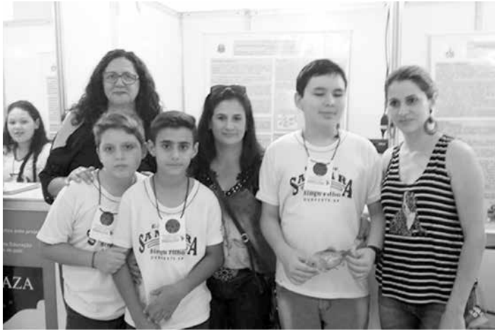
Familiares prestigiando o evento