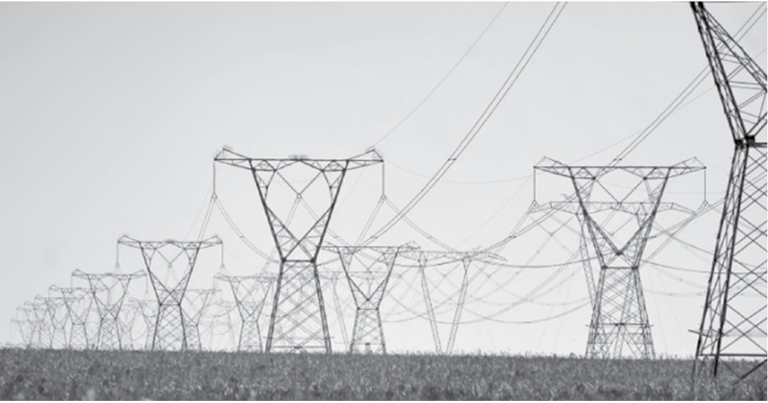
Capacidade instalada é a maior da série histórica desde 1998