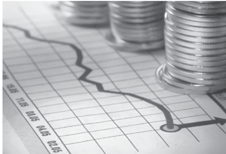
A remuneração da poupança é formada por uma taxa fixa de 0,5% ao mês mais a Taxa Referencial

A deterioração da caderneta neste ano se dá por conta da piora do cenário econômico, com a alta