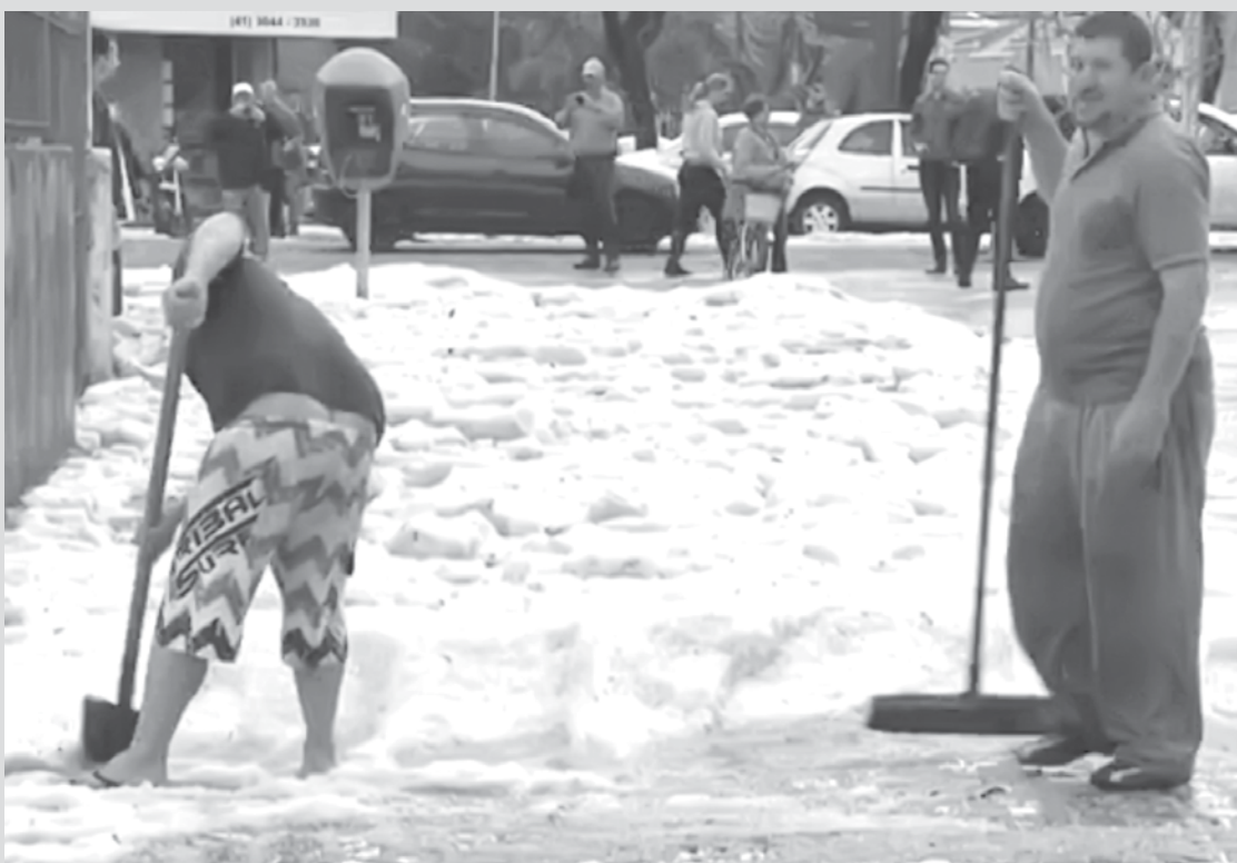
imagem do dia

Uma tempestade atingiu Curitiba no início da tarde de ontem(6). A chuva, acompanhada de vento e de granizo, provocou estragos, houve pontos de alagamento. A chuva também causou reflexo no trânsito, alguns pontos foram totalmente bloqueados por causa das pedras de gelo. Agentes da Secretaria Municipal de Trânsito foram aos locais para orientar os motoristas, e equipes da limpeza pública trabalharam para remover o granizo acumulado.