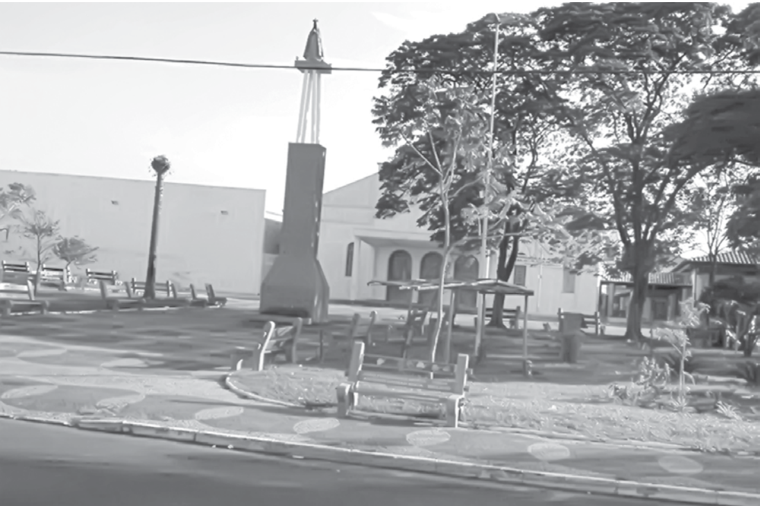
Igreja Aparecida em festa para celebrar o dia da padroeira

Padroeira do Brasil será lembrada durante todo mês na comunidade católica de Fernandópolis