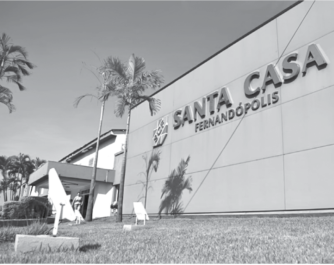
Golpistas usam o nome de diversas Santas Casas Brasil afora

são abertas com documentos falsos”. Outro detalhe, técnico e da área jurídica, é que se a pessoa não depositar o dinheiro, não há crime. “Assim, o B.O. não poderia ser registrado. Por isso, já adotamos um protocolo preventivo, de alertar os familiares que o hospital não faz esse tipo de ligação, nem de cobrança aos pacientes do SUS e, muito menos, solicita depósitos em contas de pessoas físicas”, informa a Assessoria de Imprensa do hospital. Os familiares que recebem ligações dessa natureza devem comunicar a Polícia Civil, pelo telefone 197, ou no Plantão Policial, não devendo realizar qualquer depósito. Em caso de dúvidas, a Ouvidoria da Santa Casa de Fernandópolis, está à disposição pelo (17) 3465-6122 ramal 471.