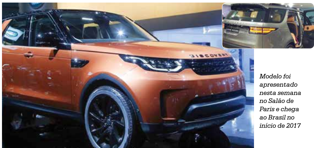
Modelo foi apresentado nesta semana no Salão de Paris e chega ao Brasil no início de 2017

A Land Rover abusou no lançamento do Discovery que, com a aposentadoria do Defender, passa a ser a opção mais off-road da fábrica. Mas apesar dessa vocação, ele vem com vasta gama de tecnologia embarcada. Rebratar ou levan-