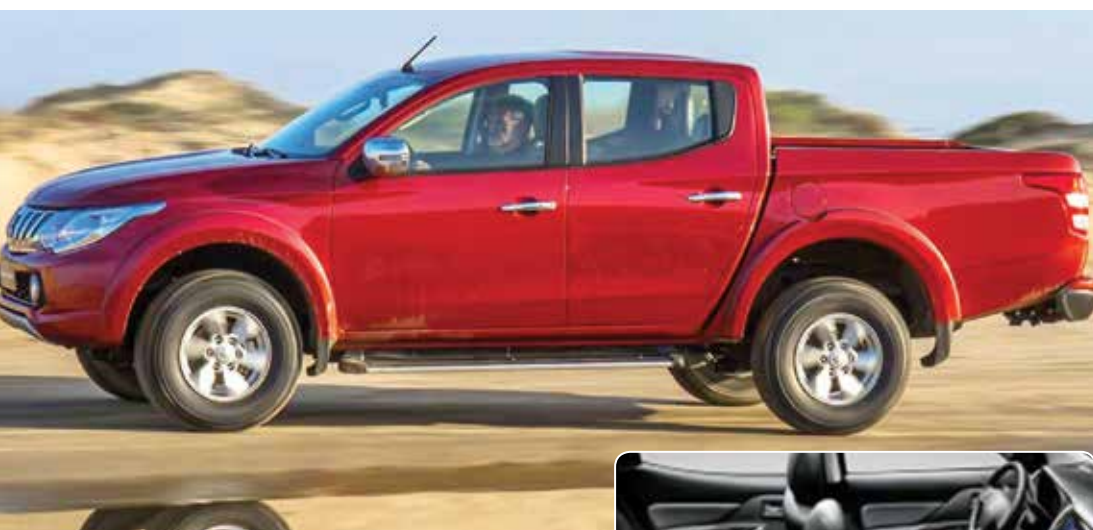
L200 Triton Sport: preços partem de R$ 132 mil

Picape vem pronta para o trabalho (com força e capacidade de carga), mas tem espaço interno e comodidades de um sedã