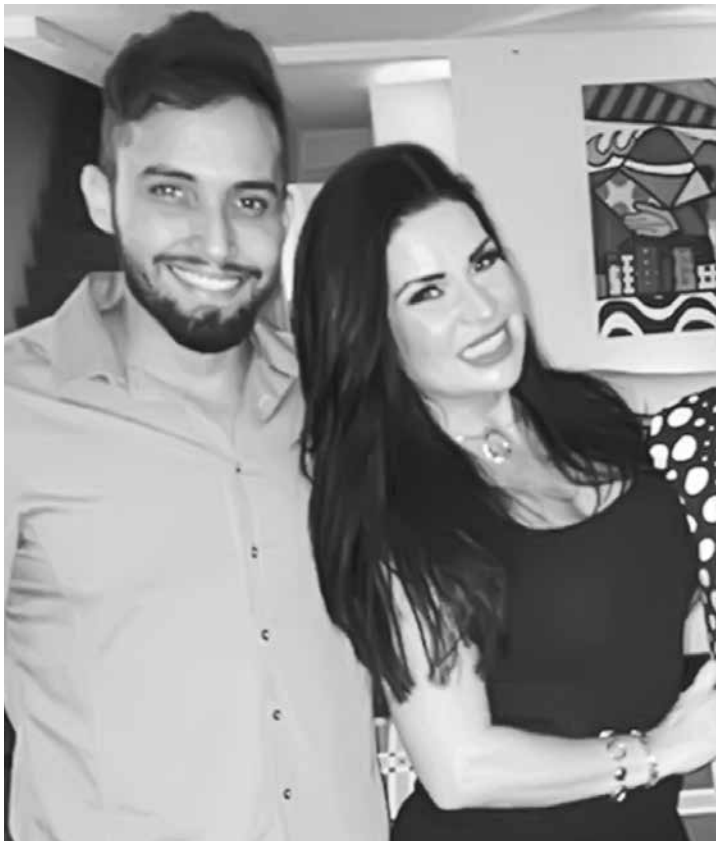
Solange Gomes com o novo namorado