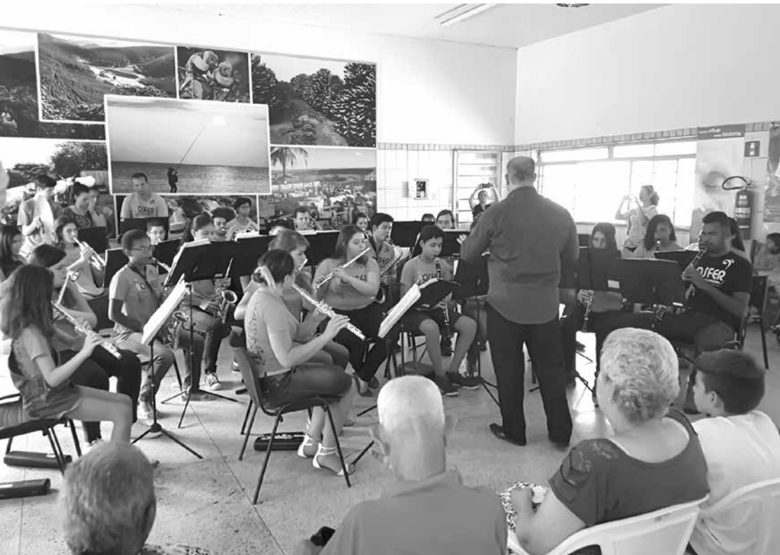
Músicos da Osfer se apresentando para os idosos

Osfer foi uma das atrações no Parque São Vicente de Paulo