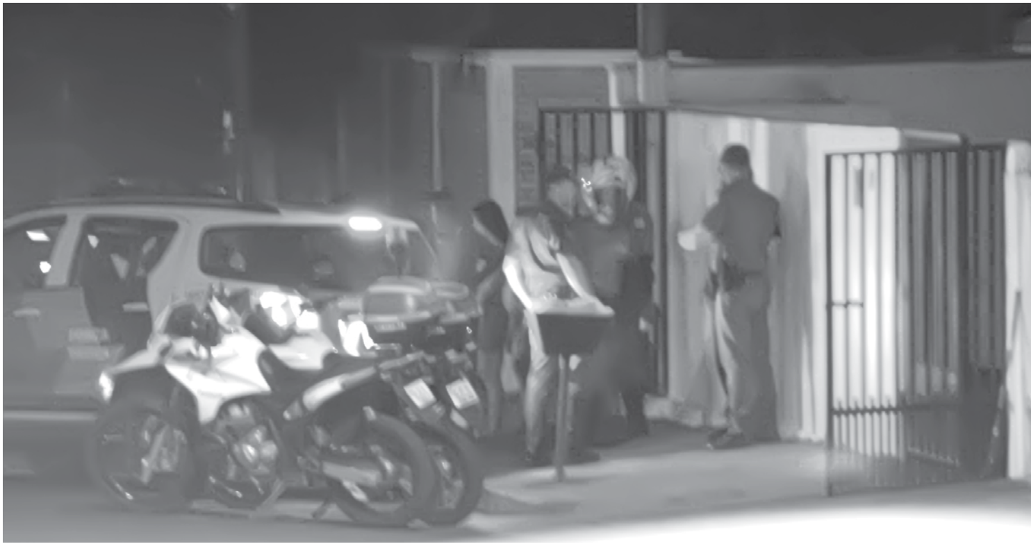
Movimentação, flagrada pela Reportagem de "O Extra.net", chamou atenção no Bairro Ubirajara

núncia anônima a respeito de V.F. estar em "atitude suspeita" em um bar, situado no referido bairro, foi deslocada uma viatura até o local. Durante o patrulhamento pelas ruas do Ubirajara, os policiais avistaram