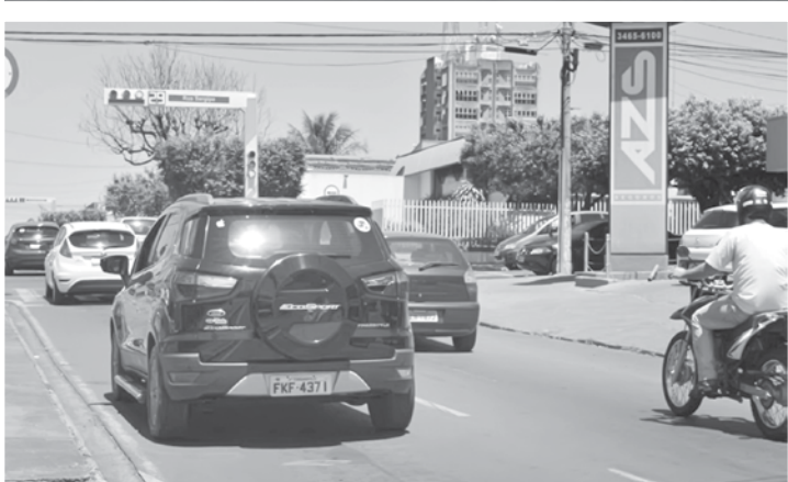
Trânsito em Fernandópolis apresenta índices positivos

Fatran (Fundo de Assistência ao Trânsito), que reúne os recursos recebidos com as multas de trânsito aplicadas no município, que somaram R$ 1.167.769,00.