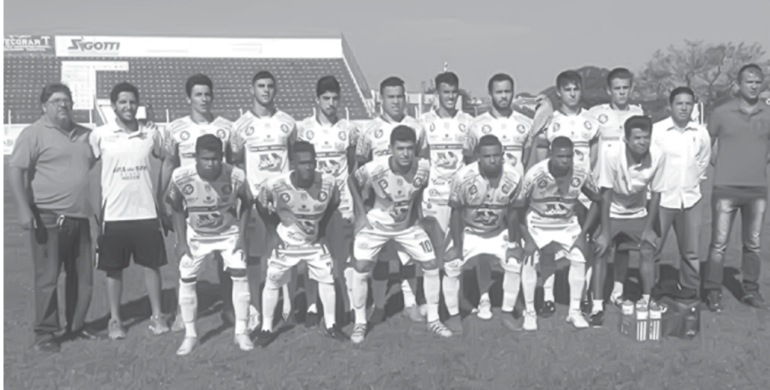
Juniões do Fefecê e do Ituano se enfrentarão no mata-mata do Paulista

→ BRENO GUARNIERI contato@oextra.net Foram definidos no último sábado (08), os últimos classificados, tanto quanto os confrontos das oitavas de final do Campeonato Paulista Sub-20 – 1ª Divisão – 2016. Os grandes do Estado fizeram a sua parte e avançaram. Dos 46 times que iniciaram a competição, apenas 16 seguem na briga pelo título. Mesmo com a derrota para o São Carlos, por 1 a 0, o Mirassol avançou como primeiro colocado no Grupo 1. Em segundo lugar avançou o Fernandópolis Futebol Clube (Fefecê), seguido por Ferroviária e Velo Clube. Os três melhores colocados empataram em 43 pontos, tendo definido as posições finais nos critérios de desempate. O Fefecê, inclusive, realizará a primeira partida das oitavas de final, fora de casa. Enfrentará o Ituano, no estádio Novelli Júnior, nesta sexta-feira, dia 14. O jogo de volta está