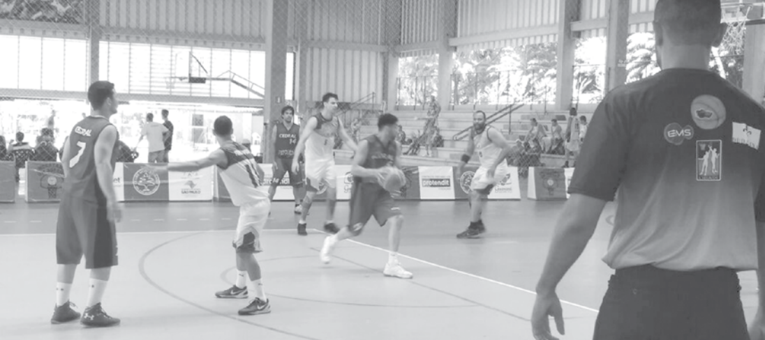
APAB e Cedral jogaram pela Copa Monte Líbano

→ JORGE PONTES jorge@oextra.net No domingo (09), teve início as semifinais da Copa Monte Líbano de Basquete. Fernandópolis e Cedral fizeram o primeiro dos três duelos pela vaga na final e o time Adulto da APAB/FEF/PPP/SMELC de Fernandópolis levou a melhor no primeiro jogo dos play offs. A equipe que havia sido derrotada pelos anfitriões Monte Líbano “A”, na última rodada da primeira fase, pondo fim a uma sequência in-