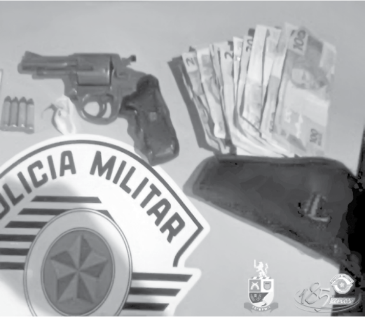
Porção de cocaína, revólver e dinheiro foram encontrados com V.F. durante a abordagem policial

fogo e de porte de cocaína. A abordagem aconteceu na Rua Margarida Pereira da Silva, no Bairro Ubirajara, zona norte de Fernandópolis. Informações do boletim de ocorrência dão conta de que após a PM receber de-