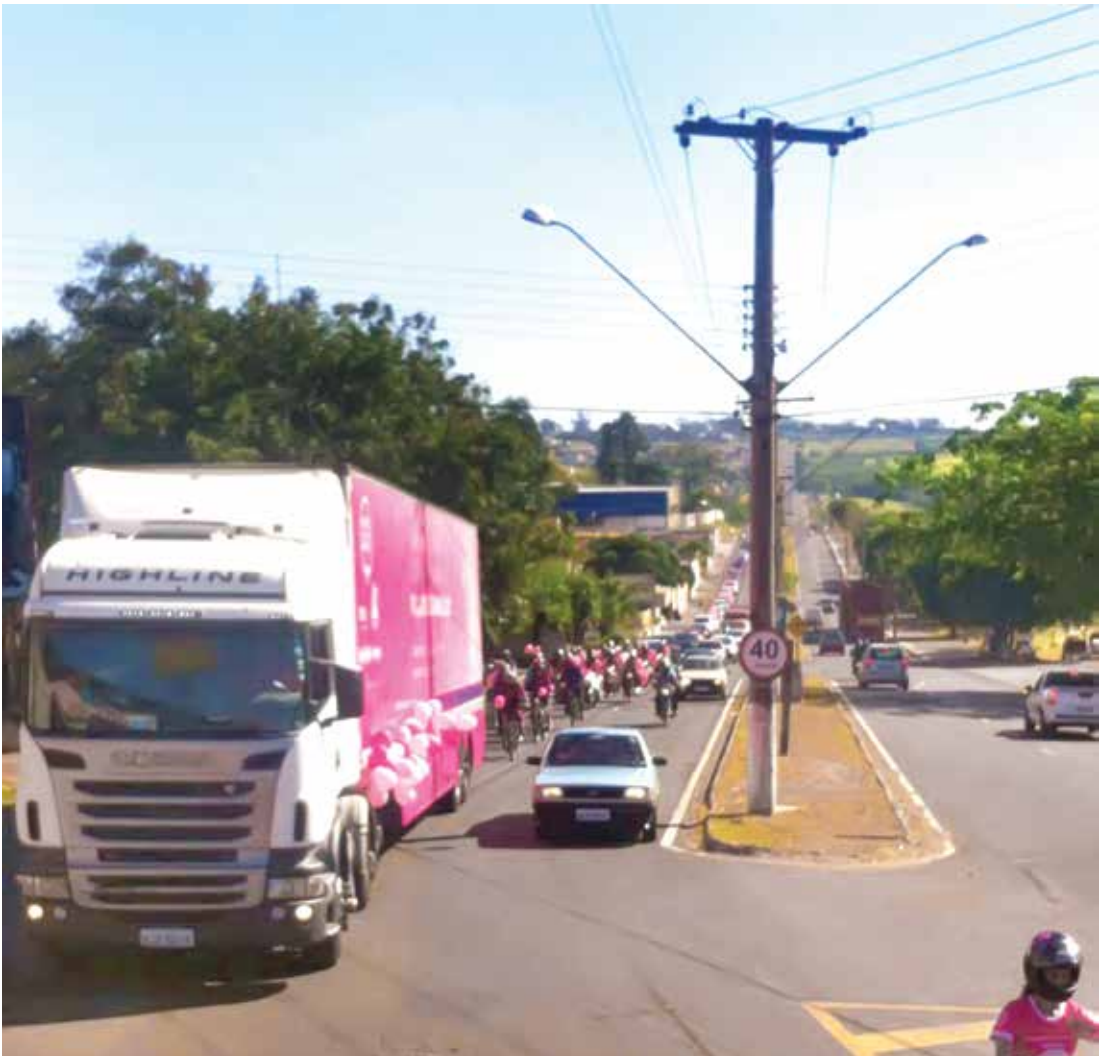
Carreata contou com a presença da Carreta de Prevenção do Hospital de Câncer de Barretos