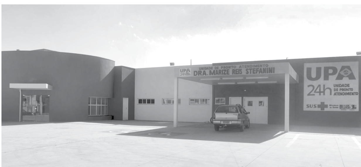
Todos os serviços de urgência básica, oferecidos à população na UBS do Pôr do Sol (à esquerda) no período noturno, serão realizados na UPA 24 horas (à direita), que já está em funcionamento