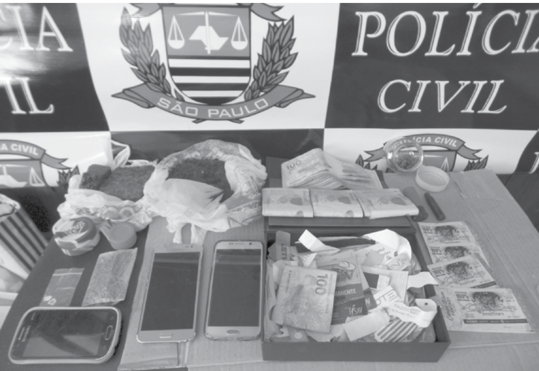
Drogas, dinheiro, celulares e demais objetos apreendidos pelos policiais civis da Dise de Votuporanga