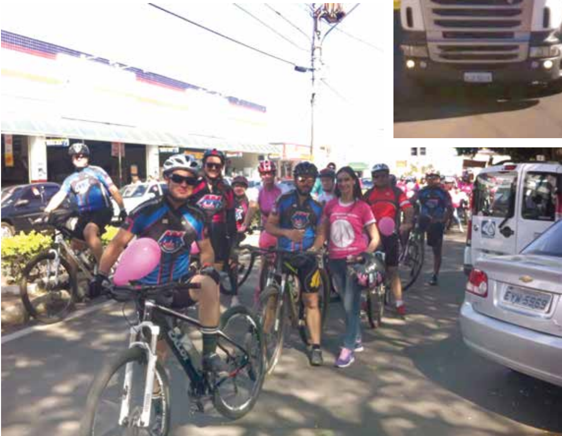
Oportunidade também contou com a participação de ciclistas

O movimento popular é comemorado em todo o mundo. O nome remete à cor do laço rosa que simboliza, mundialmente, a luta contra o câncer de mama e estimula a participação da população, empresas e entidades. Este movimento começou nos Estados Unidos, onde vários estados tinham ações isoladas referente ao câncer de mama e ou mamografia no mês de outubro. Posteriormente com a aprovação do Congresso Americano o mês de Outubro se tornou o mês nacional (americano) de prevenção do câncer de mama.