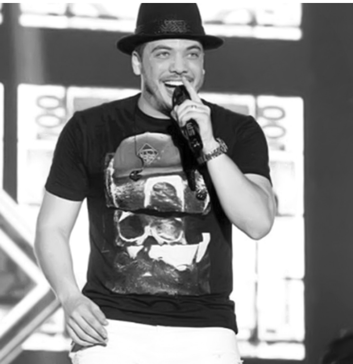
Wesley Safadão está de mudança para SP

Os corretores de imóveis em São Paulo estão em polvorosa. É que Wesley Safadão botou vários deles atrás da casa ideal para que ele se mude com a família ainda este ano. O cantor quer comprar uma mansão em Alphaville, aquele condomínio onde ricos e famosos moram desde que passaram a ganhar o primeiro milhão. Até agora, Safadão gostou das fotos que viu de uma com vários quartos, salas, piscina e até um estúdio. O proprietário pede R$ 4 milhões.