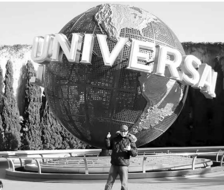
Hoje é dia de festa também para Leandro Souza , celebrando idade nova e recebendo felicitações.