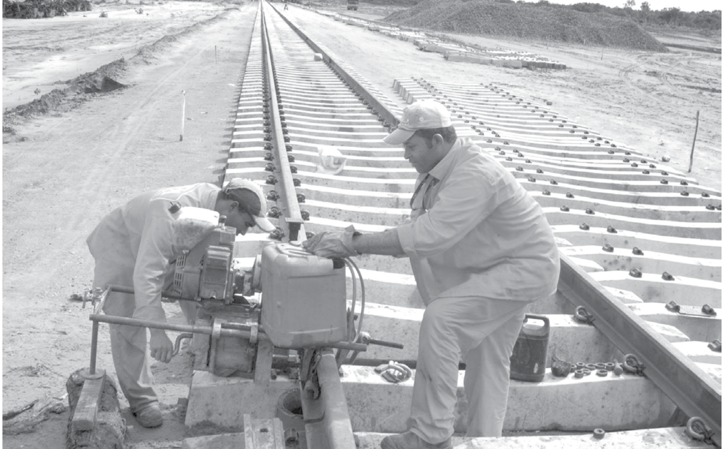
Novas concessões e investimentos poderiam destravar a modernização da malha ferroviária do Brasil

→ Da REDAÇÃO contato@oextra.net O desenvolvimento da malha ferroviária é estratégico no contexto da economia brasileira, uma vez que o crescimento da produção interna e das exportações exige melhoria no cenário da logística de transportes. A solução para esses “gargalos logísticos” e novos investimentos em projetos de infraestrutura viabilizariam o ganho em competitividade e impactariam positivamente na redução de custos. O diretor-executivo da Associação Nacional dos Transportes Ferroviários (ANTF), Fernando Paes, explica que o equilíbrio da matriz de transportes é essencial para um país continental e exportador de commodities minerais e agrícolas. Para Paes, o aumento da participação do modal ferroviário depende, de um lado, nos projetos “greenfield” anunciados pelo governo federal e, de outro, da prorrogação antecipada dos contratos de concessão. “Considerando-se que os no-