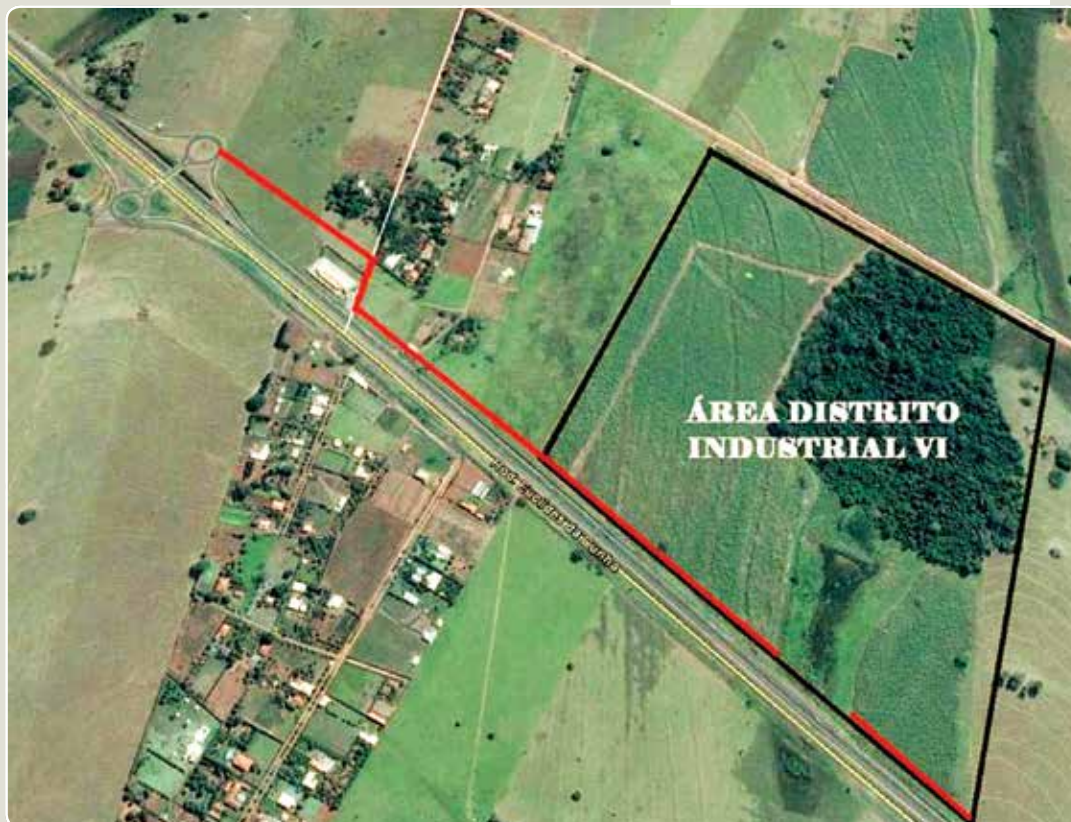
Área onde será implantado o Distrito Industrial VI