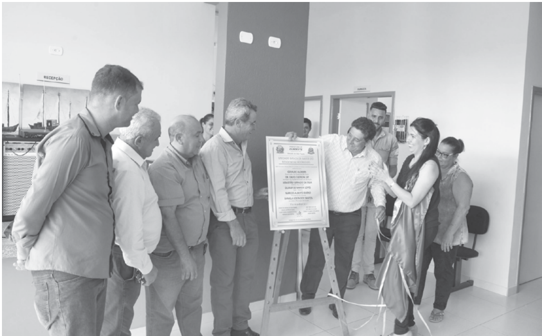
Inauguração da Unidade Básica de Saúde do Residencial Rodrigues