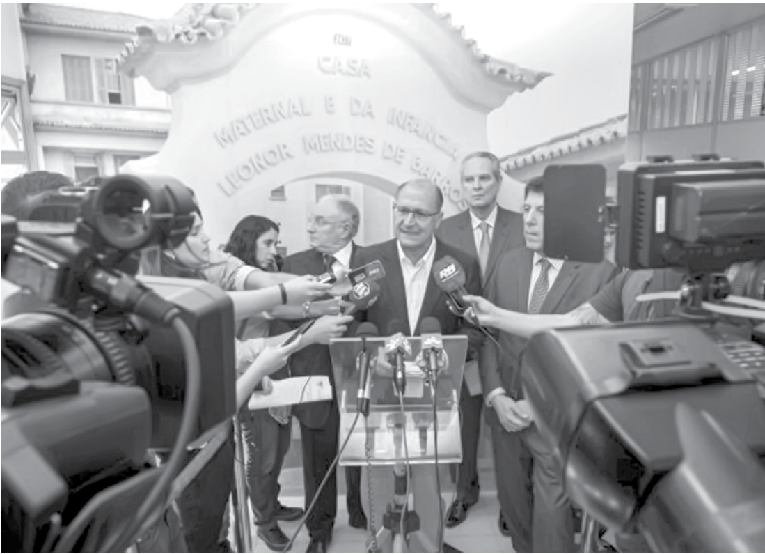
Alckmin anunciou nesta quinta-feira redução histórica das taxas de mortalidade infantil no Estado

20.384 óbitos de menores de um ano. O Estado de São Paulo tem conseguido reduzir as mortes infantis ano a ano. Em 2014, a taxa havia sido de 11,4 óbitos por mil crianças nascidas vivas. A taxa registrada em São Paulo coloca o Estado entre as áreas de menor risco de morte infantil do Brasil.