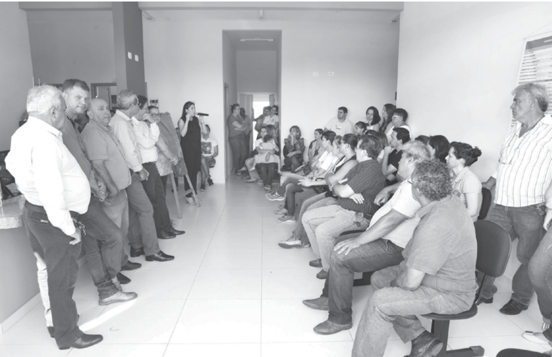
Autoridades e convidados durante a cerimônia que marcou a inauguração de 08 obras