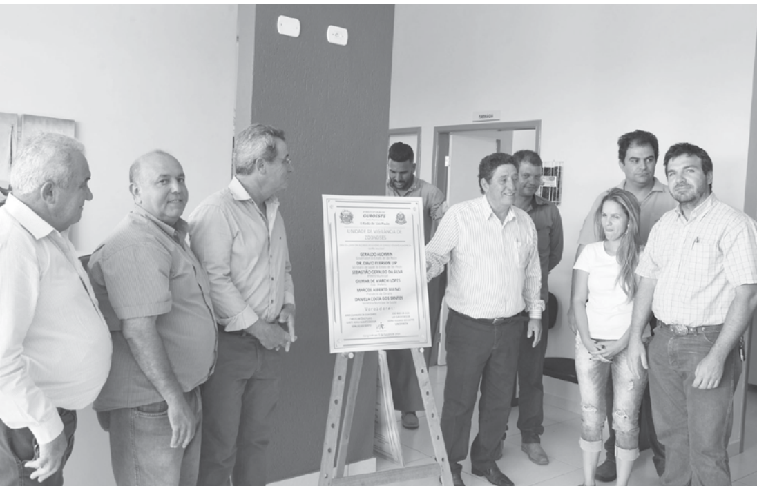
Momento que foi descerrada a placa de inauguração da Unidade de Vigilância de Zoonoses