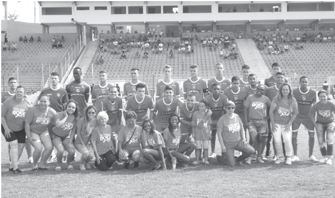
Equipes realizam a primeira partida das quartas de final do Paulista Sub-20 no municipal Cláudio Rodante

→ BRENO GUARNIERI contato@oextra.net A partir das 16h deste sábado (29), Fernandópolis Futebol Clube (Fefecê) e Capivariano começam a decidir quem será um dos semifinalistas do Campeonato Paulista Sub-20 – 1ª Divisão – 2016 em um Cláudio Ro-