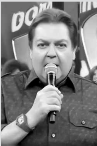
Comentário de Faustão causa polêmica

Para amenizar a situação, Faustão emendou: “Mas tem mulher que gosta de homem que sabe dançar, que puxa a ca-