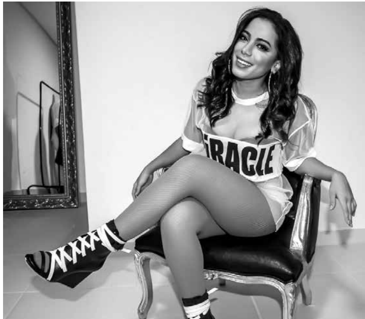
Anitta é eleita Melhor Artista Brasil no Europe Music Awards, em 6 de novembro de 2016

Anitta não assume um relacionamento desde o fim do namoro com Pablo Morais, com quem mantém contato até hoje. Nesta semana, a cantora deu uma lição de empoderamento no Snapchat. “Por que os maiores aspiracionais femininos são mulhe-