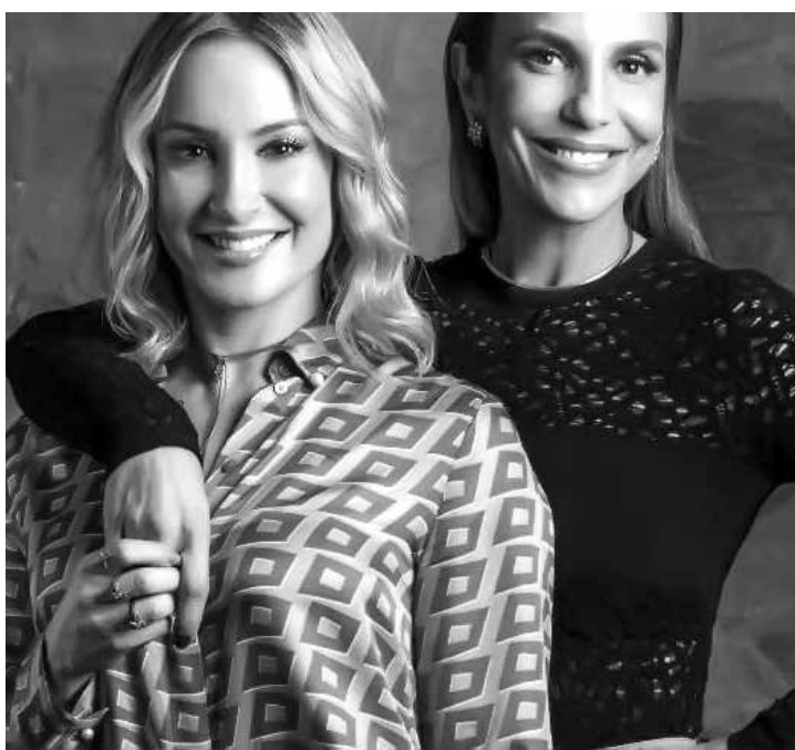
Jornalista afirma pura falsidade entre Ivete e Claudia