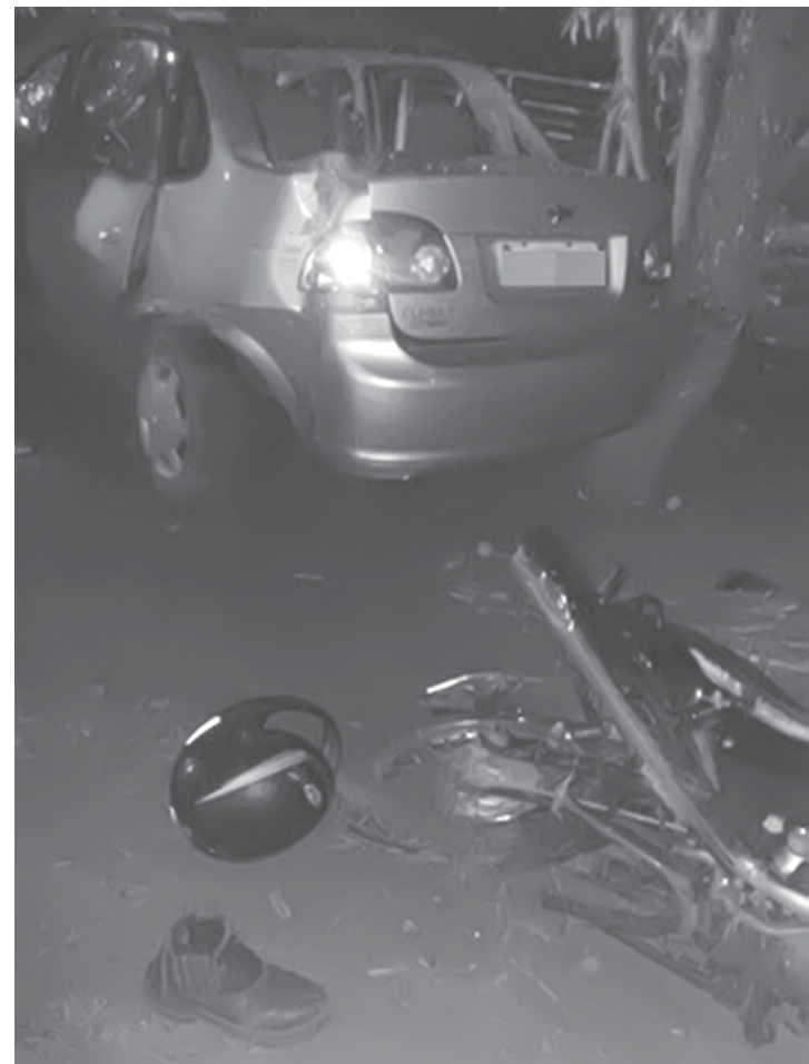
Motorista seguia pela vicinal, quando bateu na traseira de uma moto

tão sendo feitas na região, em Içém e Nova Independência, mas reconheceu que as duas estão com as obras em atraso. Uma tem previsão de entrega em janeiro e a outra em julho do ano que vem.