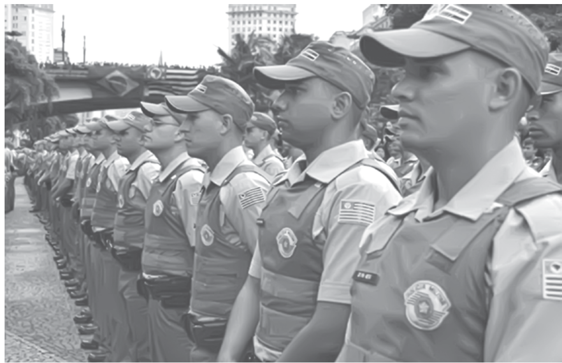
Para se candidatar a uma vaga de soldado, é preciso ser brasileiro e ter idade entre 17 e 30 anos

peculiaridades do exercício das funções policiais militares inerentes ao cargo". A remuneração inicial do soldado de 2ª classe é, atualmente, de R$ 2.992,54.