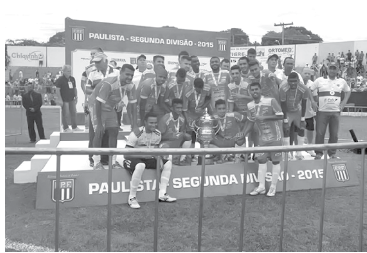
Fefecê é Bi-campeão Paulista (títulos de 79 e 94). Em 2015, a Águia ficou com o vice-campeonato da Segunda Paulista