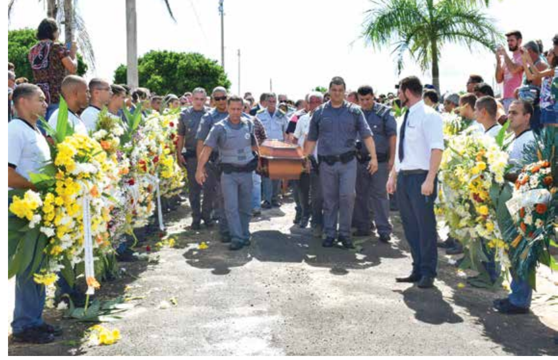
Familiares, policiais de toda região, autoridades e amigos participaram da cerimônia fúnebre