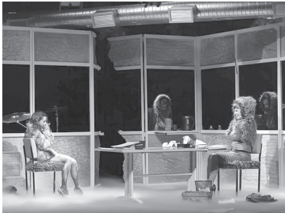
Depois de três anos, plateia de Fernandópolis confere a montagem definitiva de "Contrações"

Nos encontros seguintes, a gerente, amparada pelo poder que tem, libe-