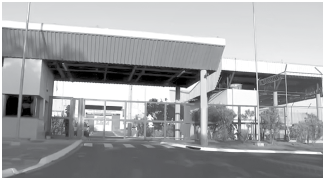
O Centro de Progressão Penitenciária de Rio Preto está com 864 presos a mais que a capacidade permitida

um presídio a cada 15 dias. "Esse déficit vem aumentando significativamente nos últimos anos e o Estado não tem condições de fazer frente a uma demanda tão grande de vagas que diuturnamente a gente vê", afirma.