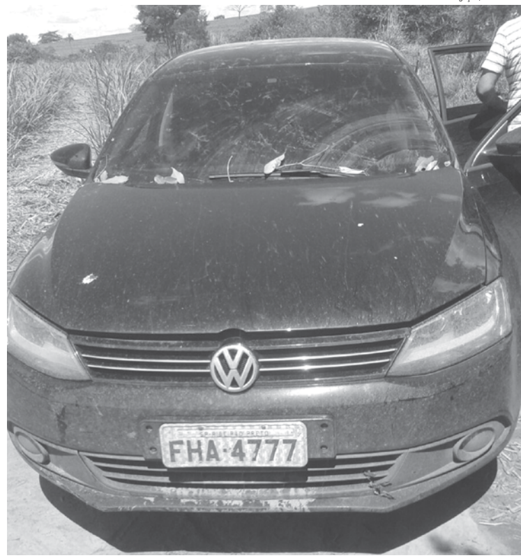
Automóvel que teria sido utilizado pelos criminosos foi apreendido pela Polícia Civil, em Postes Gestal

→ BRENO GUARNIERI / JORGE PONTES contato@oextra.net