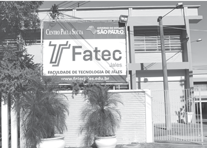
Na região, número chega a 630 vagas, distribuídas nos municípios de Rio Preto, Catanduva e Jales

Em toda a região, 630 vagas são oferecidas nas faculdades de Tecnologia, nos municípios de Catanduva, Jales e Rio Preto; inscrições devem ser feitas até dezembro apenas pela internet