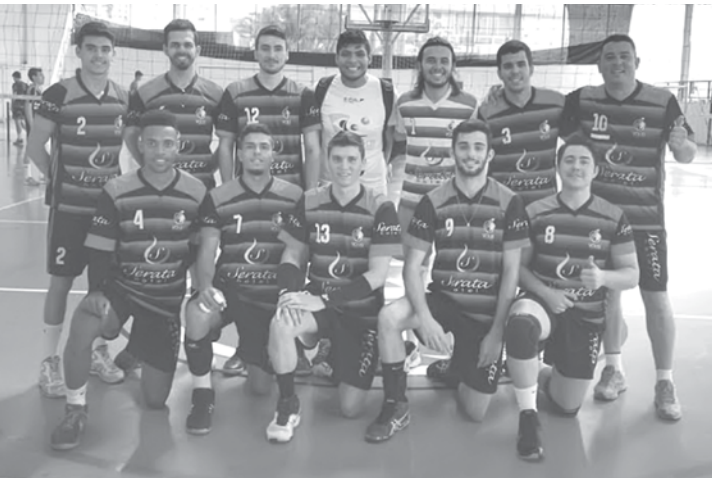
Equipe de vôlei fernandopolense preparada para mais um duelo