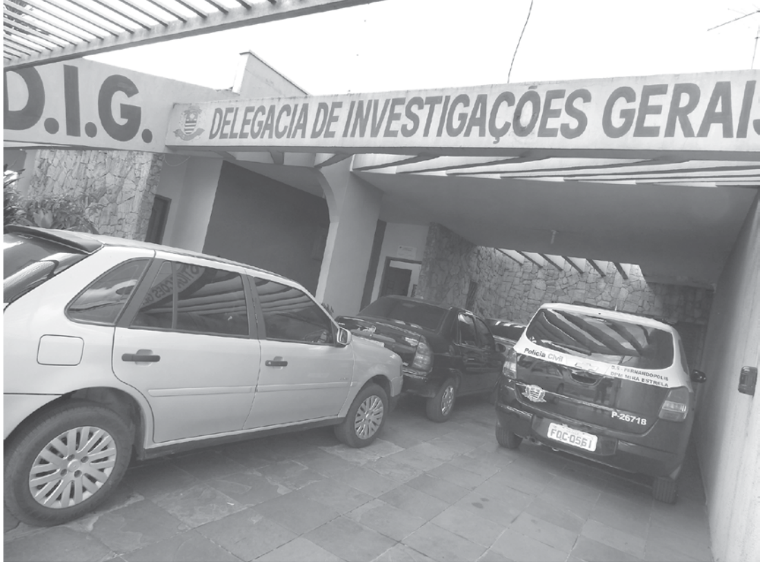
O caso está sendo investigado pela DIG

Ainda de acordo com o boletim de ocorrência, o ladrão fez S.S. “revirar” os cômodos do imóvel atrás das armas e munições do seu marido. “Como eu não as achava, ele começou a me agredir. Ele me deu coronhadas e um so-