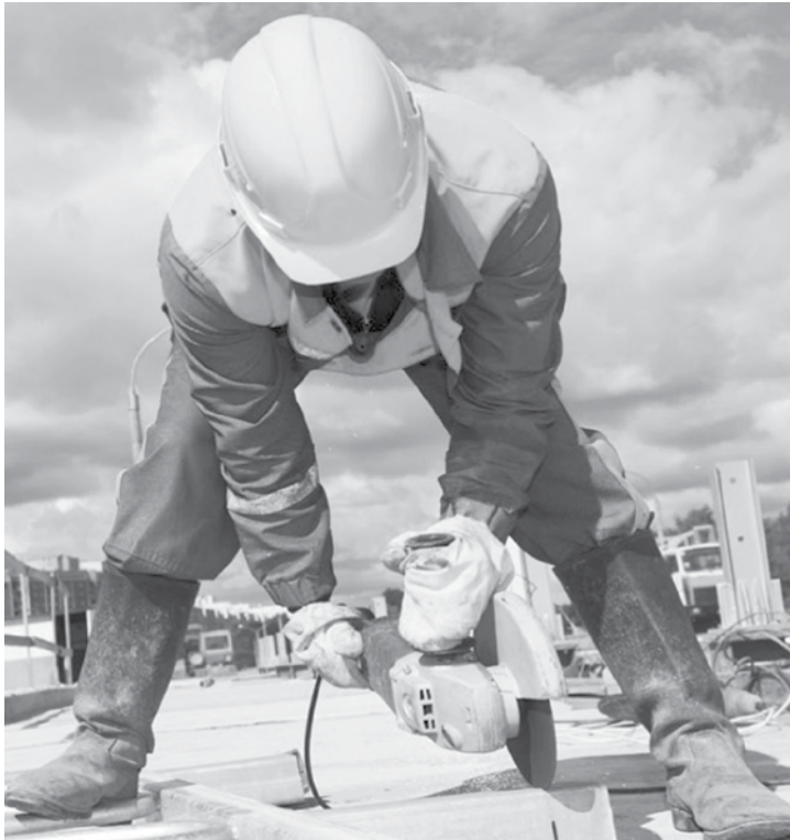
Os dados também são da pesquisa realizada pelo Sindicato da Indústria da Construção Civil do Estado de São Paulo (SindusCon-SP) em parceria com a Fundação Getúlio Vargas (FGV)

ESTADO DE SÃO PAULO Em setembro, houve queda de 1,27% no emprego