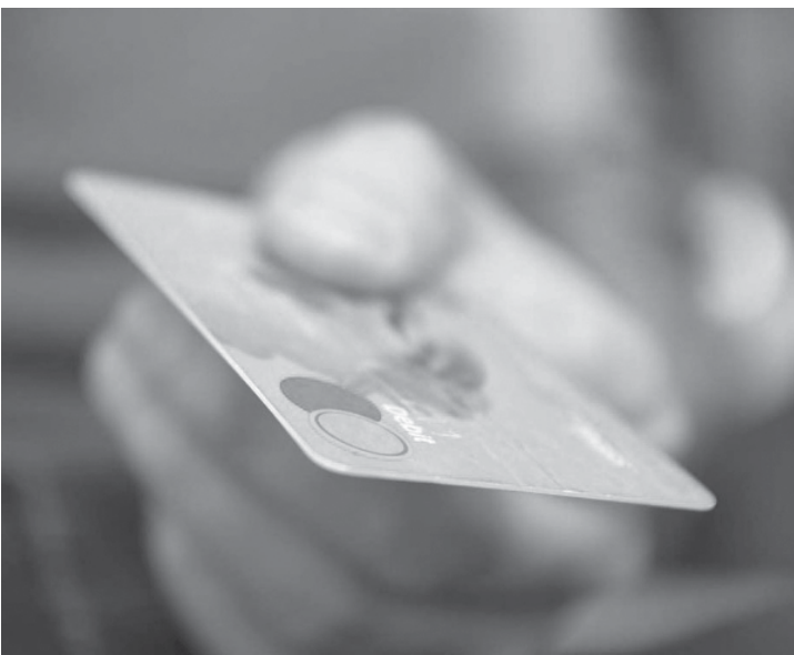
Juros cobrados no crédito rotativo são uma das causas do crescente endividamento dos brasileiros

foram o rotativo de 1.158% ao ano. ENDIVIDAMENTO O grande perigo é com relação ao endividamento. Caso o consumidor tenha um cartão com o rotativo de 1.158% ao ano, com uma fatura no valor de R$ 1 mil, e resolva pagar somente o mínimo (15% do total da fatura), ao fim de 12 meses estará devendo mais de R$ 10 mil. Os juros cobrados no crédito rotativo são uma das causas do crescente endividamento dos brasileiros. Segundo dados da Pesquisa Nacional de Endividamento e Inadimplência do Consumidor (PEIC), o cartão de crédito é um dos principais tipos de dívida por 76,3% das famílias endividadas. Por isso, a Proteste defende regulamentar um limite máximo para os juros do cartão de crédito, conforme proposta encaminhada ao Banco Central no ano passado. Propõe limitar o valor ao dobro da taxa do CDI, taxa de juros que o banco paga quando toma dinheiro emprestado no mercado interbancário. Com isto, garante-se uma remuneração dos bancos de até 100% do custo de tomada do dinheiro. Por este critério, os juros seriam limitados a 28,38% este ano.