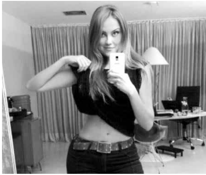
Ellen Rocche está participando de um desafio de emagrecimento