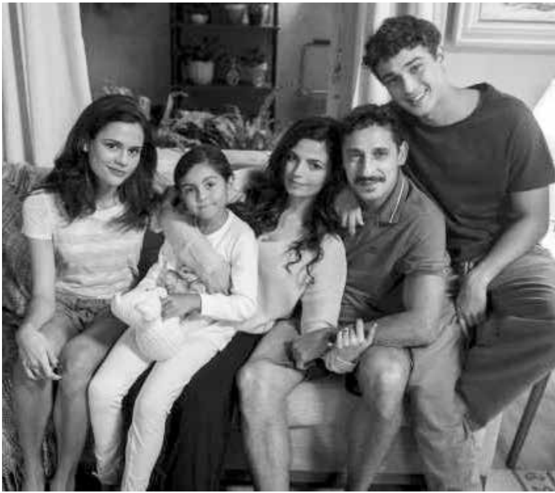
Mudanças no folhetim para alavancar a audiência

tes e a matriarca, uma vilã responsável pelas tramas orquestradas na família Leitão. As alterações acabaram mexendo com a entrega dos capítulos. Maria Adelaide Amaral e Vincent Villari haviam entregado todos os capítulos de novembro quando o mês começou. Agora, os atores receberam apenas aqueles que serão exibidos até o próximo dia 10, um sábado. Também de acordo com a publicação, a maior audiência da trama na semana passada foi de 27.3 pontos na última quinta-feira (24), quando Isabela era procurada e foi revelado que Tião era o culpado pela suposta morte da garçonete.