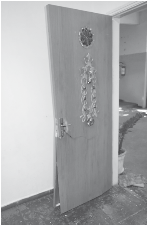
Alguns das portas arrombadas haviam sido adquiridas por meio de doações em dinheiro da comunidade e funcionários