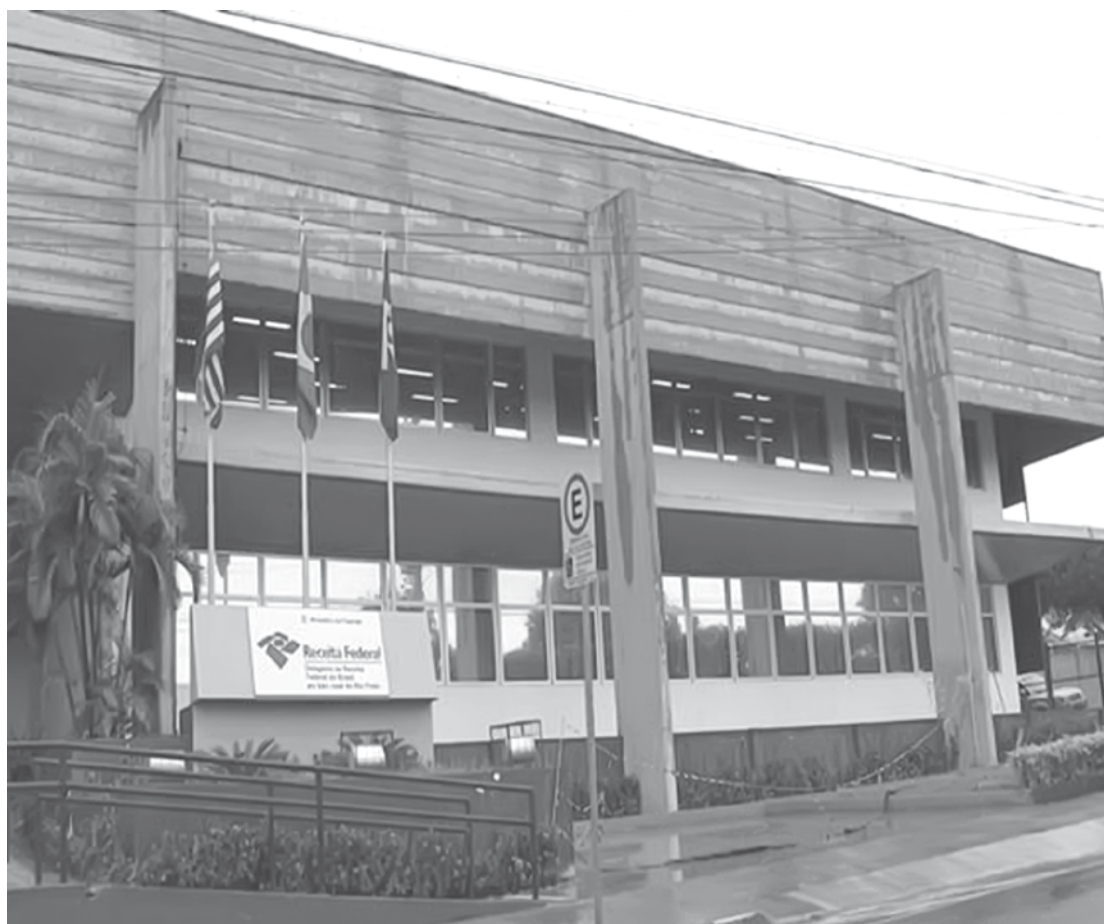
Fernandópolis pertence à jurisdição da Delegacia da Receita Federal, em São José do Rio Preto

O termo malha fina é uma abstração ao processo de verificação de inconsistências da declaração do imposto IRPF e IRPJ, age como uma espécie de "peneira" para os processos de declarações que estão com alguma pendência, impossibilitando a sua restituição, e em alguns casos resultando em investigação.