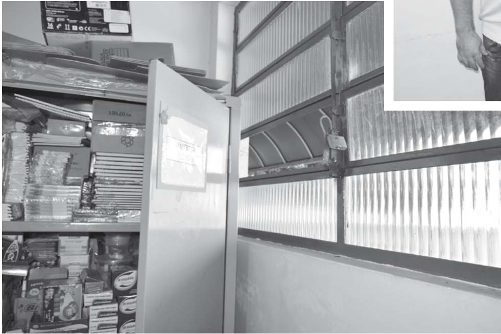
Uma das invasões aconteceu pela janela que dá acesso à sala da Coordenadoria da escola