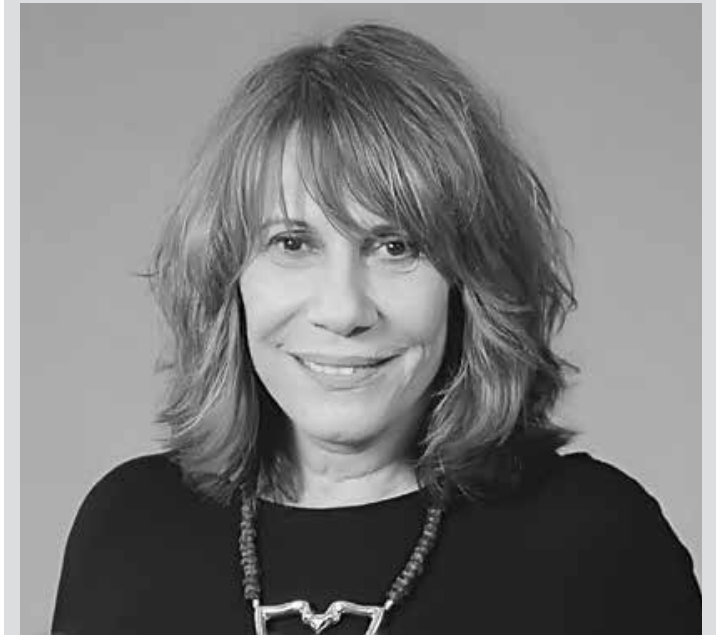
A personagem vai reaparecer em uma futura novela do autor Aguinaldo Silva

A única e inigualável Nazaré Tedesco, rainha das vilãs da televisão brasileira, está de volta. A personagem vai reaparecer em uma novela futura do autor global Aguinaldo Silva, que deu a notícia em uma nota em seu site oficial; Renata Sorrah ainda não está confirmada. “Era para ser um segredo absoluto. Tanto que, na sinopse entregue à emissora na semana passada, não há nenhuma alusão ao assunto, e ainda não falei com Renata Sorrah a respeito. Por isso, quando me ligaram na sexta-feira para dizer que a volta de Nazaré Tedesco na minha próxima novela seria notícia, eu me rasguei de cima a baixo de tanto ódio: “Como é que a Misses K conse-