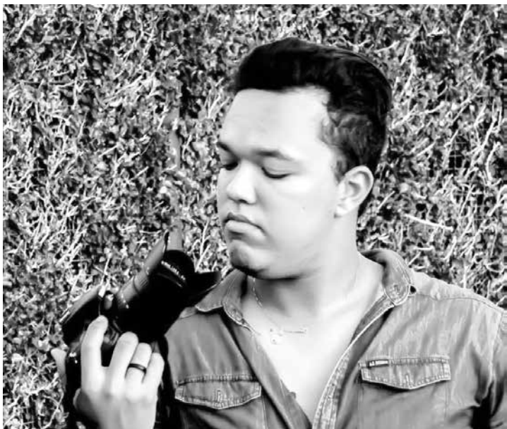
O fotógrafo Yago Borges vem ganhando destaque na região pelo profissionalismo e criatividade. Parabéns pelo trabalho!