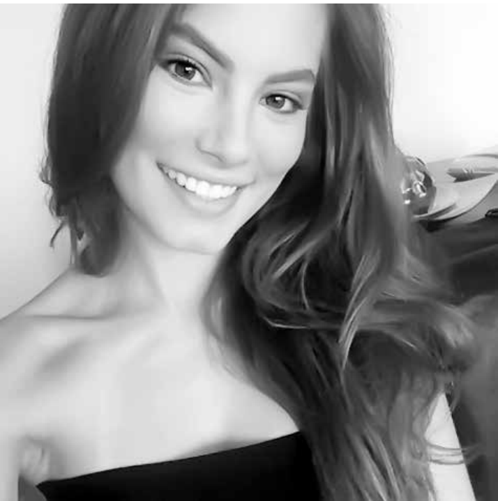
A atriz contou que, assim que sua barriga ficar aparente na novela, ela vai estudar fora