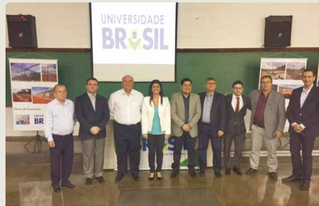
Membros da Universidade Brasil local: expansão para EUA, Europa e Ásia

Traduzindo tudo isso para o bom e bem claro português, significa que essa mudança de comando e a chegada da Universidade Brasil, aporta em boa hora. Sem a menor sombra de dúvida será uma boa e providencial injeção de ânimo na economia local e um santo remédio para levantar a autoestima da cidade. E aí para começar 2017 com o pé direito, dia 11 de janeiro temos a definição da ZPE. Tudo dando certo, como dizia o capira: aí junta a fome com a vontade de comer. E, segura “nóis”!