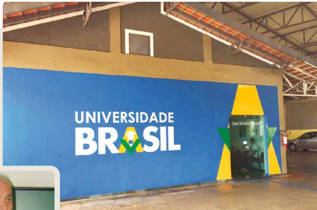
Nova fachada ratifica: Unibrasil não existe. Correto é Universidade Brasil