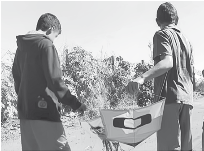
Policimento pede para que os pais procurem acompanhar a rotina dos filhos nesse período de férias

A Polícia Rodoviária Estadual pede para que os pais procurem acompanhar a rotina dos filhos nesse período de férias. Descobrir onde eles vão e como se divertem pode garantir a se-