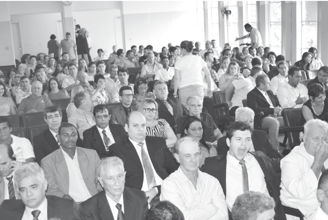
Público presente no Fórum de Estrela d'Oeste