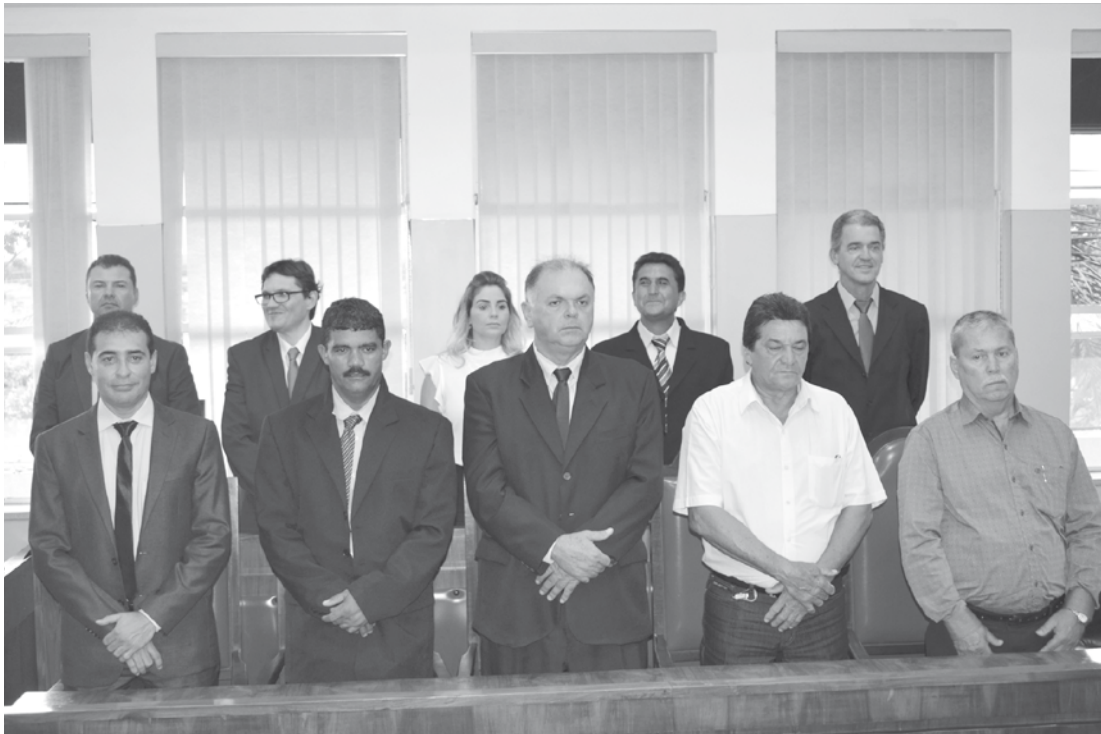
Prefeitos da região durante a solenidade de ontem