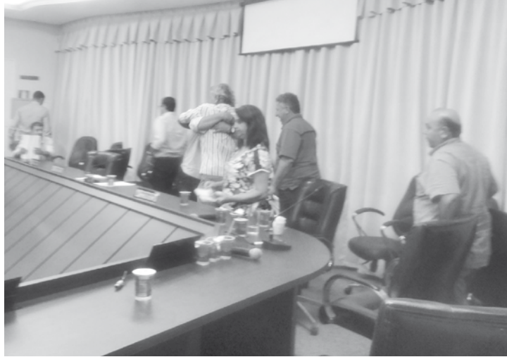
Vereadores comemoram criação oficial do Distrito