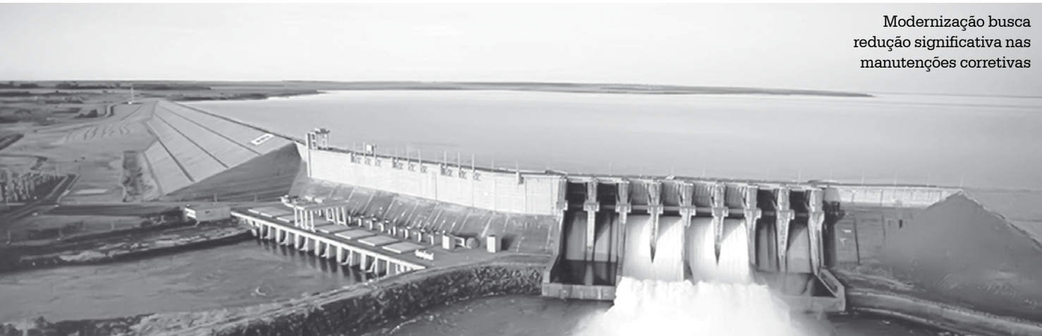
Modernização busca redução significativa nas manutenções corretivas

Disponibilidade de aproximadamente 90% para um desempenho eficiente até 2029