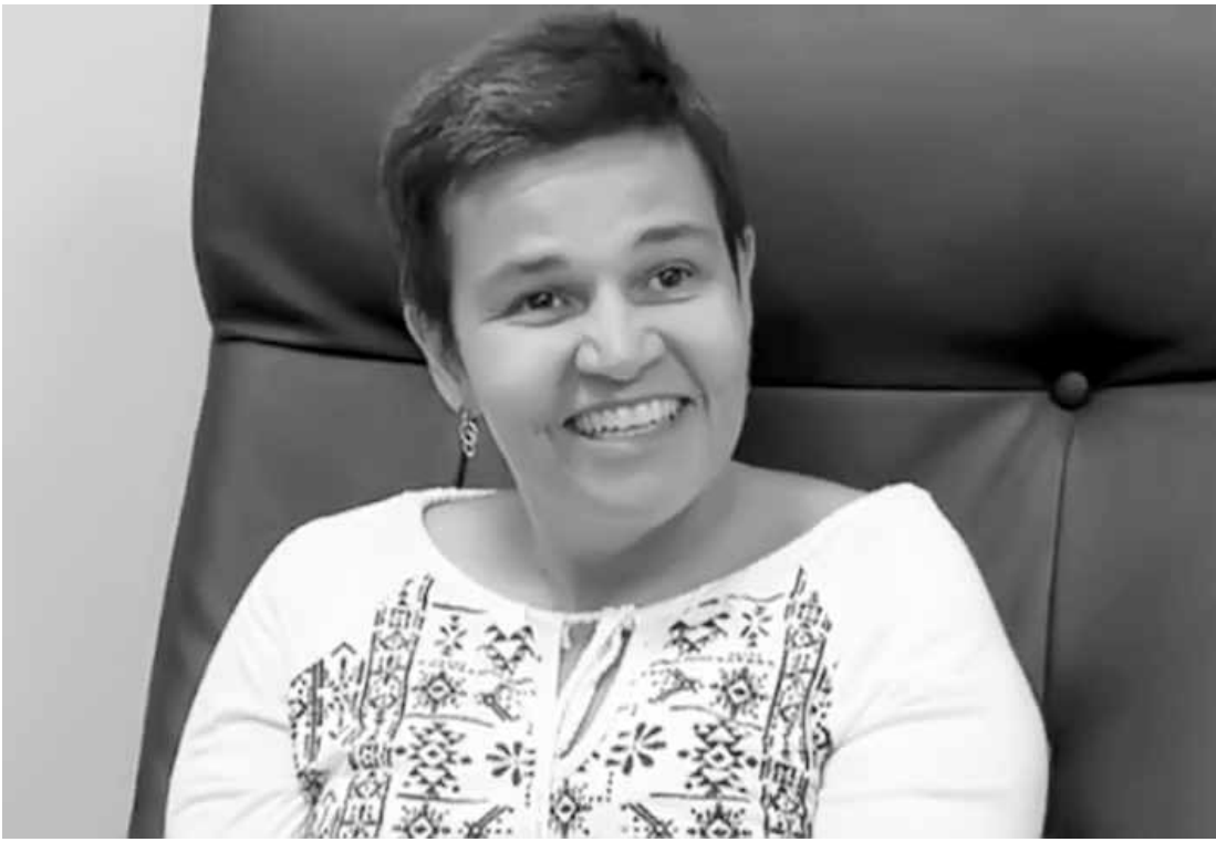
Claudia Rodrigues é entrevistada pelo 'Domingo Espetacular'