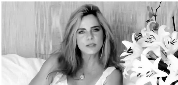
Atriz falou sobre como é trabalhar em família

Na semana passada, o casal batizou a herdeira em uma cerimônia repleta de emoção e também compartilhada nas redes sociais.