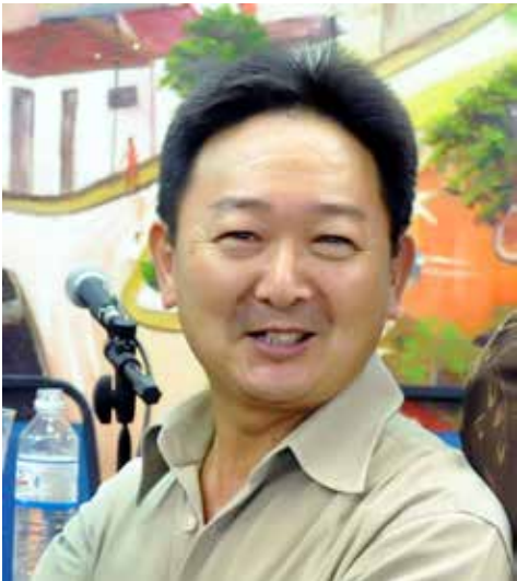
O fotógrafo Roberto Tsuzuki também está na lista dos homenageados. Ele vai apagar velinhas no próximo dia 02, já muitíssimo felicitado pelos amigos.