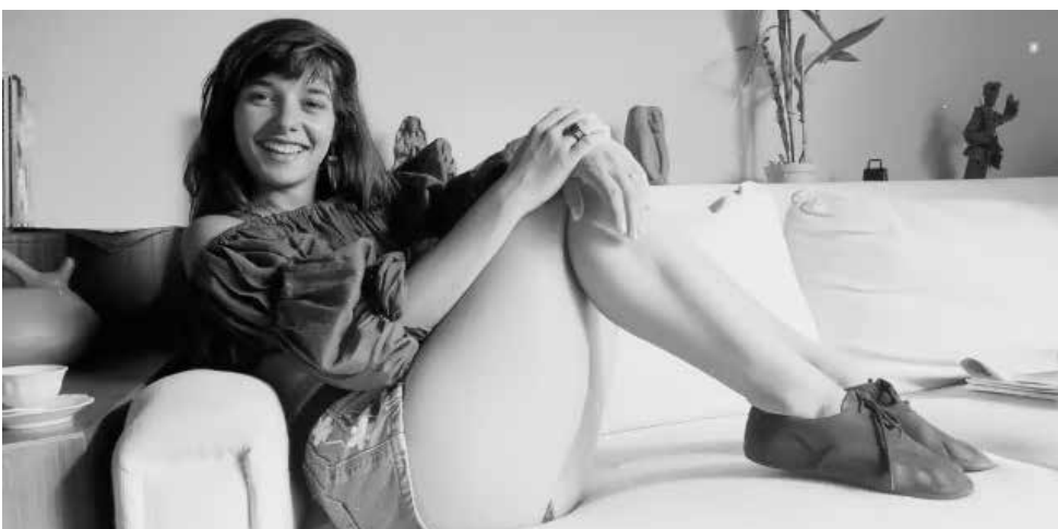
Daniella Perez morreu no dia 28 de dezembro de 1992

Daniella Perez foi assassinada com 18 golpes de tesoura em dezembro de 1992. Guilherme de Pádua, que era seu