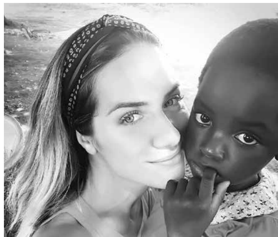
Atriz também desejou felicidades a seus seguidores no Instagram

Bruno Gagliasso usou a mesma rede social para se declarar à família: “Que o amor e a alegria invada e transborde a vida de todos em 2017!”. Bruno também posou apenas com a mulher: “Vivendo e aprendendo juntos, sempre juntos! Ps: e sempre em Noronha!!!”. Antes da viagem ao arquipélago, Giovanna comemorou o Réveillon ao lado da família. “Só amor em Noronha!!!”, escreveu na legenda da publicação Ewbank, que não descarta uma gravidez no futuro para dar irmãozinho à primogênita do casal.