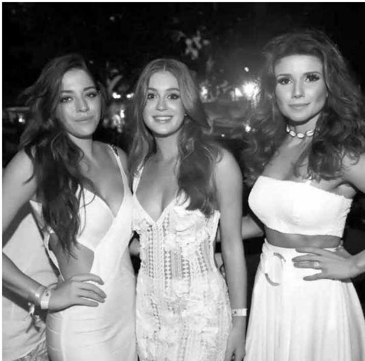
A cantora passou o Réveillon ao lado de Marina Ruy Barbosa, Luma Costa e outros famosos