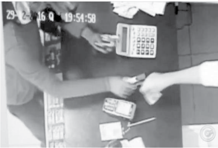
Assaltante rende caixa durante roubo à loja de conveniência em Jales

Levando em consideração o tamanho da cidade, que tem pouco mais de 47 mil habitantes segundo o IBGE, os números são bastante expressivos e assustam os comerciantes. “A gente fica um pouco inseguro, pois estamos trabalhando aqui desde madrugada e chega no fim do expediente uma pessoa chega armada, a gente fica com um pouco de medo”, disse um funcionário da padaria assaltada que não quis se identificar. “Tem uma circulação maior de pessoas e de valores, as pessoas vão à cidade para fazer compras”, justifica o delegado Charles de Oliveira, atribuindo o aumento na criminalidade ao comércio de final de ano. Para prevenir, o delegado recomenda que as pessoas evitem andar com dinheiro pelas ruas. “Recomendamos que as pessoas não fiquem com grandes valores nos caixas dos estabelecimentos e nem à disposição enquanto as pessoas estiverem nas ruas, cuidado quando entram em agências bancárias em casa”.