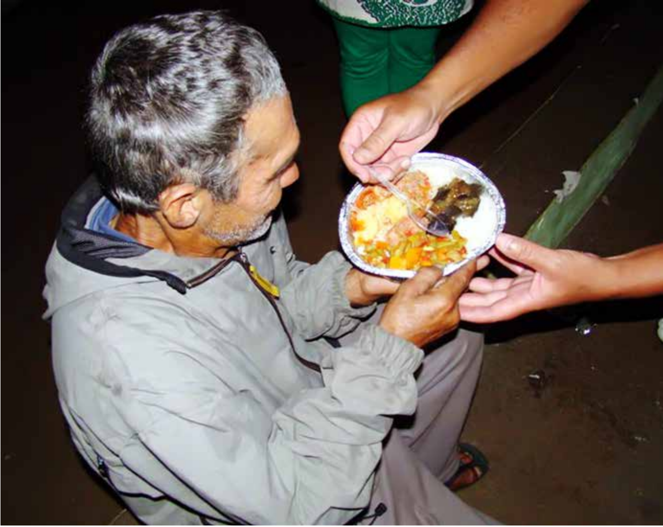
Moradores de rua durante a Ceia de Ano Novo