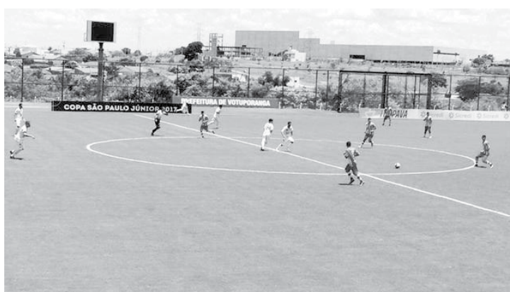
Partida entre CAV e Auto Esporte foi marcada pelo equilíbrio técnico

O duelo terminou mesmo empatado em 1 a 1. Na quinta-feira, dia 5, o CAV volta a jogar às 14h, contra o Brasília-DF.