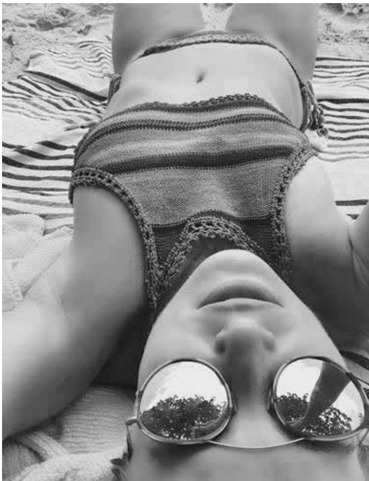
Selfie da apresentadora curtindo o dia de sol na praia