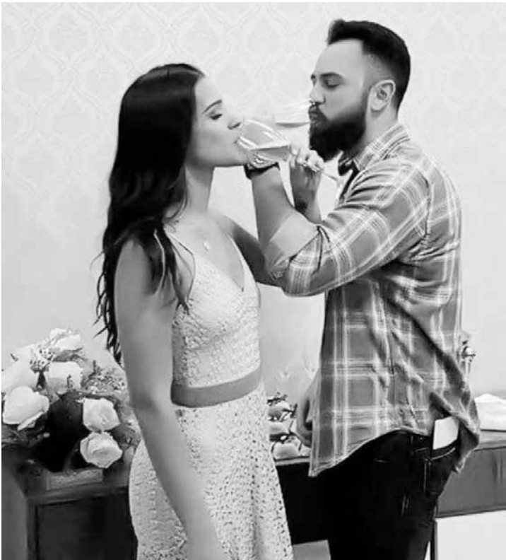
Cantor está feliz com a notícia