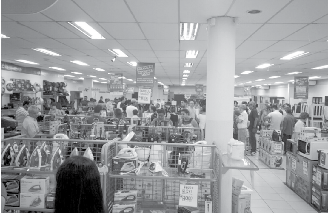
Empurra-empurra e correria para garantir os descontos em loja de eletrodomésticos