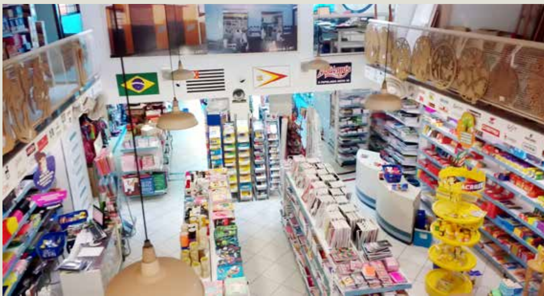
Com mais de 20 mil produtos, hoje a Aquarius atende Fernandópolis e região com qualidade diferenciada e preços, planos e prazos competitivos no mercado