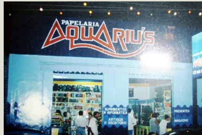
Vinte anos depois, em 1997, Gilmar e Bel assumem o comando da Aquarius e fazem importantes remodelações no prédio, criando um novo conceito no ramo.