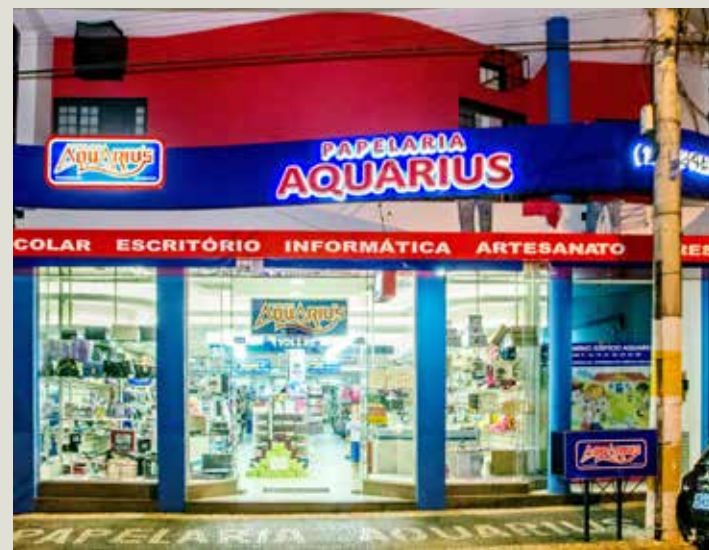
Atualmente com seus mais de 800 m² de área construída, a Aquarius é considerada a maior papelaria do interior paulista.