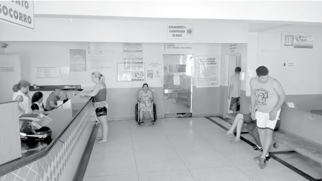
Mas o atendimento segue sendo limitado a pacientes que segurem o regime de regulação, vindos da UPA ou do SAMU

→ JORGE PONTES / JOÃO LEONEL contato@oextra.net