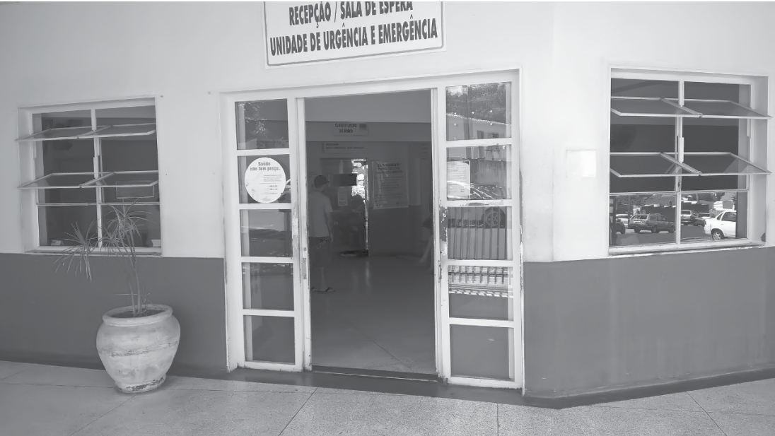
Pronto-Socorro com as portas abertas foi a novidade na manhã de ontem