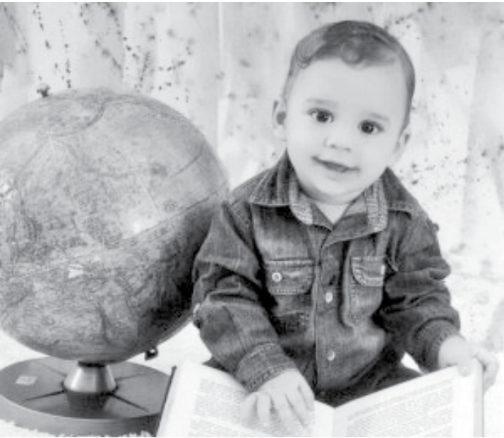
Pequeno Nicolas faleceu aos 11 meses

Criança de 11 meses faleceu na última terça-feira, em Bauru