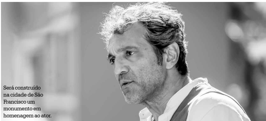
Será construído na cidade de São Francisco um monumento em homenagem ao ator.

isso, a Prefeitura de Canindé de São Francisco, cidade no Sergipe onde aconteceu o acidente, deverá construir um monumento em homenagem ao ator. No entanto, a mesma Prefeita ainda não se manifestou sobre um possível pagamento à família do ator como indenização.