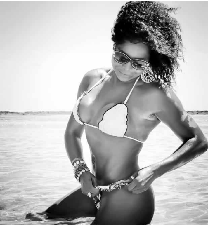
Fãs elogiaram a morena nas redes sociais.