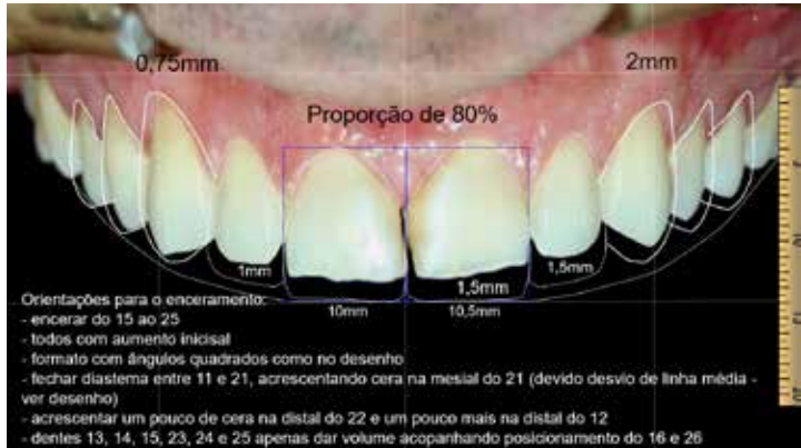
Planejamento DSD (Digital Smile Desing)