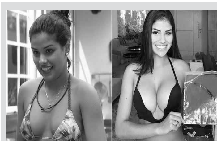
Fãs notaram a diferença no corpo da ex-BBB

ao carnaval carioca: “Já estou em outra há muito tempo. Esse é um período em que tiro férias, viajo e curto minha família, os meus filhos... Para tudo há um tempo na nossa vida”.