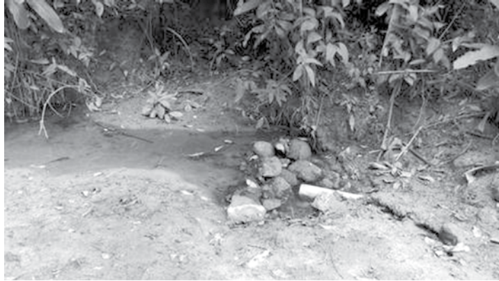
Os policiais encontraram até mesmo um riacho soterrado pelo descarte ilegal de entulhos

De acordo com o delegado responsável pelo caso, Roberto Gomes, equipes em viaturas descaracterizadas se posicionaram em frente à obra e seguiram os caminhões até os terrenos onde realizavam o descarte ilegal dos materiais. Os policiais observaram que duas imensas áreas de floresta foram devastadas e até mesmo