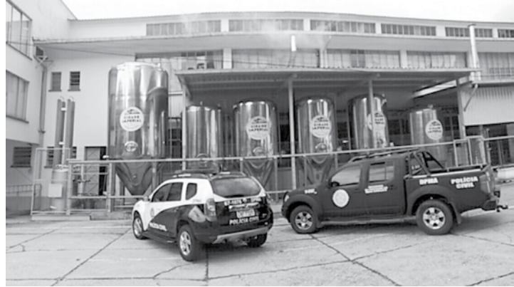
Viaturas da DPMA diante da fábrica da Cidade Imperial, à Rua Mosela, Bairro Bingen, em Petrópolis, Rio de Janeiro