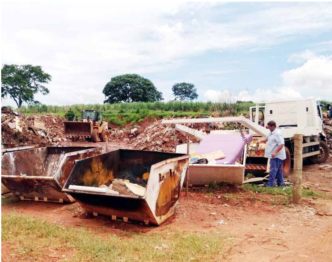
Caçambas com placas indicadoras já estão servindo como depósito de entulhos

do. Vamos mandar máquinas e caminhões para a retirada do material e transporte para um aterro de Meridiano, pagando por tonelada todo o lixo que será destinado para lá. Após a limpeza do local, a ideia é fazer o reflorestamento da área, com o plantio de árvores, para que a situação não se repita”, explicou Angelo Veiga. FISCALIZAÇÃO INTENSA A Secretaria de Meio Ambiente fará um mapeamento de todos os pontos críticos da periferia da cidade, que já está recebendo a visita de fiscais da Prefeitura. Constatadas irregularidades, os locais identificados também receberão caçambas como placas indicadoras para o depósito dos materiais inservíveis, produzidos pelos pequenos geradores de resíduos. “Os grandes geradores devem arcar com os custos”, lembra Veiga.