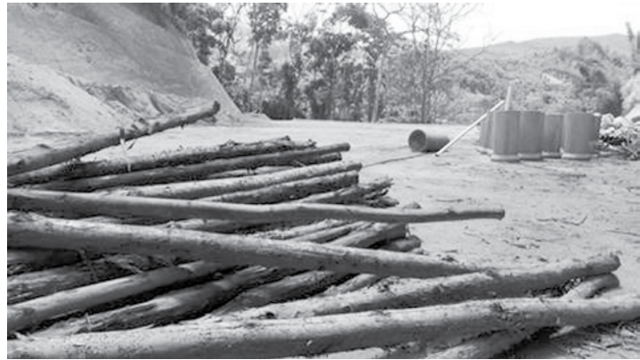
Segundo a Polícia, área foi desmatada de maneira irregular