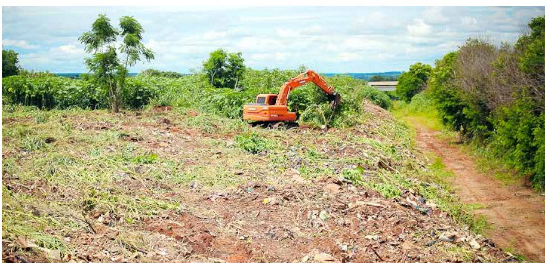
Município realiza serviço de limpeza da área do antigo aterro sanitário; local, que está interditado pela CETESB desde 2011, será lacrado definitivamente