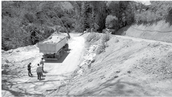
Momento da prisão dos motoristas; na mesma imagem, vista de área devastada