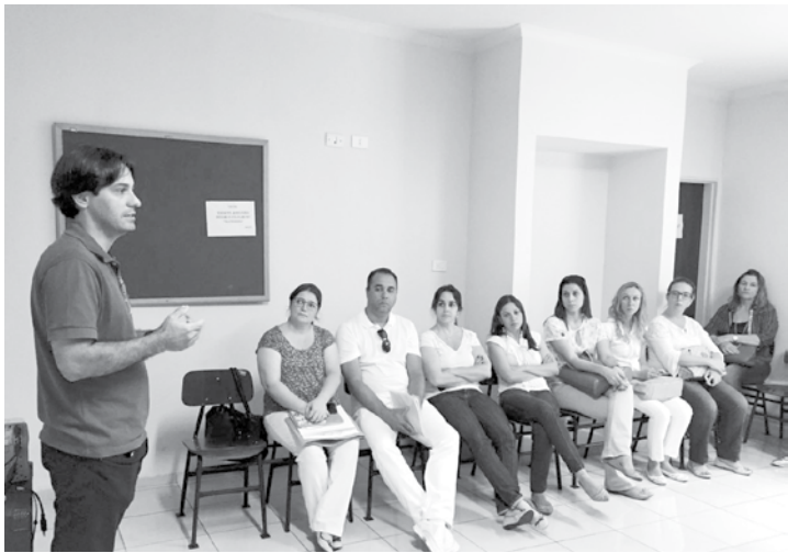
Encontros visam à integração entre os profissionais da área