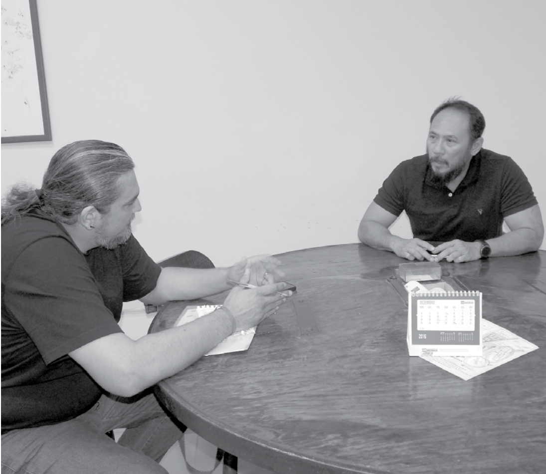
Grupo Arakaki prepara Usina de Açúcar, com investimento de R$ 25 milhões, para iniciar produção em abril

da eleição municipal, como foi aquele momento?