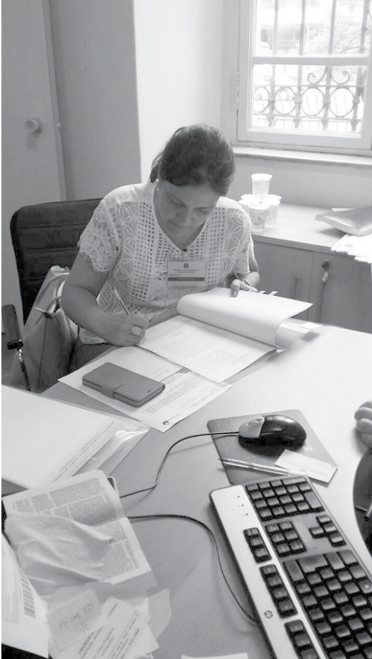
A visita teve como finalidade solicitar a demanda do prédio da Escola Estadual construída no Jardim Esmeralda em Ouroeste