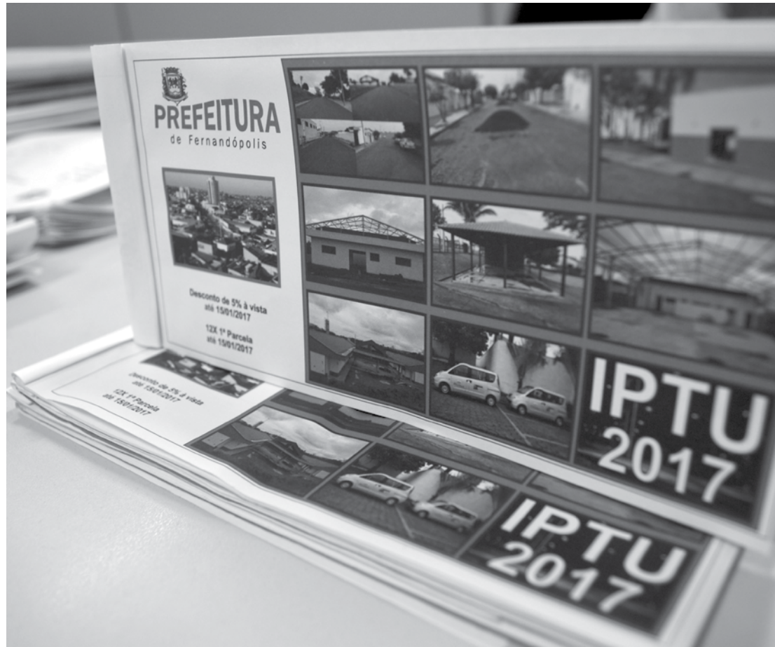
Contribuinte pode quitar a cota única ou optar pelo pagamento à vista com 5% de desconto

Municípios que possuem conta corrente com a possibilidade de DDA (Débito Direto