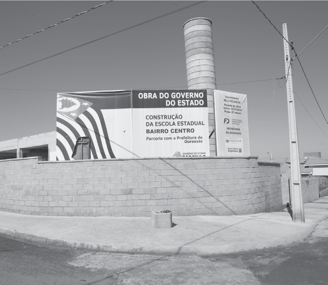
A escola que até então seria estadual passa a ser municipal e comandada pela prefeita.