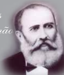
BEZERRA DE MENEZES

Obs: Esta coluna entra em recesso e volta a ser publicada em 25/02/2017