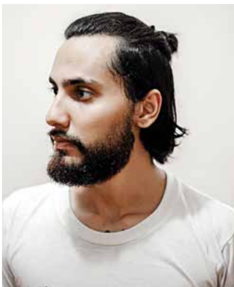
O fotógrafo Rafael Dinato se prepara para comemorar seu aniversário na segunda.