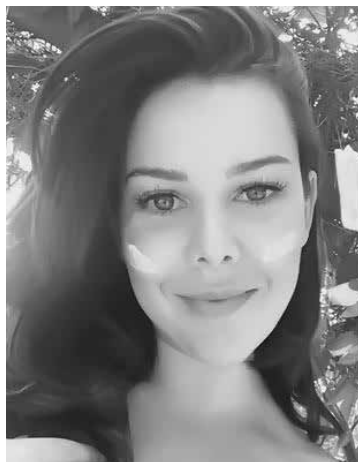
“Sempre sonhei em ser ruiva, mas só agora tomei coragem”