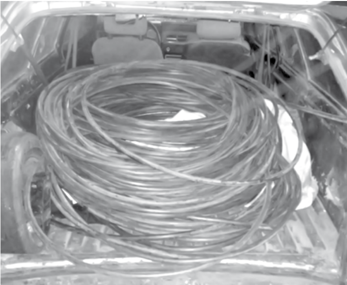
Cerca de 200 metros de fio já haviam sido retirados e estava dentro do porta-malas de um veículo