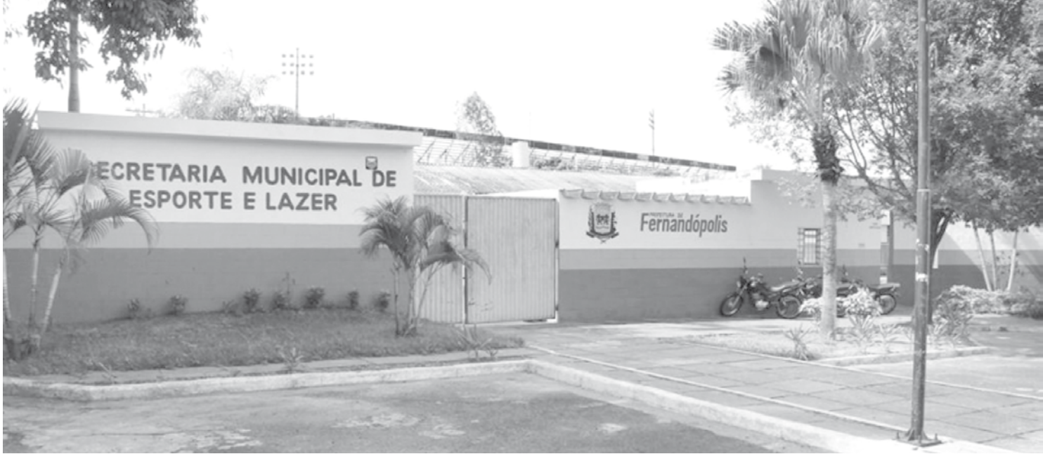
As entrevistas serão realizadas na Secretaria Municipal de Esportes

janeiro. São 10 vagas para professores e 20 para atletas que representam o município em competições de alto rendimento. As 10 vagas do cargo de “Técnico Desportivo Amador” são divididas em oito para graduados em Educação Física; uma para especialista na modalidade Karatê; e uma a especialista em futsal. A carga horária máxima do técnico desportivo será de 50 horas semanais e ele receberá por hora efetivamente trabalhada. A função do profissional será de orientar, supervisionar e lecionar técnicas desportivas de sua especialidade nos núcleos de esportes do município. Para concorrer às vagas do cargo de “Técnico Desportivo Amador”, o candidato deverá possuir habi-