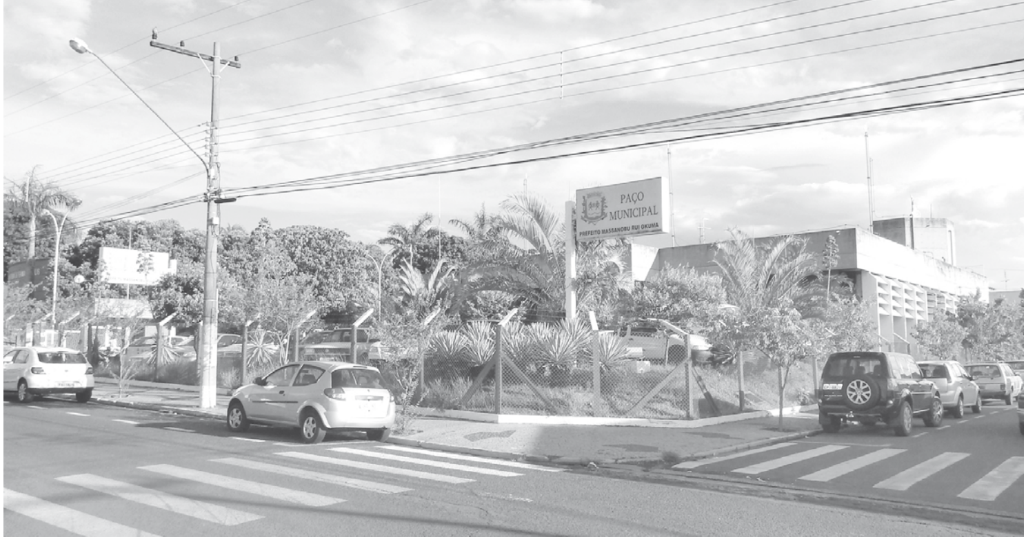
Paço Municipal sediará coletiva na próxima semana, quando o “mapeamento geral” das dívidas da Prefeitura será divulgado