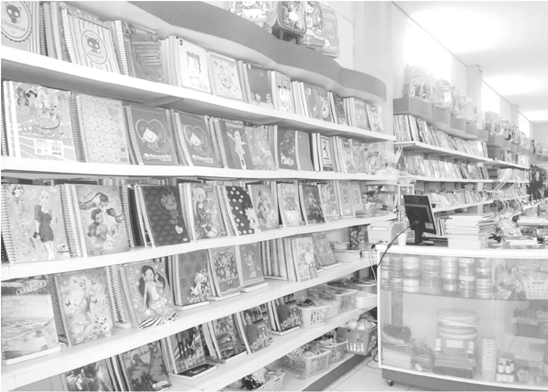
Em Fernandópolis, a expectativa dos estabelecimentos do setor é de aumento nas vendas em comparação com o ano passado

MELHOR PREÇO Com as relações de materiais exigidos nas escolas