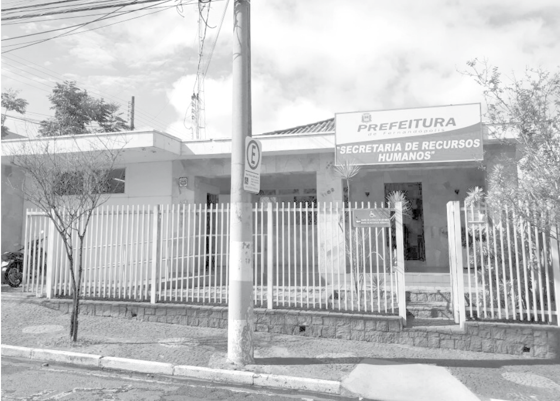
Inscrições serão de 06 a 15 de fevereiro, das 08h às 12h, no Departamento de Recursos Humanos da Prefeitura de Fernandópolis

O Processo Seletivo será realizado no dia 05 de março, às 9h, na EMEF Coronel Francisco Arnaldo da Silva, situada à Av. Milton Terra Verdi, nº 732, Jd. América, composto por prova objetiva, de caráter eliminatório e classificatório, com 25 questões de múltipla escolha nas disciplinas de Português, Matemática e Conhecimentos Gerais / Atualidades.