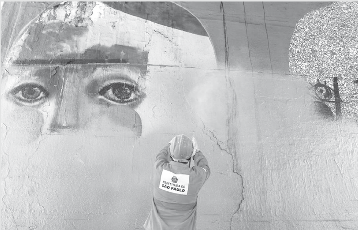
imagem do dia

Homens da Prefeitura de São Paulo apagam somente a metade dos grafites na avenida 23 de Maio, no Centro da capital. Por ordem do prefeito João Doria (PSDB), diversos grafites estão sendo apagados e substituídos por tinta cinza. A medida vem causando polêmica nos últimos dias e divide opiniões.