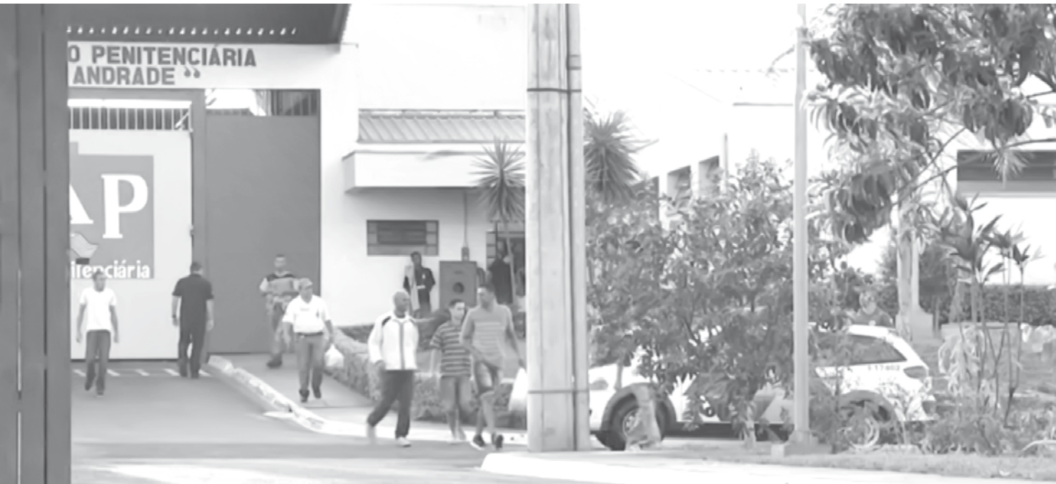
Os 71 presos que não retornaram ao Centro de Progressão Penitenciária de Rio Preto são considerados foragidos

são moradores de Santa Fé do Sul. Ainda de acordo com a Polícia, o grupo já havia retirado cerca de 200 metros de fio, que estava dentro do porta-malas de um veículo. Eles iriam vender o cobre existente no material. Os homens foram encaminhados para a Cadeia Pública de Santa Fé do Sul e a mulher para a Cadeia Feminina de Nhandeara. Até o fechamento desta edição, o trio permanecia à disposição da Justiça.