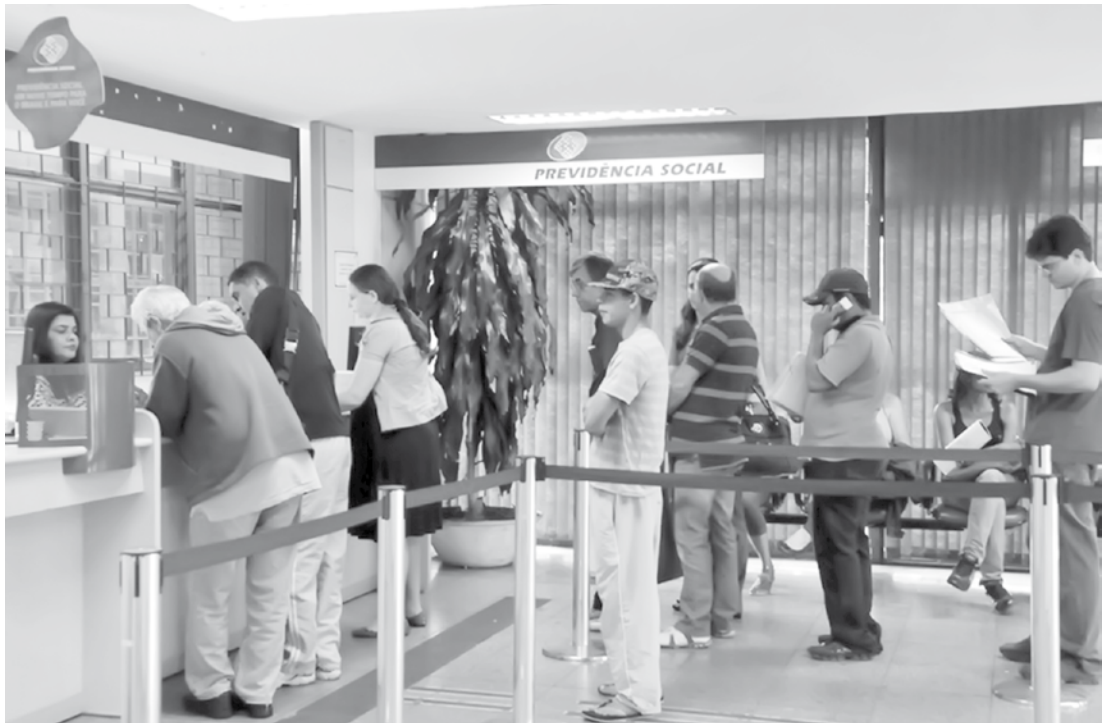
Previdência social paga R$ 34 bilhões por mês em benefícios

O sistema oferece esses benefícios nos casos de doença, invalidez, morte e idade avançada; proteção à maternidade; proteção ao