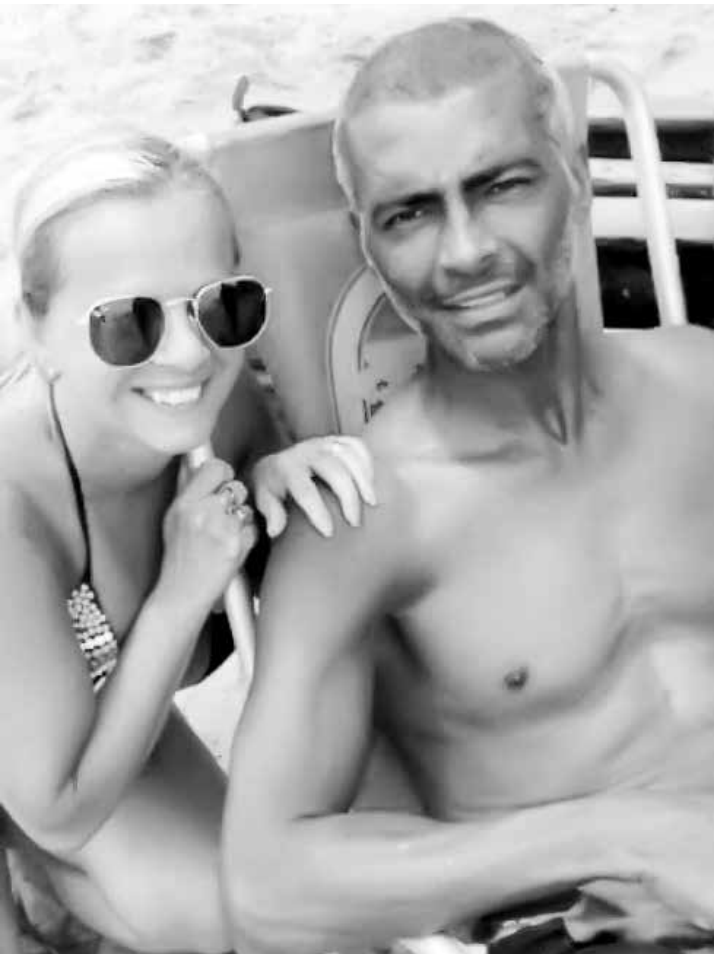
O ex-atleta se submeteu, em dezembro, a uma cirurgia polêmica