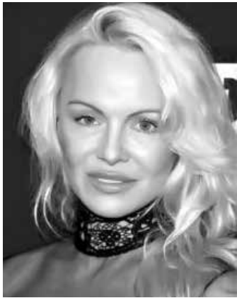
Fãs ficaram assustados com a aparência da atriz

tar sobre o assuntos nas entrevistas. Muitos fãs criticaram a aparência da atriz, que porém, disse não se abalar: “As críticas sempre existem, principalmente neste meio artístico, já aprendi a conviver com elas”.