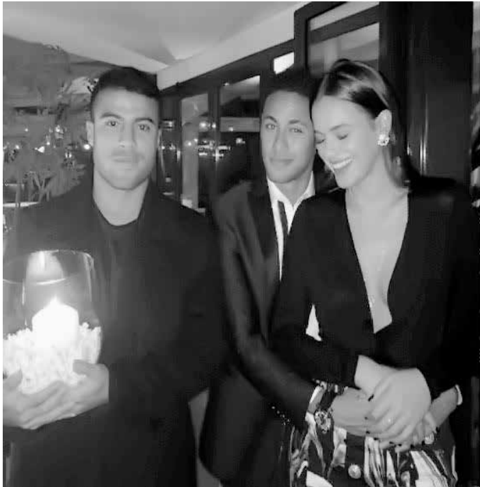
Rafinha, do Barcelona, posta foto com Neymar e Bruna Marquezine e brinca com vela