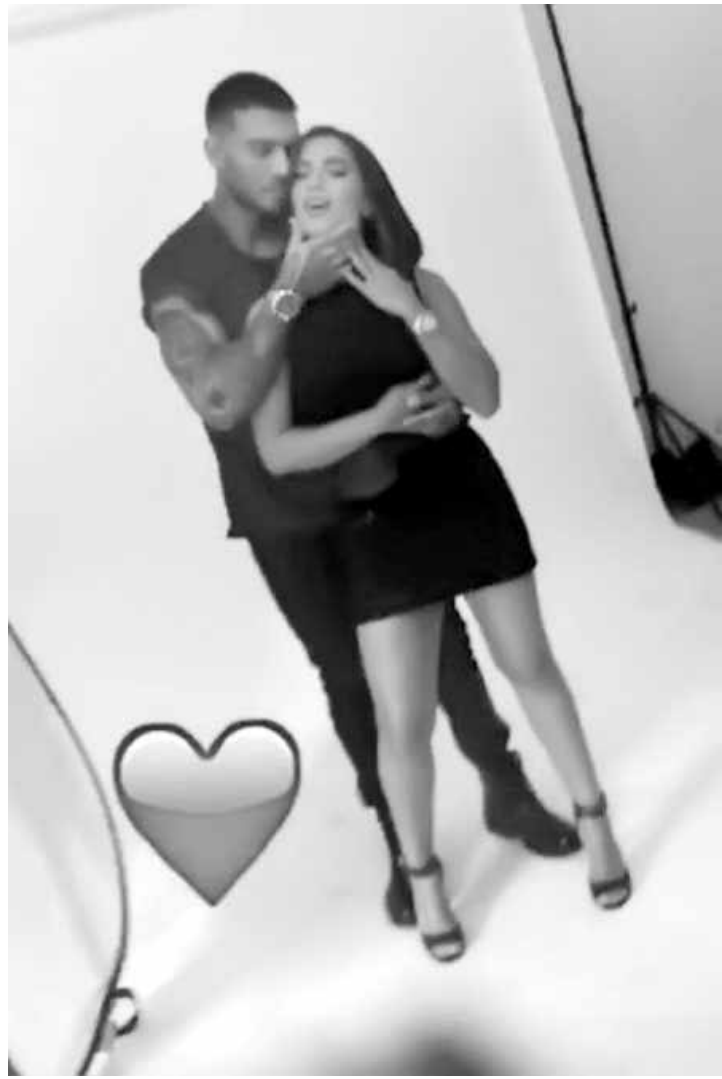
Anitta e Lucas Lucco fizeram um ensaio fotográfico para uma campanha publicitária