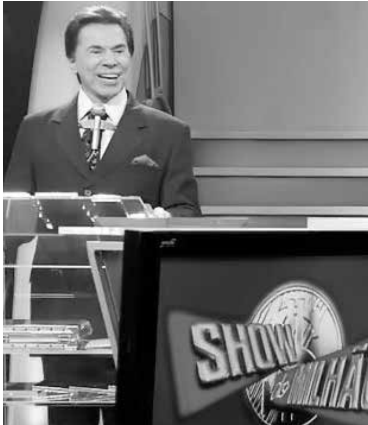
Silvio Santos no “Show do Milhão”

em novembro de 2016, quando a atriz viajou para a Espanha, onde Neymar joga pelo Barcelona. Na mesma época, uma imagem no Snapchat mostrava um quadro de Bruna na casa do jogador, o que deixou a internet em polvorosa