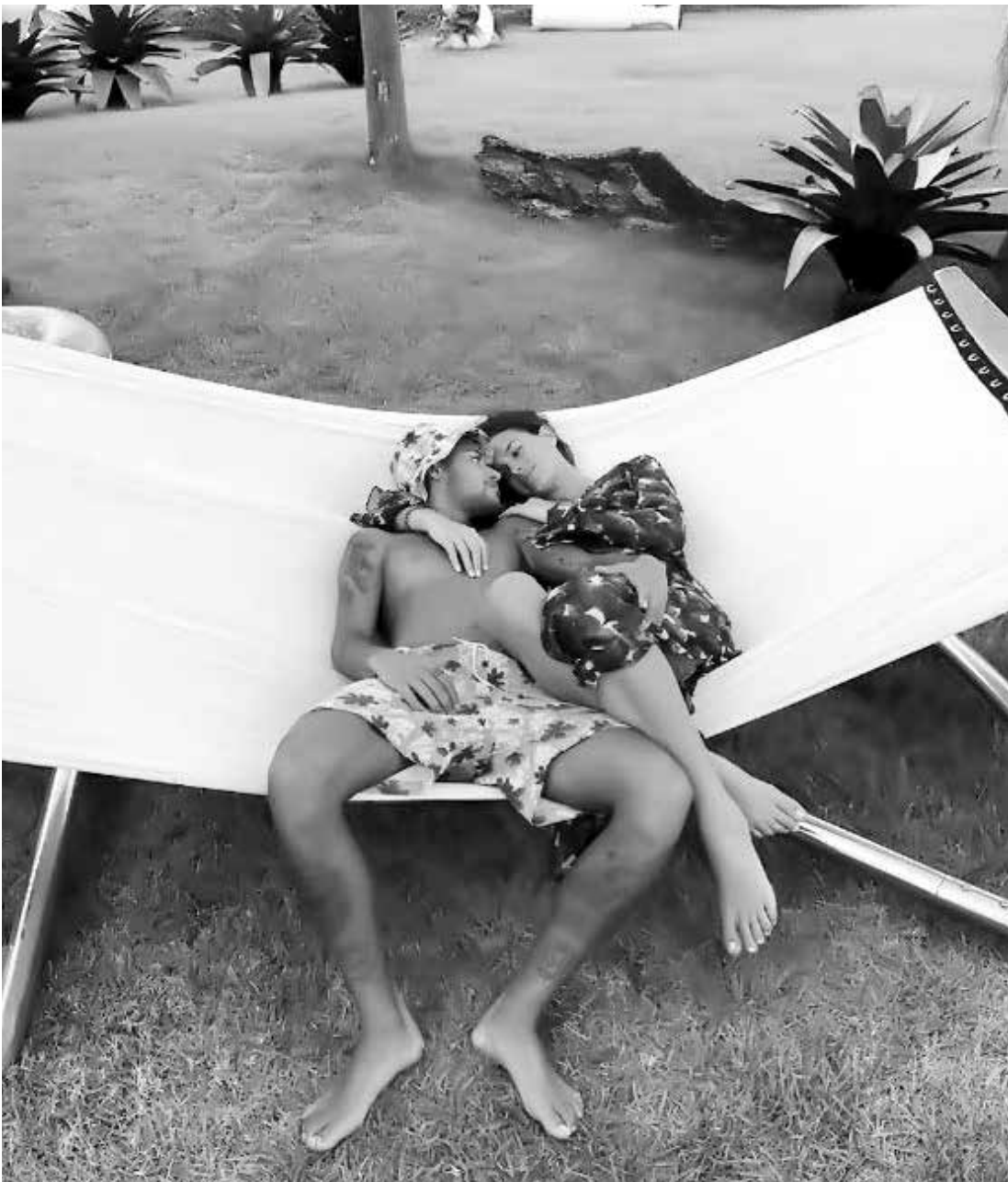
Neymar e Bruna Marquezine em clima de romance

Há duas semanas, a própria Marquezine já havia postado uma foto similar - dá para perceber que a roupa é a mesma - para divulgar o aplicativo de emojis lançado por Neymar. A torcida pela volta do casal #BruMar sempre foi forte e por isso os fãs comemoram bastante a cada nova postagem romântica. Cerca de 20 minutos após a publicação da imagem, o post já tinha mais de 200 mil curtidas e mais de três mil comentários. Recentemente, a atriz passou uma temporada na Espanha ao lado de Neymar, que